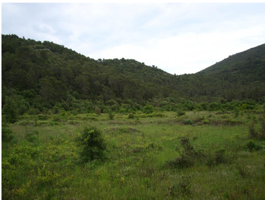
Slika 5. Današnji izgled (2. lipnja 2010.) okolice područja prvobitne introdukcije malog indijskog mungosa na otoku Mljetu.

Ispuštanje mungosa na otok Mljet urađeno je 25. kolovoza 1910. godine na zapadnoj strani otoka, u široj okolici sela Govedari, u području „Vodice“ iznad Kneže polja (Slika 5). Danas je to područje obuhvaćeno granicama Nacionalnog parka „Mljet“.