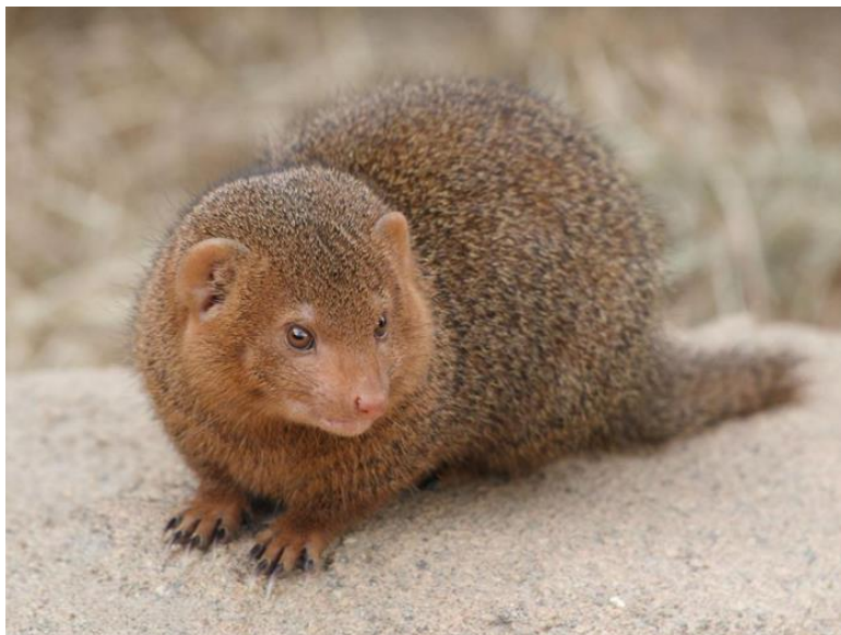
Slika 1. Mali indijski mungos

U usporedbi s tijelom noge su mu relativno kratke. Na nogama ima pet prstiju s dugim i jakim pandžama, a tabani su goli. Cijelo tijelo i rep dobro su obrasli dlakom, jedino su prsti na šapama, njuška i područje oko očiju slabije dlakavi. Na glavi ima kratke ovalne uške. Rep mu završava čuperkom dlaka poput kista. Ima osjastu dlaku do 7 cm duljine. Osnovna boja dlake je siva sa srebrnim preljevom, dok su glava i noge bez odsjaja pa izgledaju tamnije. Na obrazima i podbratku dlaka je crvenkasta što mungosu daje prepoznatljiv izgled. Česte su razne varijacije u obojenosti dlake pa je teško pronaći potpuno iste primjerke (Mustapić i sur., 2004).