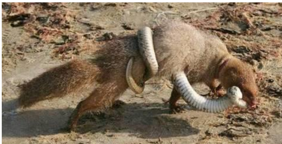
Slika 4. Mungos u borbi sa zmijom.