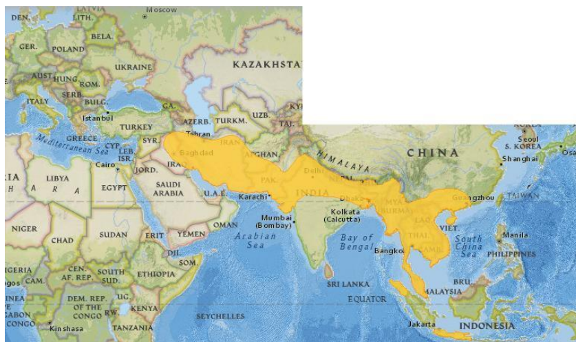
Slika 2. Područja prirodne rasprostranjenosti malog indijskog mungosa u svijetu.

Mali indijski mungos prirodno je rasprostranjen u području od Arapskog poluotoka, preko sjeverne Indije do jugoistočne Azije (Slika 2). Introduciran, tj. namjerno je unijet na neke otoke Tihog oceana (Havaji, Fidži, Okinawa), Indijskog oceana (Komori, Mauricijus), Karipsko otočje (Jamajka, Portoriko, Trinidad), Venecuelu i Surina. U Europi je poznati primjer introdukcije na otok Mljet u Jadranskom moru (Slika 3). Prvobitni razlozi introdukcije bili su kontrola populacije štakora (npr. na Karibima u nasadima šećerne trske) i zmija (npr. na otoku Mljetu), ali svugdje su ubrzo postali prijetnja zavičajnoj fauni. Lokalno su bila moguća i nenamjerna prekomorska naseljavanja sa mungosima kao „slijepim putnicima“ ( http://hr.wikipedia.org/wiki/Indijski_mali_mungos ).