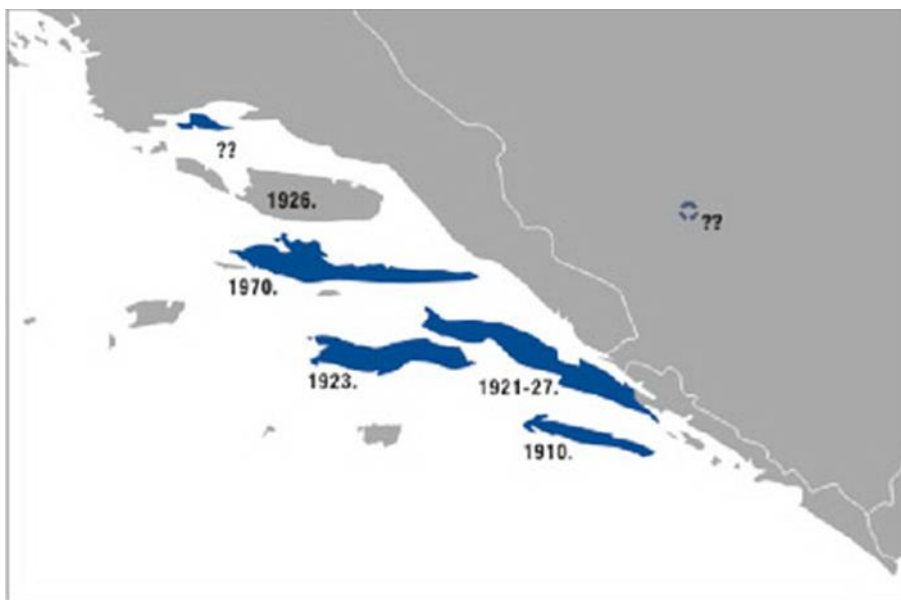
Slika 7. Dinamika širenja populacije malog indijskog mungosa na jadranskim otocima.

Tjedan dana po ispuštanju (31. kolovoza 1910.) mungosi su primijećeni kod Solina, 17 km udaljeno od mjesta ispuštanja, a u rujnu 1911. godine kod lučice Pomena opažena je ženka s mladima. Kako su, uz sitne glodavce, zmiје postale glavni plijen mungosa, dva njemačka istraživača 1927. godine nisu mogla na cijelom otoku naći niti jednu otrovnicu. To je potaknulo mještane susjednih otoka da i oni provedu naseljavanje (Slika 7).