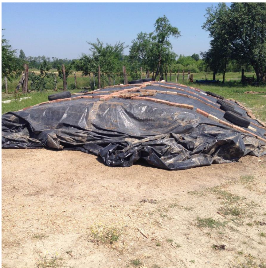
Slika 11. Silaža kukuruza na OPG-u