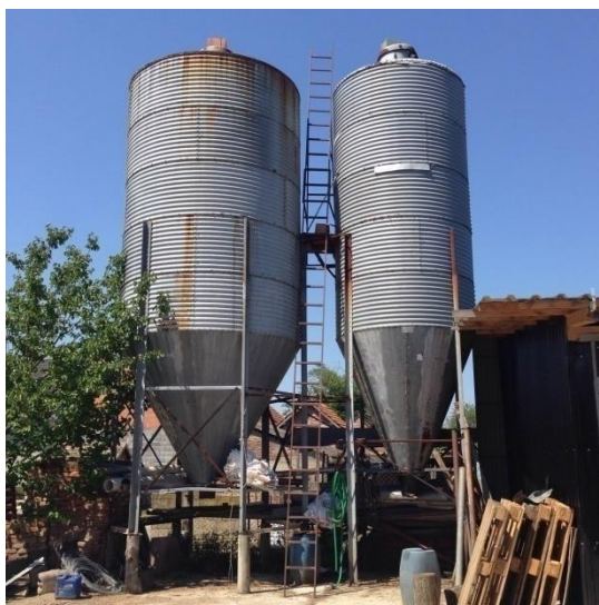
Slika 6. Vertikalni silos