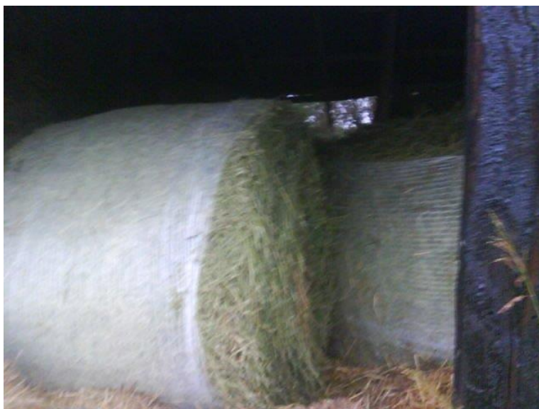
Slika 13. Sijeno lucerne