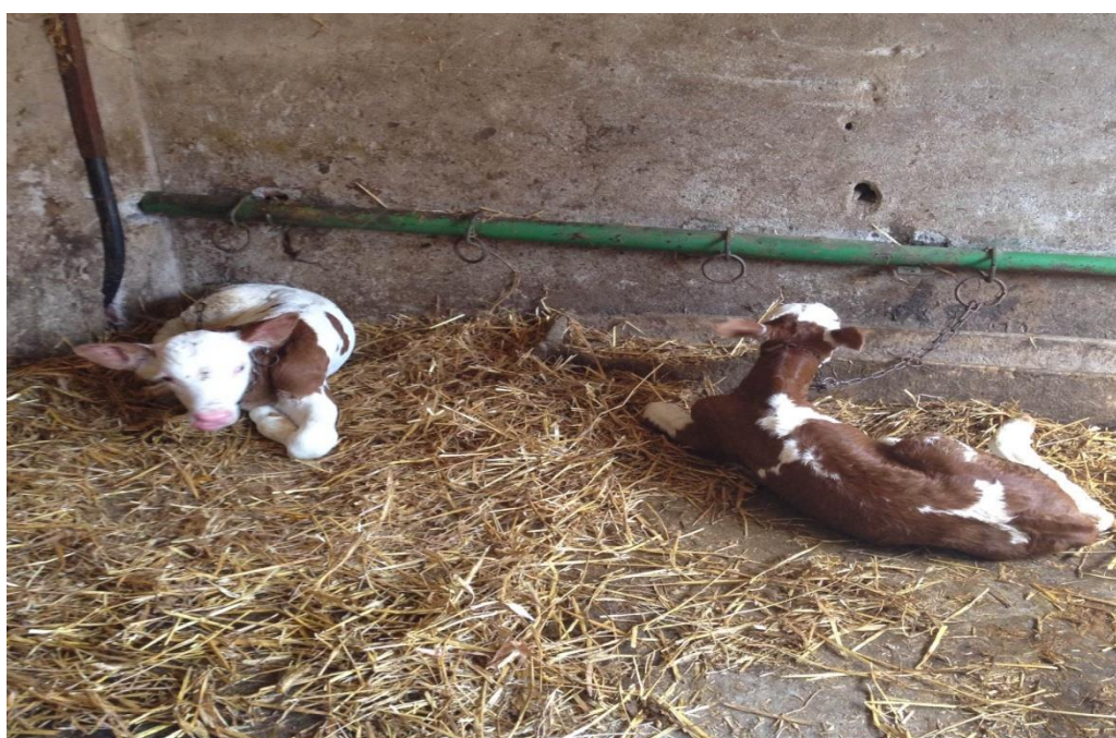
Slika 8. Sisajuća telad