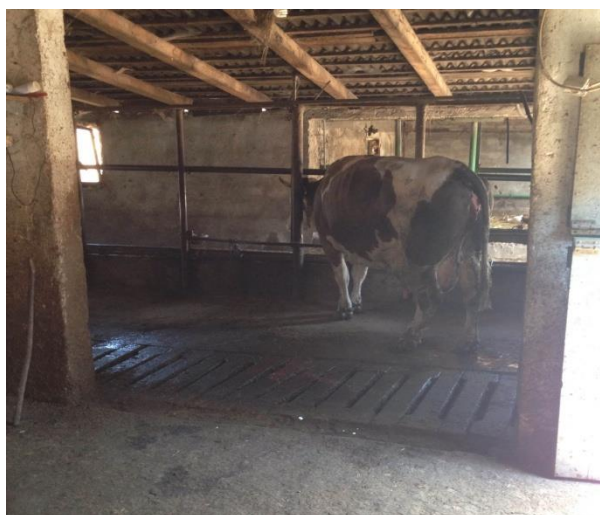
Slika 2. Krava na vezu