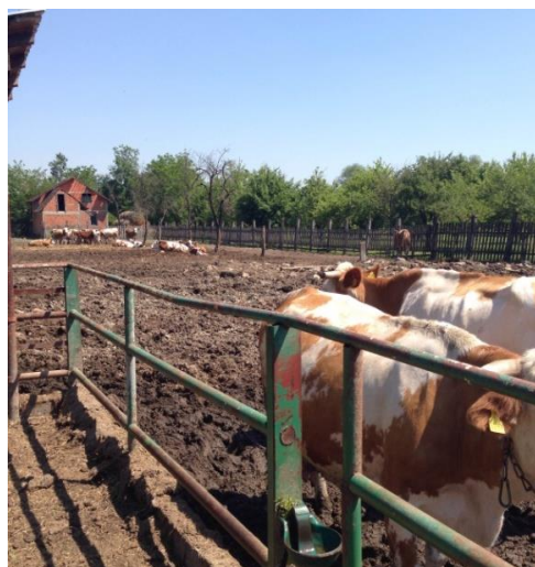
Slika 3. Krave na ispustu