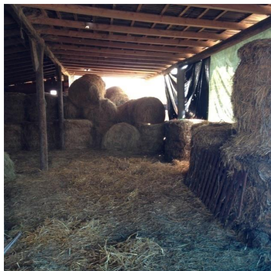
Slika 5. Rolo bale