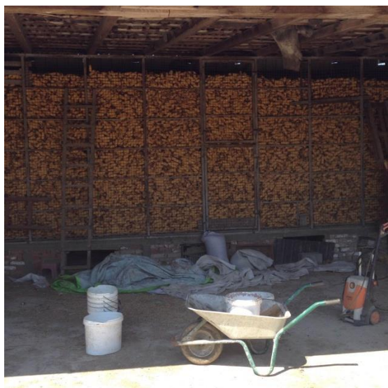
Slika 4. Kukuruz u košu