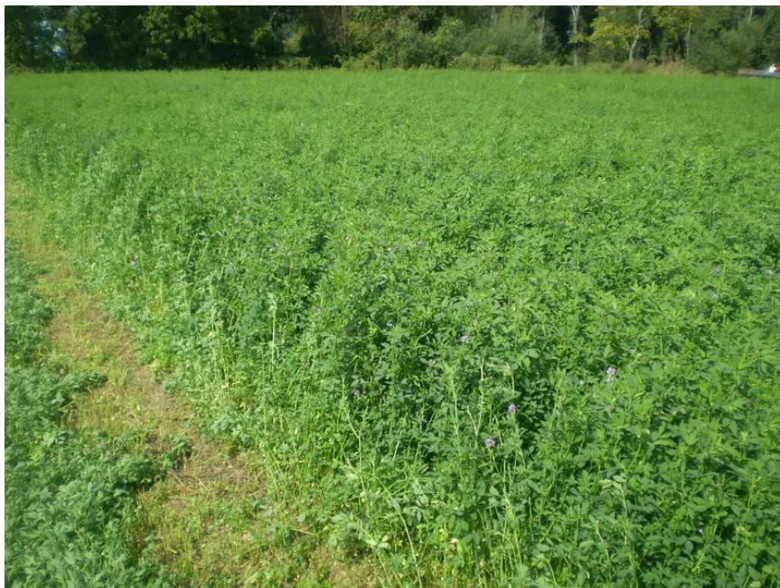
Slika 12. Usjev lucerne na OPG- u