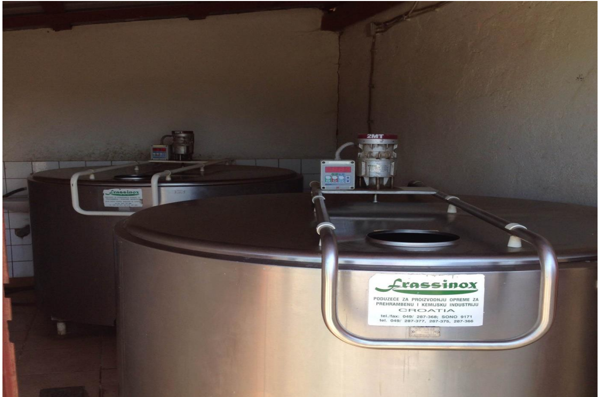
Slika 9. Laktofrizi

OPG Cvitković sadrži dva rashladna bazena za mlijeko (tzv. laktofrizi) tipa RBH, kapaciteta 200 l i 1600 l (Slika 9.). Laktofrizi su proizvedeni od nehrđajućeg čelika s ekološkom poliuretanskom termo-izolacijom te su prilagođeni za rad na vrlo visokim ambijentalnim temperaturama.