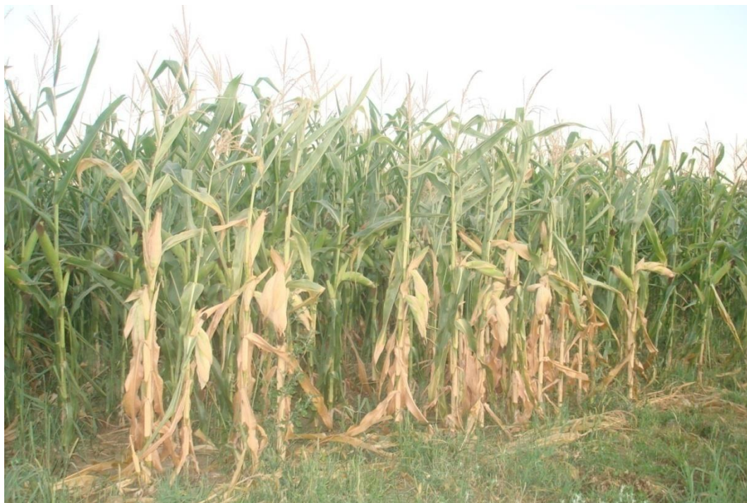
Slika 10. Usjev kukuruza na OPG-u Cvitković

Proizvodnja zrna kukuruza na OPG-u Cvitković provodi se na prosječno 10 ha, što je bio slučaj i u 2014. godini. Cjelokupna proizvodnja namijenjena je hranidbi goveda. Osnovna obrada tla provedena je jesenskim oranjem dubine 25-30 cm. Oranjem se zaoravaju ostatci biljaka, odnosno predkultura ( ječam ). Nakon oranja, na tlu se ne radi ništa sve do proljeća kad počinje dopunska obrada tla. Pod dopunskom obradom tla podrazumijeva se usitnjavanje, miješanje i poravnavanje izoranoga tla u površinskom sloju kako bi se postigla sitna mrvičasta struktura, pogodna za sjetvu kukuruza. Dopunska obrada tla obavlja se lakom tanjuračem ili sjetvospremačem. Startna gnojidba s NPK 15:15:15 u dozi 400 kg/ha i 200 kg urea/ha te gnojidba sa stajnjakom oko 30 t/ha. Sjetva kukuruza odvija se sredinom travnja ako vrijeme nije hladno i kišovito. Sjetva se obavlja rasipačem mineralnih gnojiva na razmak redova 70 cm. U borbi protiv korova koriste se mehaničke i kemijske metode. Košnja zelene mase za silažu tijekom rujna, u voštanoj zriobi zrna, silokombajnom, siliranje u ekonomskom dvorištu, u horizontalnom silosu ( Slika 10.)