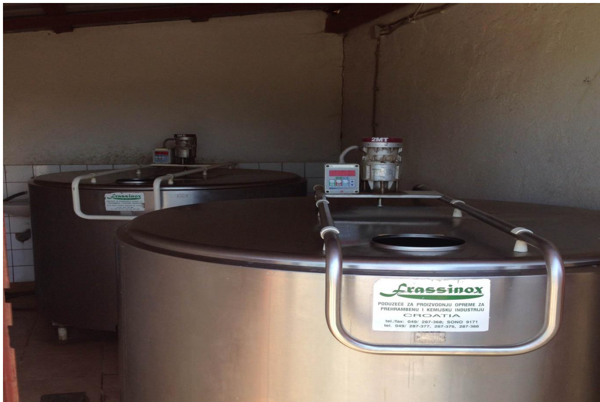
Slika 9. Laktofrizi

OPG Cvitković sadrži dva rashladna bazena za mlijeko (tzv. laktofrizi) tipa RBH, kapaciteta 200 l i 1600 l (Slika 9.). Laktofrizi su proizvedeni od nehrđajućeg čelika s ekološkom poliuretanskom termo-izolacijom te su prilagođeni za rad na vrlo visokim ambijentalnim temperaturama.