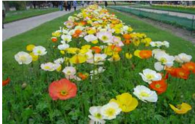
Slika 14.: Islandski makovi u botaničkom vrtu Jardin des Plantes , Pariz

Najčešće se uzgaja kao dvogodišnja biljka. Cvjetovi mogu biti različitih boja – bijeli, žuti, narančasti ili crveni te ih karakterizira blag miris. Boje se generacijama dobro prenose sisanjem, pa se sjeme smatra najboljim načinom razmnožavanja ove vrste.