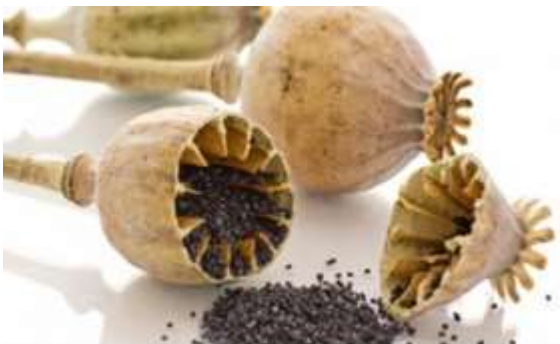
Slika 7.: Zreli tobolci i sjeme maka