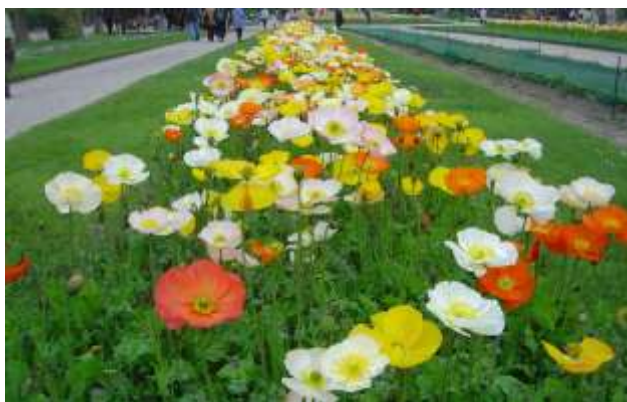
Slika 14.: Islandski makovi u botaničkom vrtu Jardin des Plantes , Pariz

Najčešće se uzgaja kao dvogodišnja biljka. Cvjetovi mogu biti različitih boja – bijeli, žuti, narančasti ili crveni te ih karakterizira blag miris. Boje se generacijama dobro prenose sisanjem, pa se sjeme smatra najboljim načinom razmnožavanja ove vrste.