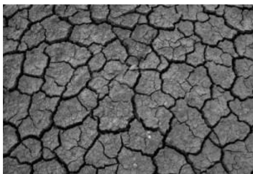
Slika 14.: Crna pamučna tla u srednjoj Indiji

Aloe vera raste u vrućim područjima s malom količinom oborina. Za uzgoj Aloe vere najidealnija je količina oborina od 1000 – 1200 mm (Biswas, 2010.). Najpogodnije tlo za rast Aloe vere je dobro drenirano tlo s velikom količinom organske tvari, iako se može uspješno razvijati na svim tipovima tla (Manwitha i Bidya, 2014.). Najuspješnije raste u rubnim područjima niske plodnosti tla. Biljke imaju tendenciju podnošenja visokog pH s visokom koncentracijom Na i K soli. Smatra se da Aloe vera brže raste u tlu srednje plodnosti kao što su crna pamučna tla u srednjoj Indiji (Slika 14). Za komercijalni uzgoj poželjna su tla umjerene plodnosti s pH do 8.5 kao što je dobro drenirana ilovača i grubo pjeskovita ilovača (Slika 15) (Rajeswari i sur., 2012.). Odgovara joj rast na sunčevoj svjetlosti, dok rast u hladovini i sjeni rezultira napadom bolesti (Manwitha i Bidya, 2014.).