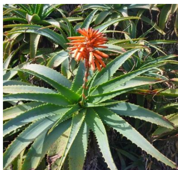
Slika 9.: Aloe arborescens

Aloe variegata je ukrasna biljka, podrijetlom iz južne Afrike. Naziva se još tigrasta ili šarena aloja. Svoje ime duguje svijetlim paralelnim trakama na trobridnim listovima. S obzirom na to da ne raste više od 50 cm pogodna je za stanove jer bolje uspijeva u sjenovitijim predjelima. Zahtijeva bogatije supstrate te obilje vode tijekom ljetnih mjeseci. Cvjeta nakon 3 – 6 godina, od siječnja do travnja (Slika 11) (Davis, 2009.).