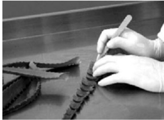
Slika 21.: Metoda „cijeli list“

ovih tvari odvija se dodatnim procesom; filtriranjem ugljikom što rezultira smanjenjem gorčine i pridonosi boljem okusu. Tijekom ovog dodatnog procesiranja dolazi do gubitka hranjivih tvari što rezultira produktom Aloe vere koji se ne može mjeriti s kvalitetom prvotne „cijeli list“ metode.