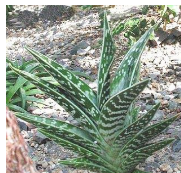
Slika 11.: Aloe variegata

http://www.aloe-vera-and-handy-herbs.com/the-truth-about-aloe-ferox.html