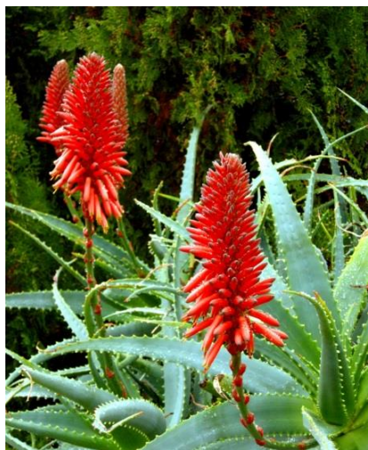
Slika 7.: Crveni cvijet Aloe vere

Iz lisne rozete raste cvjetna stabljika koja završava žutim ili crvenkastim cvjetovima skupljenim u grozdastu cvat (Kišgeci, 2008.). Cvjetovi slične na trubice i mogu biti najrazličitijih boja – od bijele do žute i crvene (Slika 7 i Slika 8) (Ledwon, 2007.).