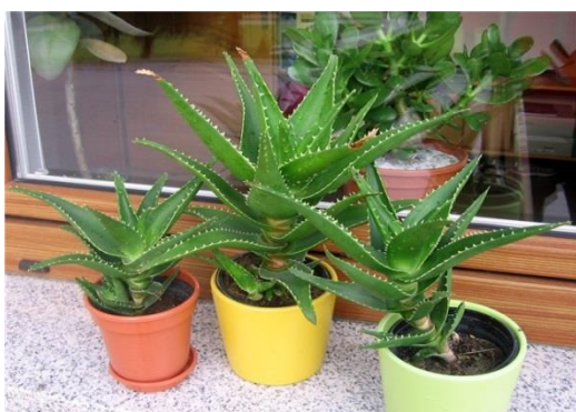
Slika 28.: Biljka Aloe vere kao lončanica

Činjenica da se biljka Aloe vere može uzgajati svuda po svijetu pokazuje koliko je velika njezina sposobnost adaptacije i koliko je širok opseg različitih klimatskih uvjeta kojima se može prilagoditi (Ledwon, 2007.). Aloe najčešće raste na otvorenim poljima, no mogu se uzgajati u loncima koji se čuvaju na osunčanoj južnoj ili istočnoj strani prozora (Slika 28 i 29) (Rajeswari i sur., 2012.). Mnoga znanstvena istraživanja su pokazala da je veličina biljke i količina alojina u listovima izravno proporcionalna s količinom svjetlosti koju biljka dobiva. Uočeno je da starijim biljkama godi sunce, dok mladim biljkama Aloe vere više odgovara sjena (Ledwon, 2007.).