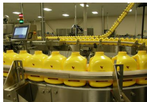
Slika 23.: Čuvanje gela Aloe vere u bocama

http://www.californiaconcept.com/aloe_vera.htm