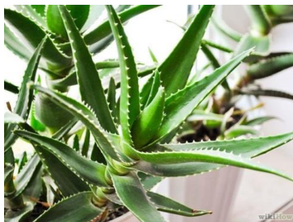
Slika 3.: Lišće Aloe vere

Iz kratke stabljike u blizini tla rastu zeleni, mesnati listovi Aloe vere koji su zaštićeni trnjem. Široki su 10 – 13 cm, duljine 25 – 30 cm te imaju ispupčenu donju stranu, a gornju udubljenu (Slika 3). Biljka nakon 3 godine ima zrelo lišće, a uobičajena masa u potpunoj zrelosti je 0.7 – 1.5 kg (Manwitha i Bidya, 2014.).