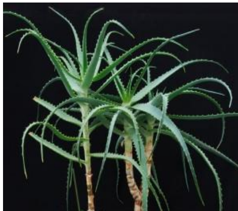
Slika 2.: Stablo Aloe arborescens

http://lijecenjebiljem.blogspot.com/2012_10_01_archive.html