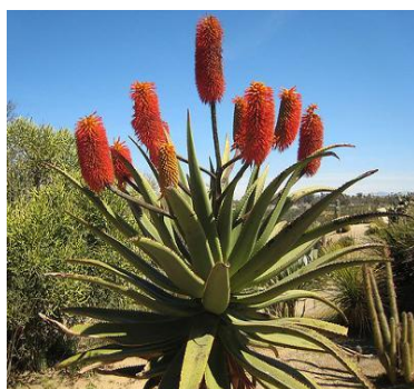
Slika 10.: Aloe ferox