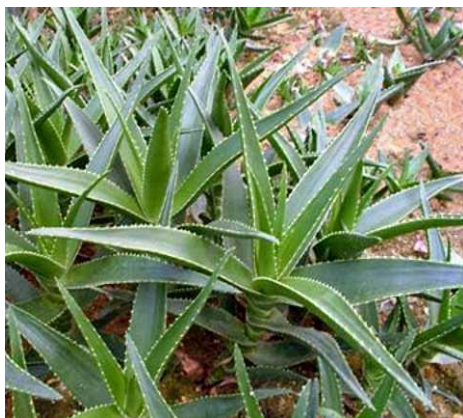
Slika 1.: Stablo Aloe vere