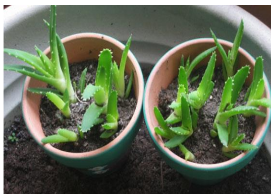
Slika 29.: Biljka Aloe vere kao lončanica

http://www.cvijet.info/forum/forum_posts.asp?TID=713&PN=27