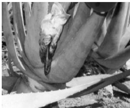
Slika 18.: Ručno branje listova Aloe vere na poljima