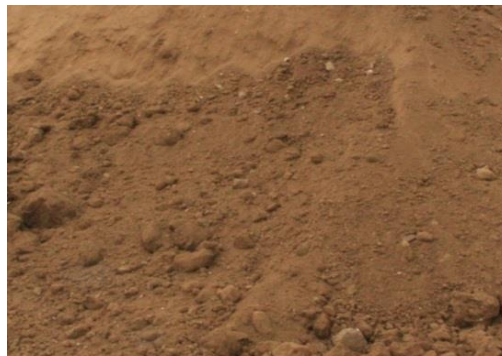
Slika 15.: Grubo pjeskovita ilovača