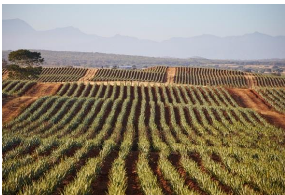
Slika 12.: Plantaže Aloe vere u Meksiku

Aloe vere najčešće raste u vrućim i suhim pustinjama, no zbog svoje prilagodljivosti uspješno raste na travnjacima, obalama te u planinskim područjima (Manwitha i Bidya, 2014.; Davis, 2009.). Zbog malih zahtjeva za uzgojem i njegom, Aloe vera se uspješno uzgaja kao lončanica na pjeskovitim i šljunkovitim tlima te na plantažama (Shelton, 1991.). Danas se plantaže Aloe vere nalaze u Africi, Australiji, srednjoj Americi, Meksiku, Rusiji, Japanu te u južnoj Europi, posebno u Španjolskoj. Smatra se da Španjolska, Grčka i Izrael imaju najbolja područja u svijetu za proizvodnju organske Aloe vere (Bassetti i Sala, 2005.). Svake godine usporedno s povećanjem potražnje, površine plantaža Aloe vere se povećavaju, posebno duž nepreglednih pustinjskih prostranstava Teksasa i Meksika. Tako se na plantažama u Meksiku, tj. u dolini rijeke Rio Grande, Aloe vera uzgaja na više stotina tisuća hektara (Slika 12 i Slika 13) (Harrison, 2001.). U Hrvatskoj se Aloe vera uzgaja u Istri i Dalmaciji, no te površine su male i nedovoljne za postizanje velikih prinosa.