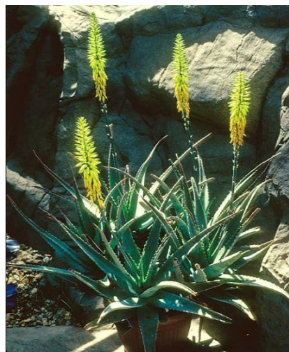
Slika 8.: Žuti cvijet Aloe vere