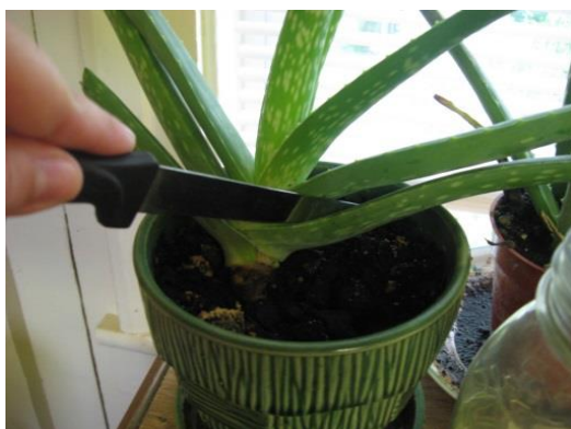
Slika 30.: Ručno branje listova Aloe vere kao lončanice

Životni vijek Aloe vere traje u prosjeku 12 godina, no nakon 4 godine one postižu zrelost te su spremne za branje. Biljke se beru svakih 6 – 8 tjedana odstranjivanjem 3 – 4 lista po biljci (Slika 30) (Rajeswari i sur., 2012.).