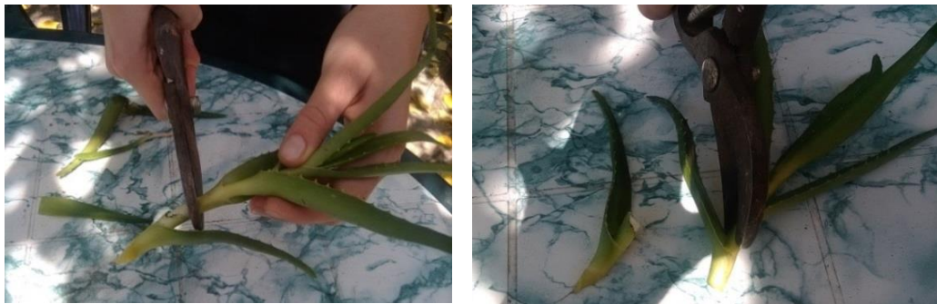
Slika 16. a, b.: Razmnožavanje Aloe vere lisnim reznicama

Mogu se razmnožiti lisnim reznicama, što je ujedno i najčešći način razmnožavanja te vrste. Dovoljno je vrtnim škarama razdvojiti listove s dijelom stabljike i posaditi ih. Naravno, rezultate ne treba očekivati odmah, jer ukorjenjivanje Aloa , baš kao i drugih sukulenata, traje obično barem mjesec dana (Slika 16 a i b).