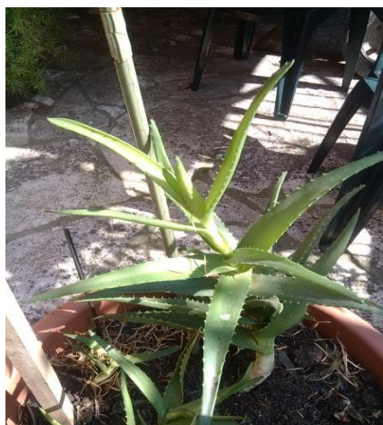
Slika 4.: Lišće Aloe vere