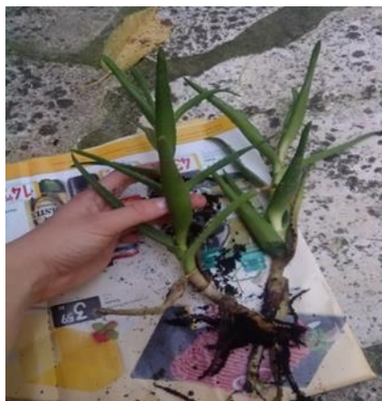
Slika 17.: Mladice Aloe vere

Najjednostavniji način razmnožavanja Aloe i rasađivanja mladica je da se pažljivo odvoji izdanak sa dna ili pupoljak matične biljke i da se on zasadi (Ledwon, 2007.). Već u drugoj godini života Aloa vera obično sama pobrine za svoje potomstvo stvarajući iz korijena nove mladice. Tada ih treba samo odvojiti (rezanjem korijena) i nove biljke presaditi na novo mjesto (Slika 17).