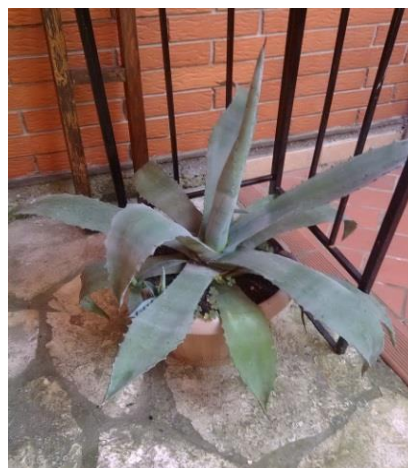
Slika 5.: Lišće Agave americane

Lišće Aloe vere prekriveno je zaštitnom membranom koja ima funkciju pokožice, kroz koju stanice propuštaju zrak i vodu. Razlog uzgoja biljke Aloe vere su sljedeća dva sloja lišća koja imaju različite terapijske značajke. Ispod epiderme nalazi se grupa specijaliziranih stanica koje proizvode žuti lateks s laksativnim učinkom, gorkog okusa zbog prisutnosti aloina, aloj – emodina i srodnih spojeva (Sajjad i Sajjad, 2014.). Nakon toga slijedi parenhimsko tkivo koje tvori unutrašnji dio lišća odnosno gel Aloe vere ; čista, bezukusna, želatonozna masa koja sadrži otprilike 99% vode (Slika 6) (Joseph i Raj, 2010.). Gel lista Aloe vere izvrstan je lijek za porezotine, opekotine i druge kožne bolesti jer stvara zaštitni sloj i smanjuje mogućnost pojave infekcije (Ahmed i sur., 2007.).