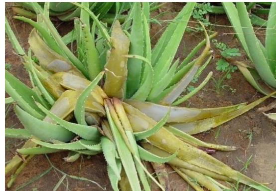
Slika 27.: Bubrenje listova Aloe vere

http://www.slideshare.net/DineshDalvaniya/presentation1-aloevera-disease