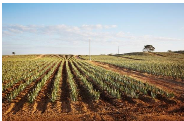
Slika 13.: Plantaže Aloe vere u Meksiku

http://www.discoverforever.com/journey/our-alo/