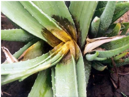
Slika 26.: Početna zaraza donjeg lišća Aloe vere

Bolest se vrlo brzo širi u vlažnim uvjetima kao posljedica dugotrajnih kiša ili navodnjavanja. Simptomi nastaju kada voda natopi bazu lista. Budući da se trulež brzo razvija, biljka Aloe vere nakon 2 – 3 dana vene. Kao rezultat truleži, epiderma lista Aloe vere nabubri zbog stvaranja plina i sadržaj lista Aloe vere se pretvara u sluzavu masu (Slika 27) ( http://www.slideshare.net/DineshDalvaniya/presentation1-aloevera-disease ) .