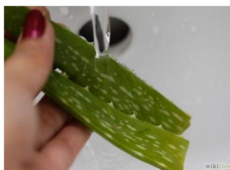
Slika 20.: Pranje lista Aloe vere

Postoje dvije metode skupljanja gela. Jedna od tih metoda jest filetiranje listova, a druga metoda naziva se metoda „cijeli list“ u kojoj se cijeli listovi sjeckaju na manje komadiće. Tako nasjeckani listovi, (Slika 21) pretvaraju se u pulpu koja se filtrira kroz filtere različitih veličina kako bi se dobio Aloe vera gel. Koristeći proces filtriranja veće su mogućnosti da sitni djelići kore prođu kroz filter te se rasprše u konačnom proizvodu pa se ne dobije potpuno čisti Aloe vera gel. Kao rezultat filtriranja dobiva se gusta, zelena masa gorkog okusa s laksativnim učinkom zbog prisutnih slobodnih antrakinona. Ekstrakcija