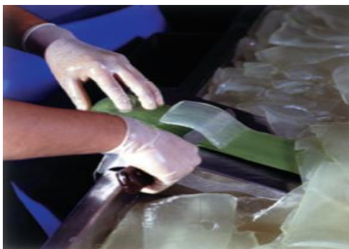
Slika 22.: Filetiranje lišća Aloe vere

Upravo zato, mnoge tvrtke ručno ljušte lišće kako bi izbjegle moguća oštećenja izazvana ugljičnom filtracijom. Ručno ljuštenje lišća naziva se još i filetiranje. Filetiranje je definirano kao izrezivanje najdragocjenijeg mesnatog dijela (Slika 22) Aloe vere iz lista biljke. Ručnim filetiranjem sastavni dio biljke ostaje netaknut i osigurava se očuvanje svih hranjivih tvari koje list Aloe vere posjeduje (Anonymous, 2008.).