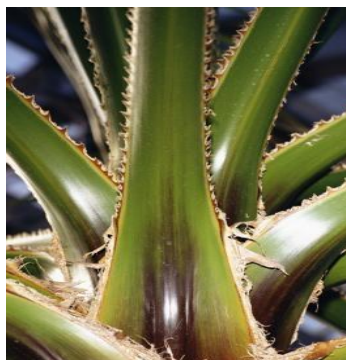
Slika 24.: Gljivična trulež Aloe vere uzrokovana gljivama roda Fusarium

Kod biljke Aloe vere vrste roda Fusarium izazivaju trulež stabljike. Razvoju truleži stabljike Aloe vere doprinose hladni i vlažni uvjeti kroz duže vremensko razdoblje, što se može uočiti stvaranjem tamno crvenih ili crnih područja na stabljici (Slika 24) ( http://www.slideshare.net/DineshDalvaniya/presentation1-aloevera-disease ).