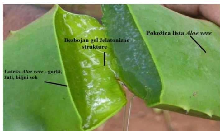
Slika 6.: Dijelovi lista Aloe vere

Lišće Aloe vere prekriveno je zaštitnom membranom koja ima funkciju pokožice, kroz koju stanice propuštaju zrak i vodu. Razlog uzgoja biljke Aloe vere su sljedeća dva sloja lišća koja imaju različite terapijske značajke. Ispod epiderme nalazi se grupa specijaliziranih stanica koje proizvode žuti lateks s laksativnim učinkom, gorkog okusa zbog prisutnosti aloina, aloj – emodina i srodnih spojeva (Sajjad i Sajjad, 2014.). Nakon toga slijedi parenhimsko tkivo koje tvori unutrašnji dio lišća odnosno gel Aloe vere ; čista, bezukusna, želatonozna masa koja sadrži otprilike 99% vode (Slika 6) (Joseph i Raj, 2010.). Gel lista Aloe vere izvrstan je lijek za porezotine, opekotine i druge kožne bolesti jer stvara zaštitni sloj i smanjuje mogućnost pojave infekcije (Ahmed i sur., 2007.).