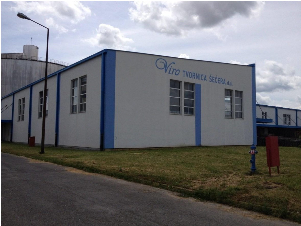
Slika 3. Skladište “Viro tvornice šećera d.d.” u Virovitici