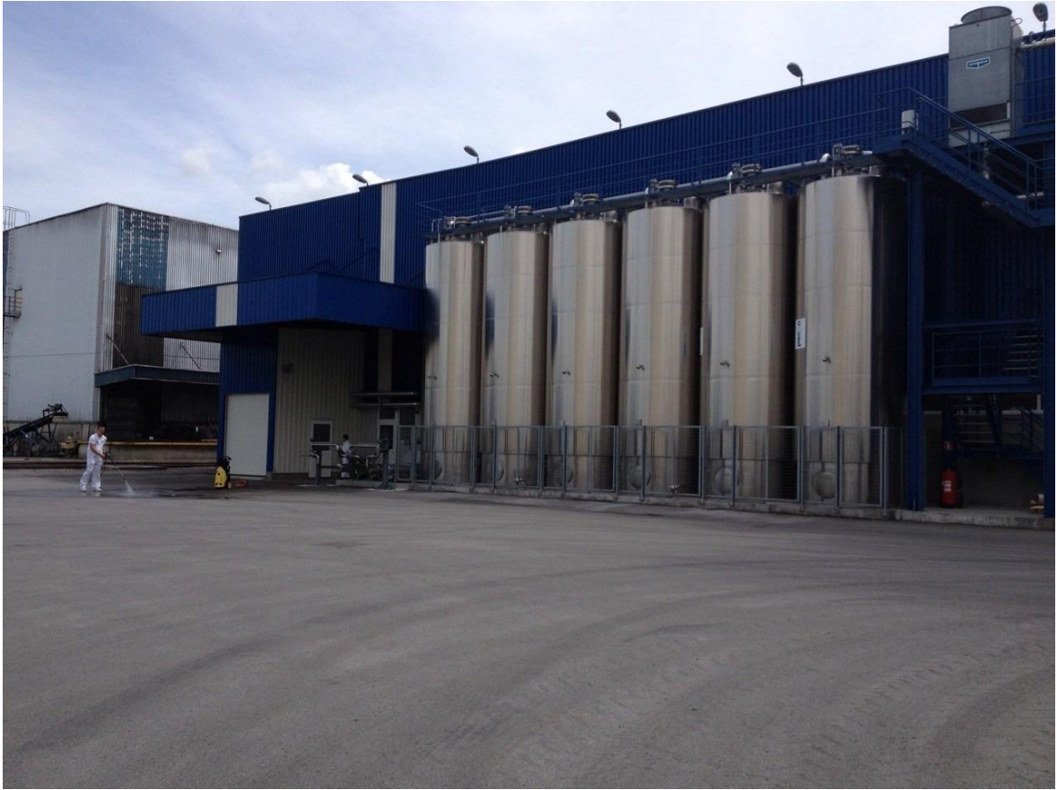
Slika 2. Pogon za utovar tekućeg šećera (šećerne otopine) “Viro tvornice šećera d.d.” u Virovitici