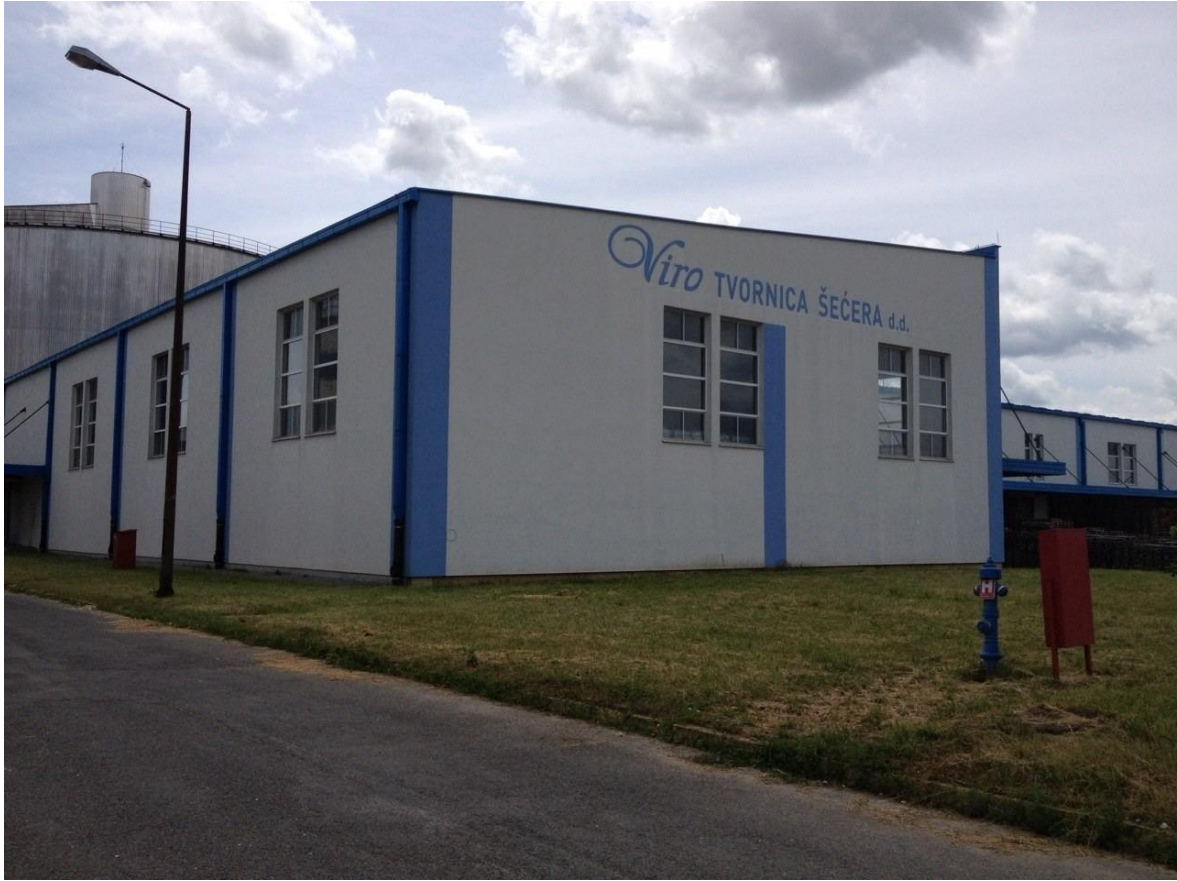
Slika 3. Skladište “Viro tvornice šećera d.d.” u Virovitici