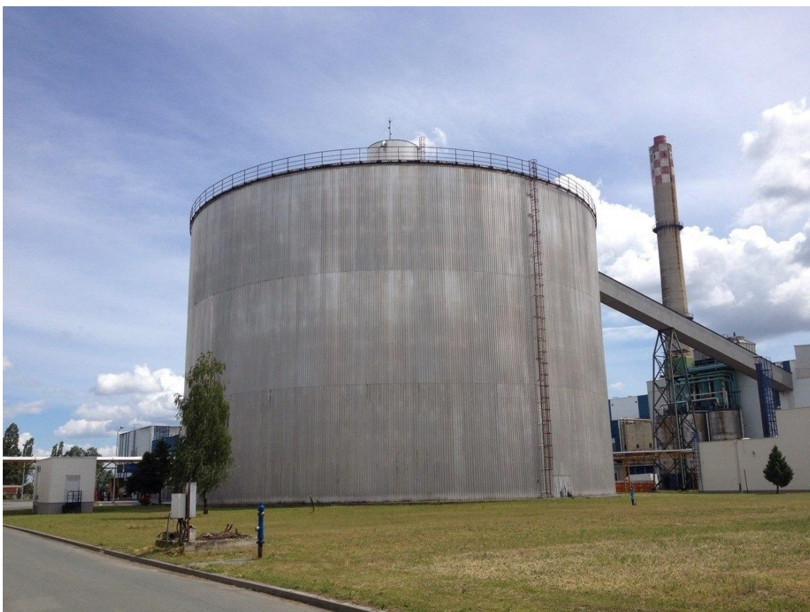
Slika 1. Silos “Viro tvornice šećera d.d.” u Virovitici

Analiza i usporedba vremenskih prilika (srednje temperature zraka i ukupne mjesečne količine oborina – meteorološka postaja: Osijek) s krajnjim ishodom i rezultatima proizvodnje šećerne repe (površine, prinos korijena i sadržaj šećera). Korišteni su podaci dobiveni iz Statističkog ljetopisa kao i analiza ostvarenih proizvodnih rezultata prema internim podacima hrvatskih šećerana: Viro tvornica šećera d.d. (Slika 1., 2. i 3.), Sladorana i Kandit Premijer te podaci vremenskih prilika dobiveni iz Državnog hidrometeorološkog zavoda.