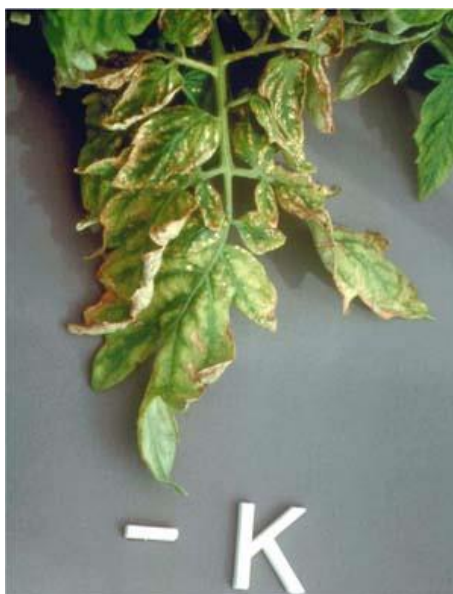
Slika 7. Izraženi nedostatak kalija na rajčici [3]