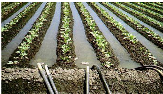
Slika 1. Navodnjavanje brazdama