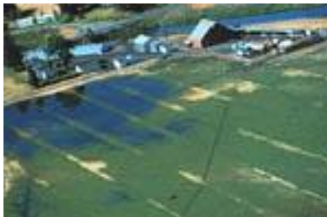
Slika 2. Navodnjavanje prelijevanjem

Izvor: pfos.hr/~dsego/.../5.%20VRSTE%20NAVODNJAVANJA%201.ppt