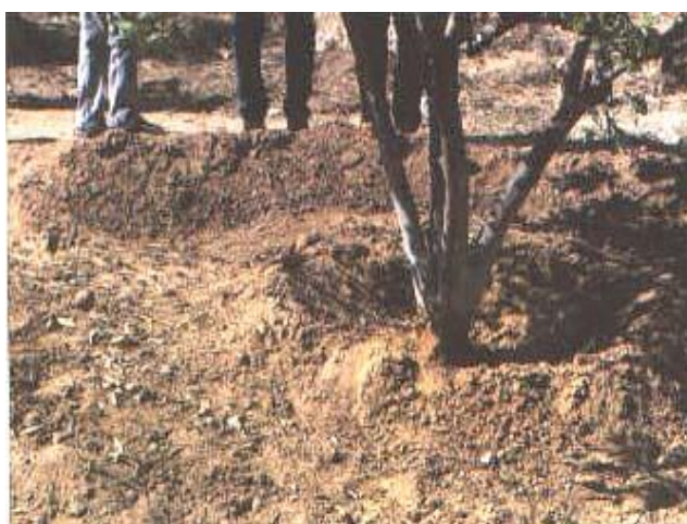
Slika 4. Navodnjavanje potapanjem sustavom lokvi