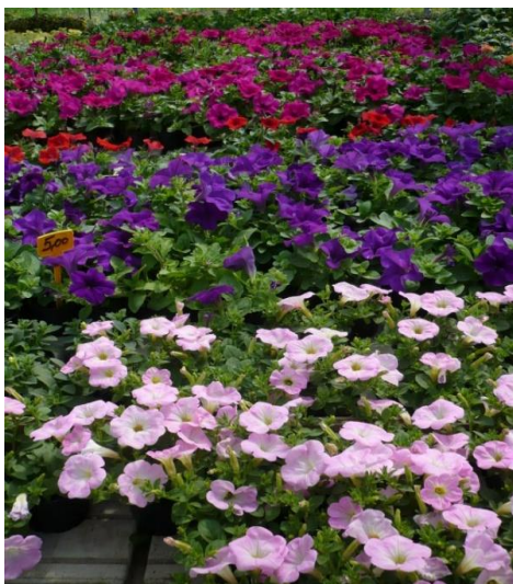
Slika 10. Surfinije i potunije