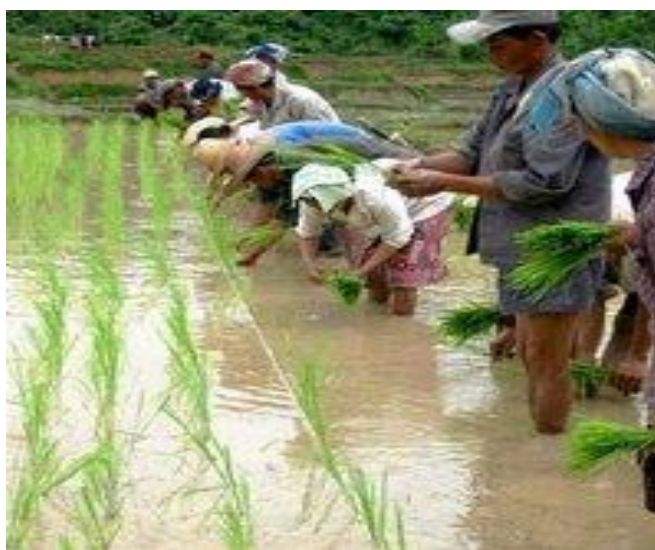
Slika 3. Navodnjavanje potapanjem sustavom kasete