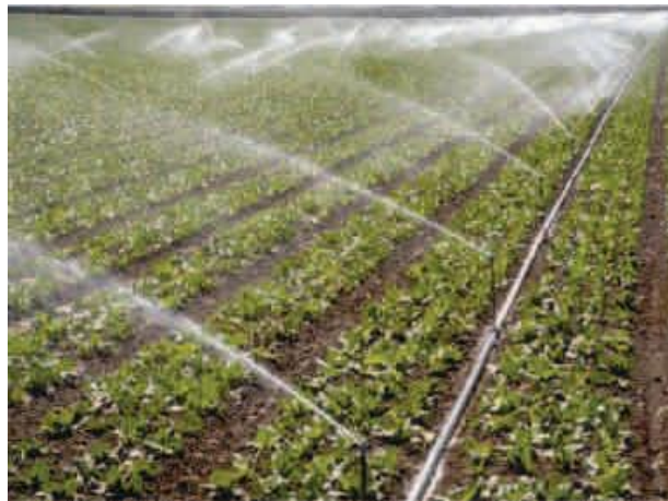
Slika 7. Navodnjavanje kišenjem