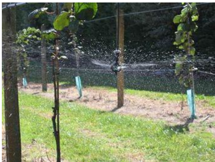
Slika 9. Navodnjavanje mini rasprskivačima