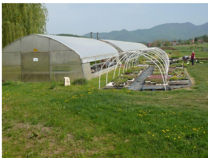
Slika 12. Plastenici na OPG Zea