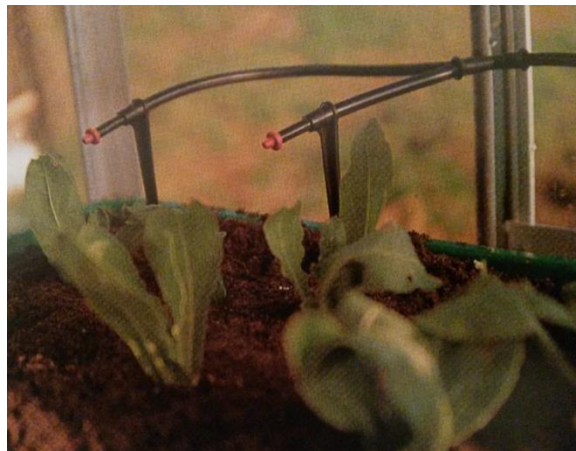
Slika 13. Navodnjavanje kapanjem