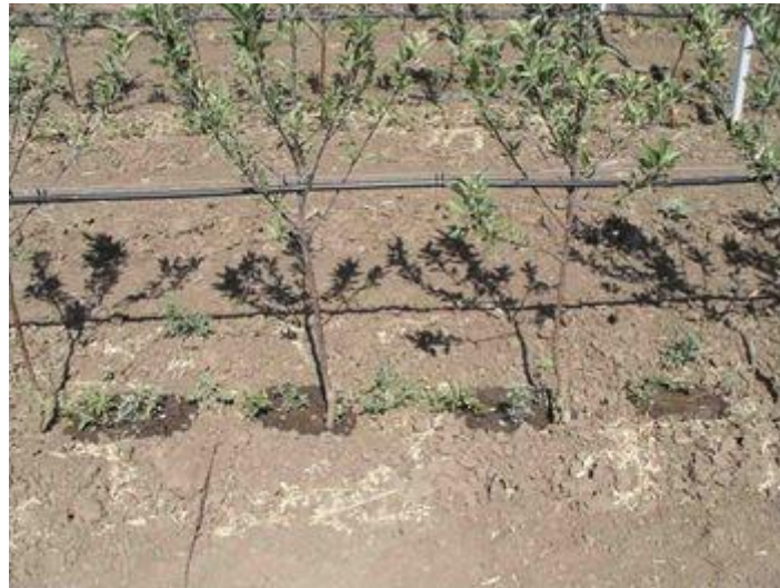
Slika 8. Navodnjavanje kapanjem