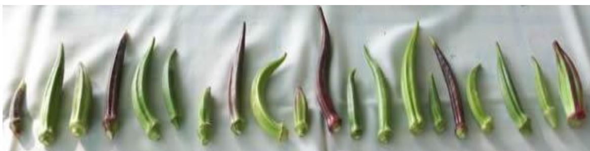
Slika 11.: Plodovi različitih sorti bamije