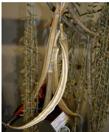
Slika 4.: Sušena bamija