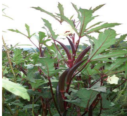
Slika 10.: Crvena indijska bamija

U zemljama Balkana, točnije u Bosni i Hercegovini i Makedoniji najčešće se uzgajaju domaći ekotipovi podrijetlom iz Bugarske i Turske.