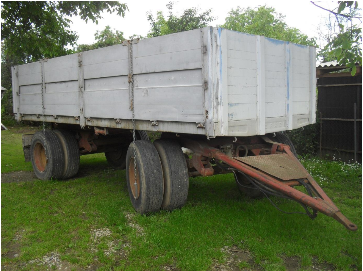
Slika 15. Prikolica „Cardi“, nosivost 10 t

Prikolice, slika 15. i slika 16., služe za transport pšenice i kukuruza i prijevoz duhana zapakiranog u kutije (za otkup). Održavanje prikolica se obavlja prije početka rada, a odnosi se na provjeru ispravnosti kočionog sustava, provjeru tlaka u pneumaticima, podmazivanje mjesta predviđenih za to, pregled vijčanih spojeva, te provjeru ispravnosti svjetlosne signalizacije prikolice.