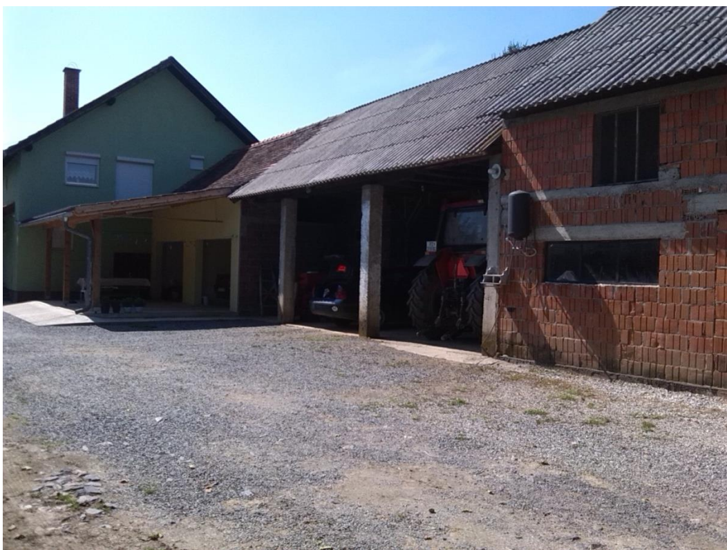
Slika 2. Poluotvoreni objekti