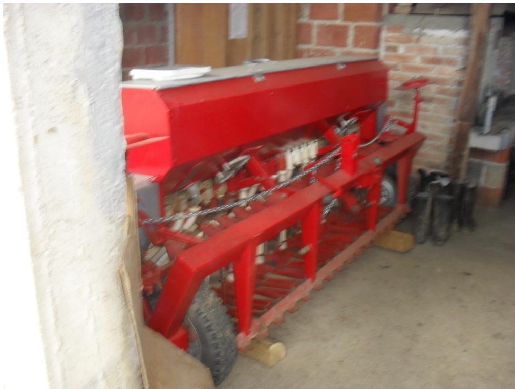
Slika 11. Sijačica „Olt“

Mehanička sijačica, slika 11., na gospodarstvu služi za sjetvu strnih žitarica. Održavanje sijačice se provodi pregledom ispravnosti sprovodnih cijevi, provjerom pogonskog dijela, tlaka u pneumaticima, te podmazivanjem za to predviđenih mjesta.