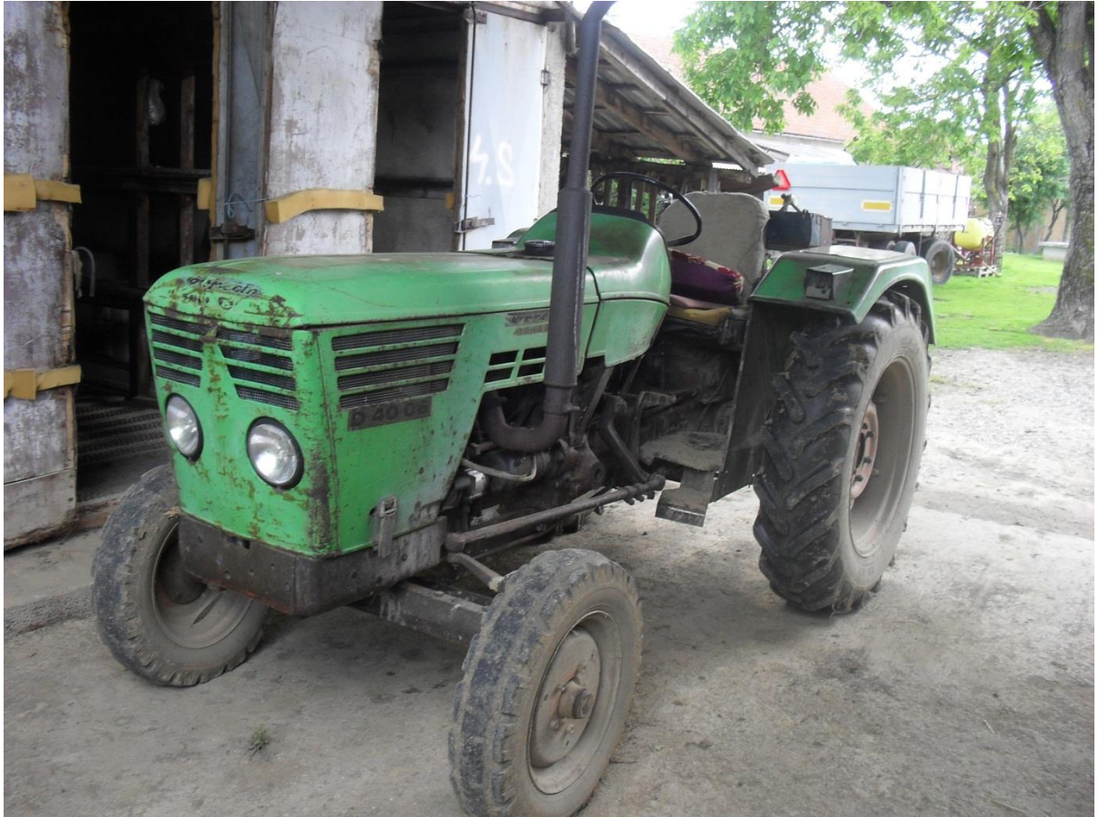
Slika 5. Traktor „Deutz 4006“