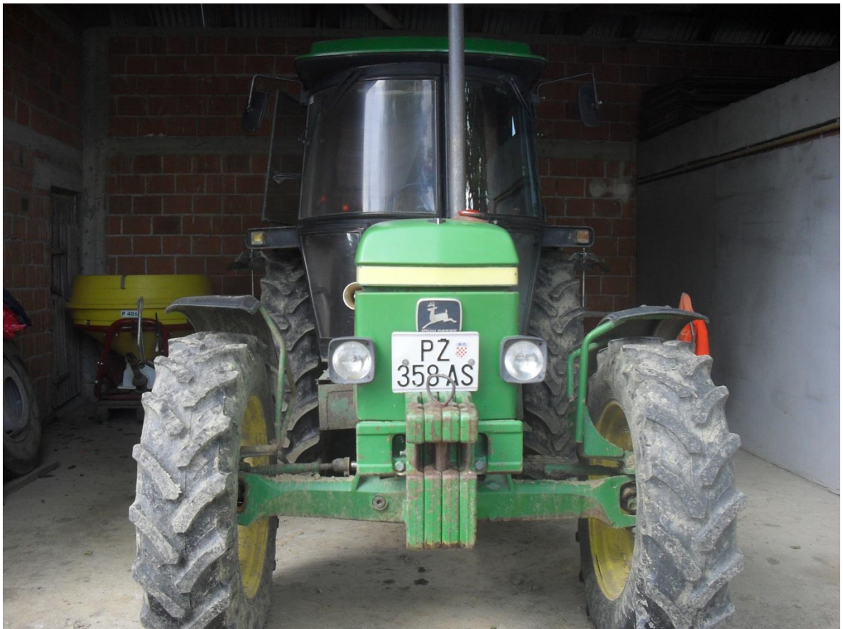
Slika 3. Traktor „John Deere“

Traktor „John Deere“, slika 3., ima četverocilindrični dizelski motor snage 61 kW/ 82 KS. Na obiteljskom gospodarstvu služi za prijevoz tereta, tanjuranje te izvođenje oranja. Maksimalna brzina kretanja traktora je 35 km/h, broj okretaja priključnog vratila je standardan (540/1000 min). Traktor je kupljen kao polovan stroj 2004. godine.