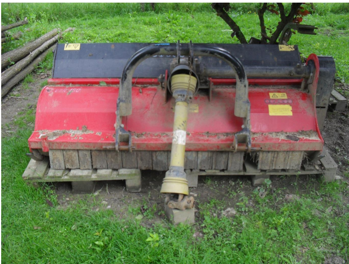
Slika 18. Malčer „Gramip“

Malčer, slika 18., na gospodarstvu koristi za usitnjavanje ostataka stabljika duhana u polju, kako bi se oranje moglo izvesti što lakše i kvalitetnije. U održavanje malčera na gospodarstvu ubrajaju se provjere remenja prije početka rada, provjera kardanskog vratila, vizualna provjera naoštrenosti noževa, te podmazivanje dijelova predviđenih za to.