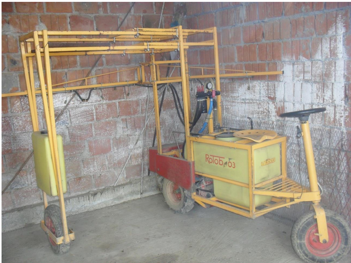
Slika 6. Prskalice „Rotob“

Navedena prskalice, slika 6., jest mali samohodni stroj koji se može koristiti za kemijsko tretiranje nasada duhana kao i za tretiranje u rasadniku. Na obiteljskom poljoprivrednom gospodarstvu „Havrda“ koristi se isključivo za tretiranje nasada duhana i rasadnika. Prskalice za pogon koristi jednocilindrični dizel motor snage 4 kW/ 6KS. Kapacitet crpke je 60 l/min te maksimalan tlak od 60 bara. Radna širina prskalice iznosi najmanje 3,20 m, tj. 80 cm minimalnog međurednog razmaka s mogućnošću prilagodbe. Spremnik škropiva je zapremine 150 l, a maksimalna visina tretiranih biljaka jest 170 cm. Održavanje prskalice se obavlja svakodnevno prije početka s radom.