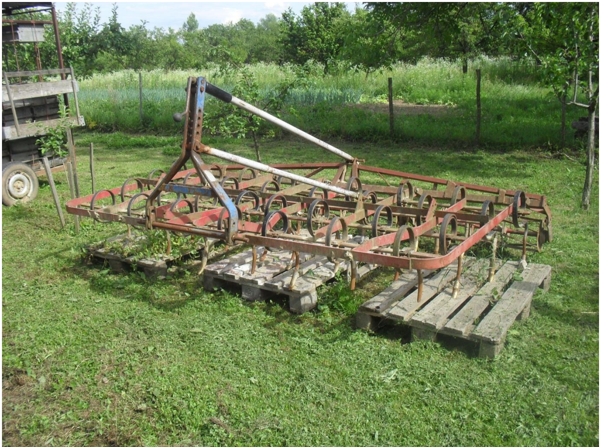
Slika 9. Sjetvospremač

Sjetvospremač ,slika 9., služi za predsjetvenu pripremu tla, provociranje korova, a ujedno i za zatvaranje brazde. Održavanje sjetvospremača na gospodarstvu provodi se provjerom ležajeva, pregledom vijčanih spojeva, te čišćenjem naljepljene zemlje i biljnih ostataka po završetku rada.