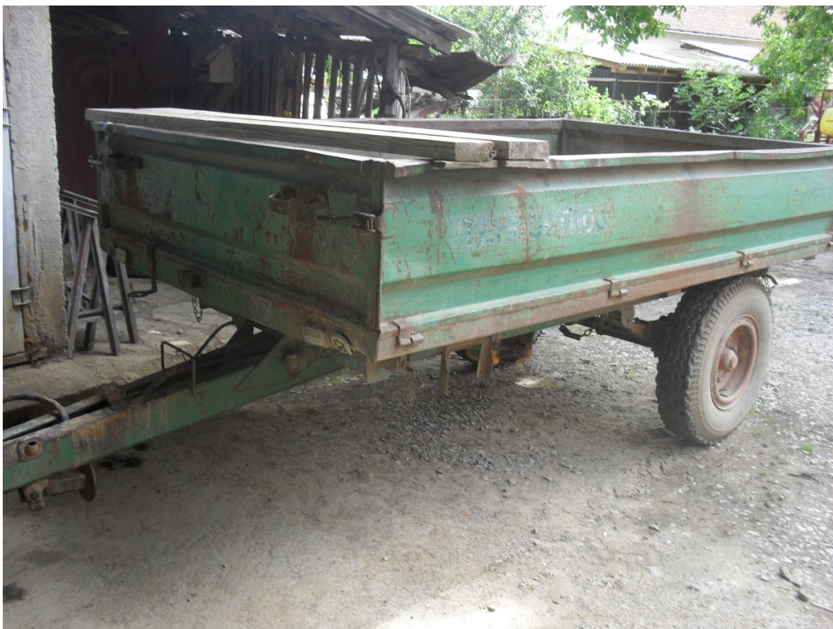
Slika 16. Prikolica „Tehnostroj“, nosivost 3 t

Potrebno je voditi računa o podmazivanju ležajeva kotača, te provjeravati ispravnost gibnjeva. Ako je jedan list gibnja pukao, zamjenjuje se cijeli gibanj, a neispravni upućuje na popravak. Kod prikolica s pneumatskom kočnom instalacijom, provjeriti ispravnost cijevi i spojeva, te stanje obloga kočnica koje u slučaju istrošenosti treba zamjeniti. Kod prikolica s hidrauličnom instalacijom (kiper-prikolice) voditi računa o nepropusnosti svih dijelova. Ako se pojavi curenje ulja treba pritegnuti spoj ili zamjeniti oštećene dijelove. Električna instalacija mora biti ispravna, kako bi prikolica imala normalnu signalizaciju u prometu. Potrebno je voditi računa o dozvoljenom opterećenju prikolice, Emert i dr. (1995).