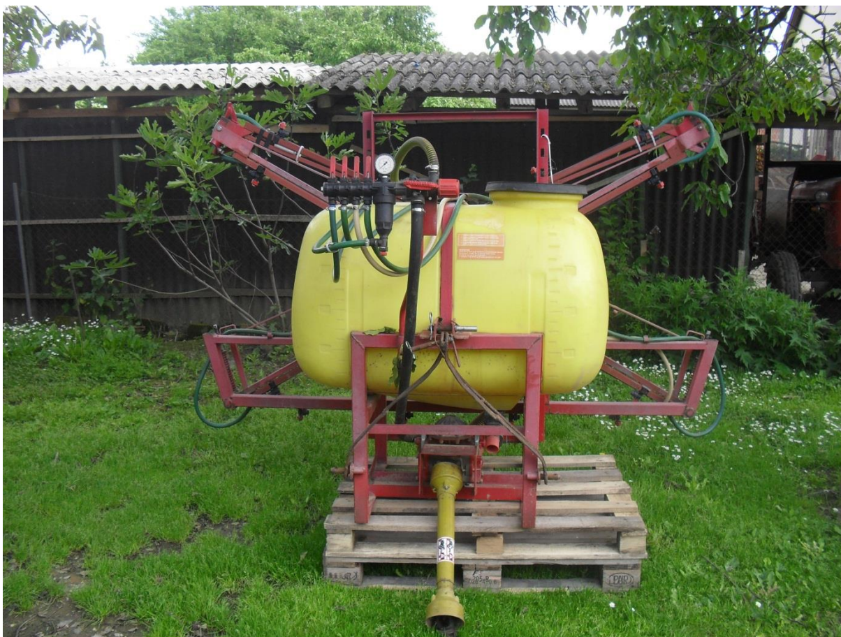
Slika 14. Prskalica „Leško“

Prije početka rada s prskalicom preporučuje se spremnik napuniti vodom i pustiti prskalicu u pogon. Treba provjeriti ispravnost spremnika za tekućinu i plastičnih cijevi, te ukloniti vidljive nedostatke i pritegnuti spojeve. Vizualnom provjerom treba provjeriti prskalicu i krila prskalice. Na poklopcu spremnika potrebno je očistiti otvor za zrak da ne bi dolazilo do stvaranja podtlaka u spremniku. Za vrijeme probnog puštanja u rad treba provjeriti da li voda izlazi na sve mlaznice, da li je podjednaka količina vode namlaznicama, kao i raspršenost mlaza. Bitno je provjeravati ispravnost membrane crpke, potrebno je povremeno membranu provjeriti i zamjeniti nakon 400 sati rada novom. Izmjena ulja u kućiću crpke vrši se svakih 100 sati rada. Također je potrebno posvetiti veliku pažnju uređaju za automatsko reguliranje. U slučaju neispravnosti uređaja pozvati servis, Emert i dr. (1995).