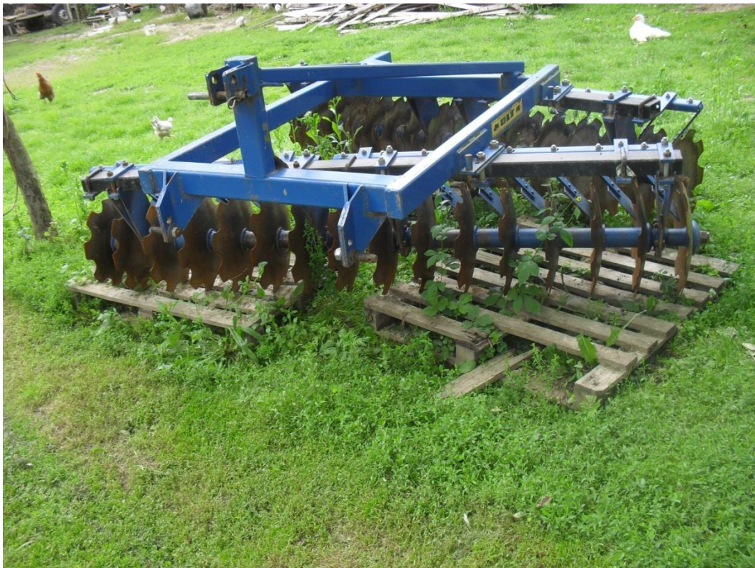
Slika 8. Tanjurača „Olt“

Tanjurača ,slika 8., se na gospodarstvu koristi za zatvaranje brazde, tj. za dopunsku obradu tla. Nadalje, tanjurača se koristi i za prašenje strništa. Održavanje tanjurače se svodi na vizualni pregled vijčanih spojeva, po potrebi njihovom dotezanju, provjeri ležajeva te njihovog podmazivanja, a po završetku rada i čišćenju naljepljene zemlje i biljnih ostataka na radne dijelove tanjurače.