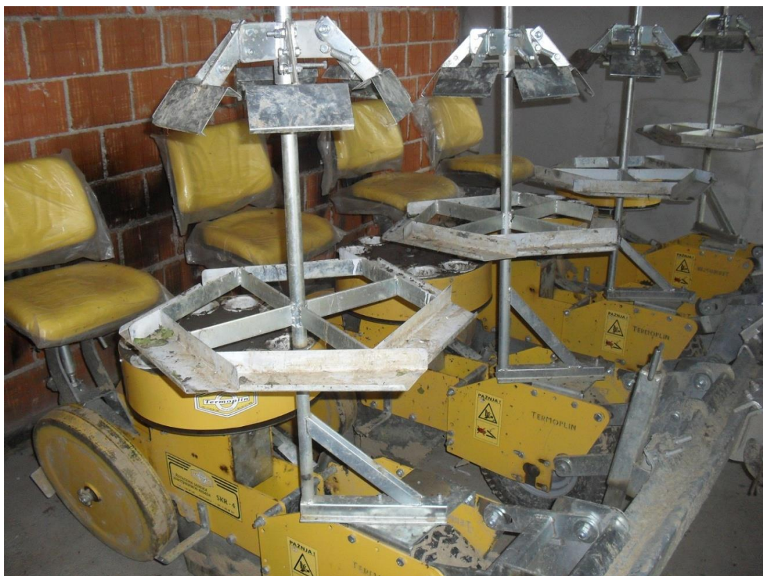
Slika 17. Sadilica „Termoplín“

Sadilica, slika 17., na gospodarstvu služi isključivo za sadnju duhana i koristi se 2-3 dana u godini. Održavanje sadilice se provodi svakodnevno prije početka rada, a podrazumijeva: provjeru raonika, nagaznih kotača, mehanizma za sadnju, provjeru tlaka u pneumaticima i provjeru lanaca i lančanika.