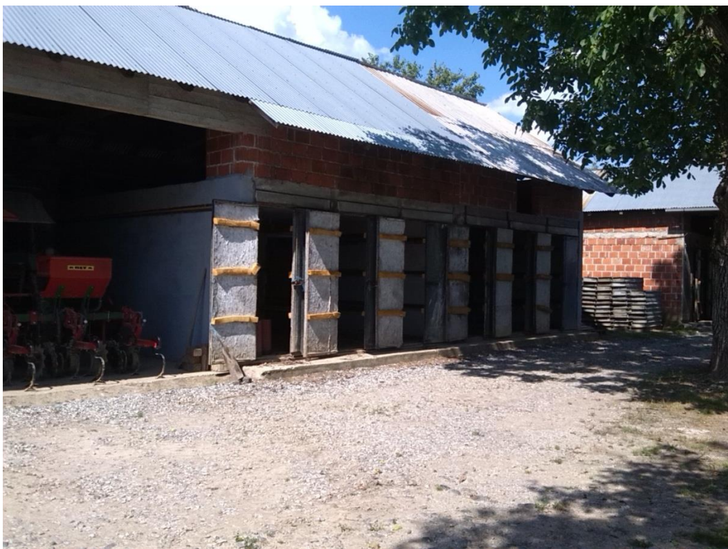
Slika 1. Sušare duhana