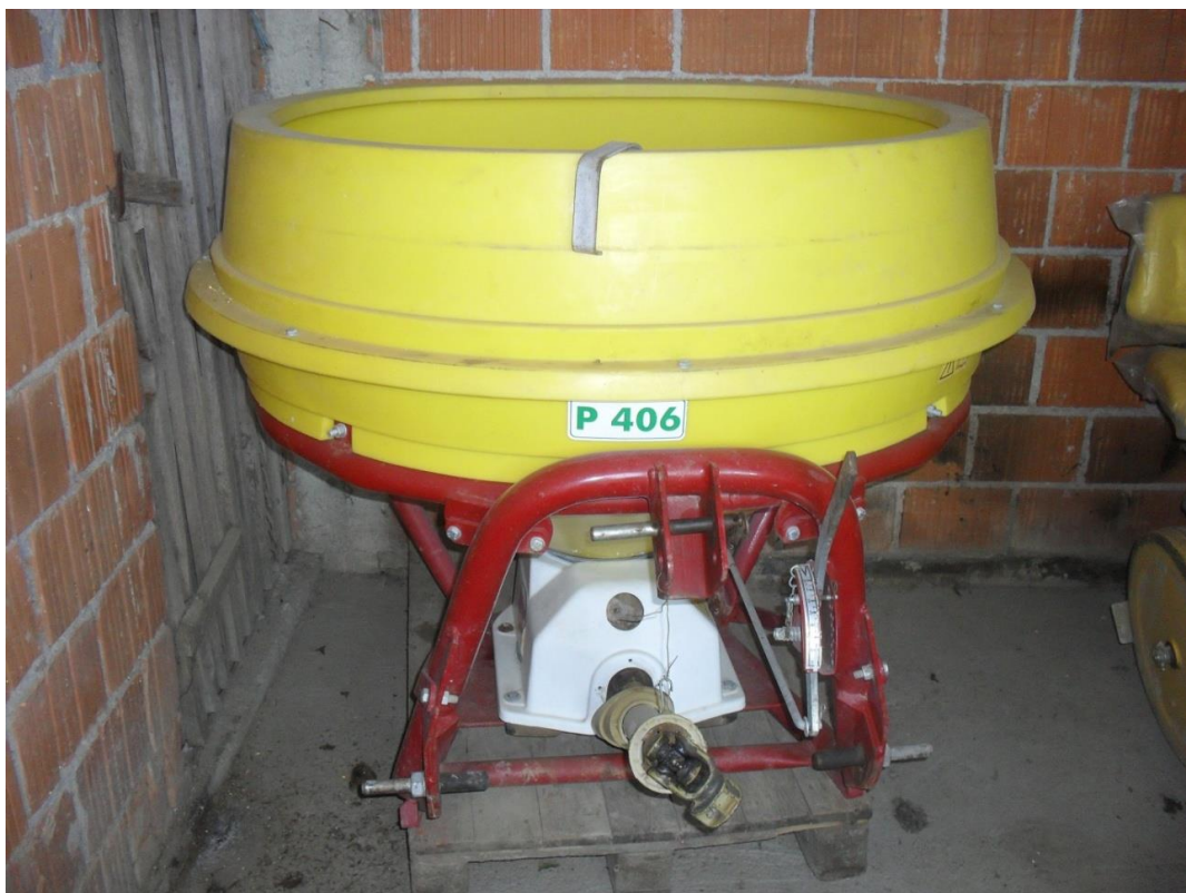
Slika 13. Rasipač „Gramip“

Rasipač mineralnog gnojiva, slika 13., koristi se za aplikaciju mineralnog gnojiva. Stroj je koji se koristi 3-4 mjeseca godišnje. Održavanje se svodi na provjeru klataće cijevi, provjeru zategnutosti vijčanih spojeva te kardanskog vratila. Na kraju radnog dana rasipač se pere i čisti suhom krpom od ostataka mineralnog gnojiva.