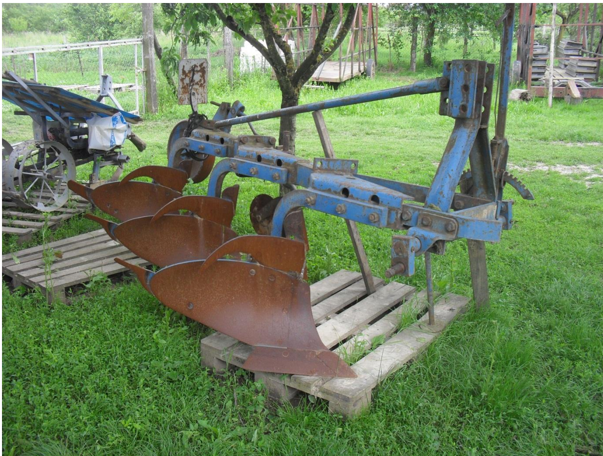
Slika 7. Plug „Rabe Werk“

Plug, slika 7., se održava sukladno naputku za rukovanje i održavanje. Nakon rada čisti se od ostataka biljaka i zaljepljene zemlje, oštrica lemeša se kontrolira kako prije početka rada tako i nakon završetka.