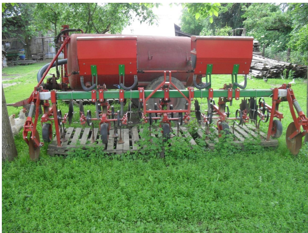
Slika 12. Kultivator „Olt“

Kultivator, slika 12., na gospodarstvu se koristi za zagrtanje duhana pomoću raonika, međurednu obradu kako duhana tako i kukuruza. Kod kukuruza se tijekom kultivacije obavlja i prihrana mineralnim gnojivom. Odžavanje kultivatora provodi se provjerom spremnika za gnojivo, vizualnom provjerom motičica kultivatora te naoštrenosti istih.