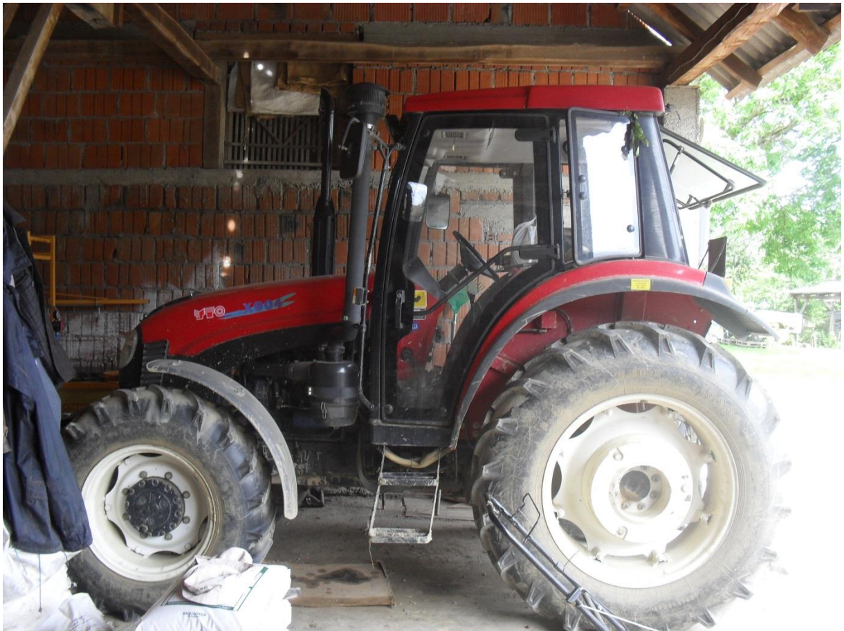
Slika 4. Traktor „YTO x904“

Traktor „ Deutz 4006“ ,slika 5, najmanji je , najekonomičniji i najlakši za manevriranje, motor mu je snage 30 kW/ 40 KS i ima zrakom hlađeni motor. Koristi se za lakše poslove kao i poslove koje nije moguće obaviti sa druga dva traktora. Služi za drljanje, kultiviranje, aplikaciju gnojiva i pesticida. Kupljen je kao nov traktor 1980.godine.