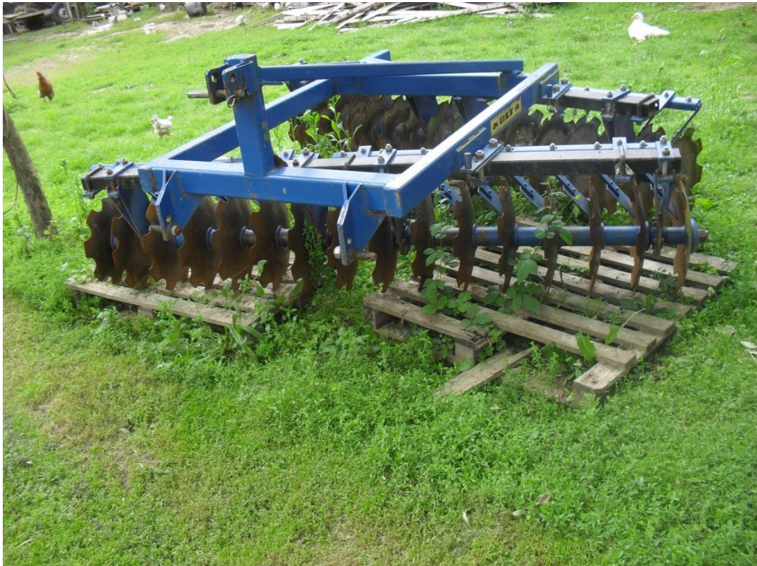
Slika 8. Tanjurača „Olt“

Tanjurača ,slika 8., se na gospodarstvu koristi za zatvaranje brazde, tj. za dopunsku obradu tla. Nadalje, tanjurača se koristi i za prašenje strništa. Održavanje tanjurače se svodi na vizualni pregled vijčanih spojeva, po potrebi njihovom dotezanju, provjeri ležajeva te njihovog podmazivanja, a po završetku rada i čišćenju naljepljene zemlje i biljnih ostataka na radne dijelove tanjurače.