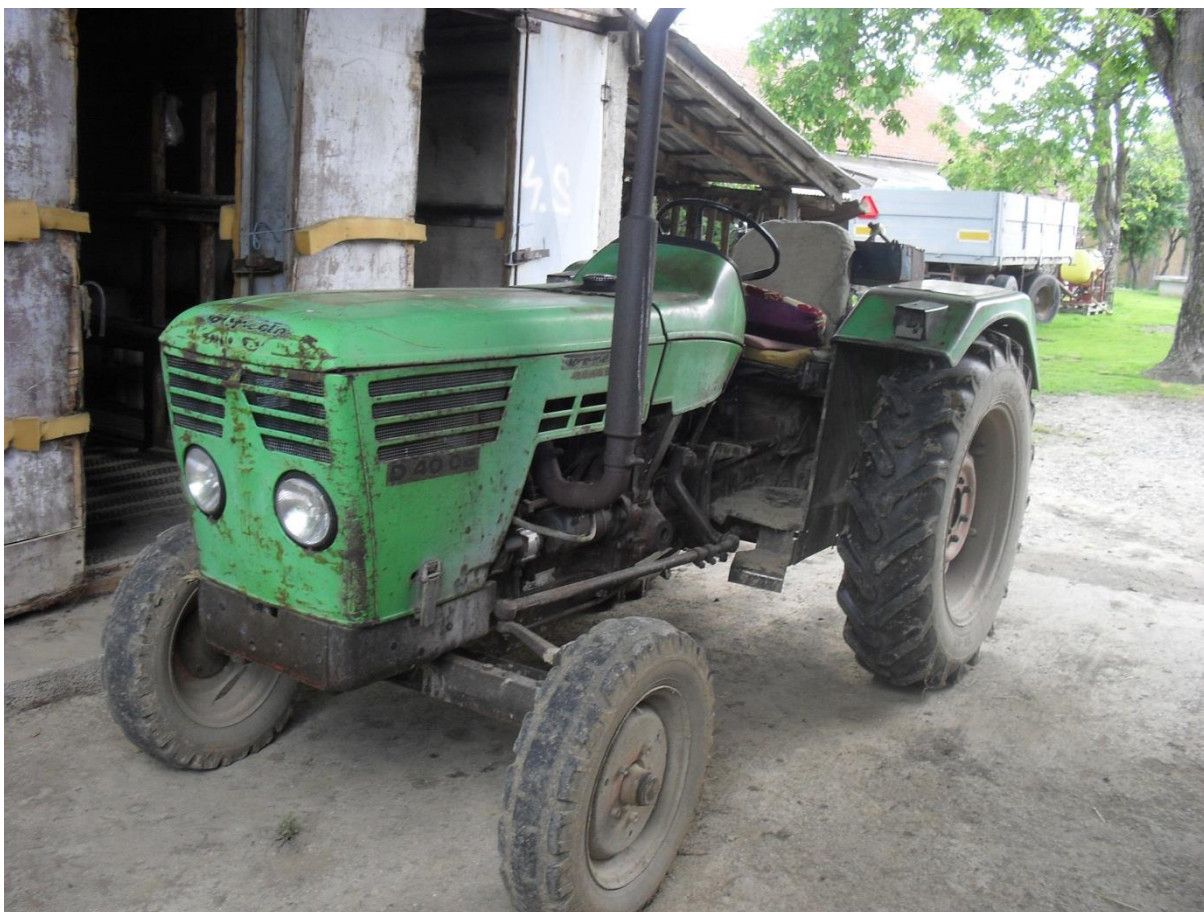
Slika 5. Traktor „Deutz 4006“