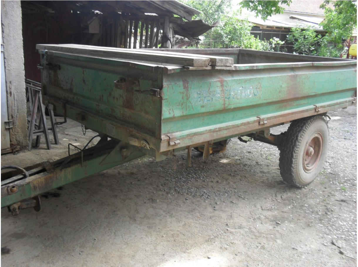
Slika 16. Prikolica „Tehnostroj“, nosivost 3 t

Potrebno je voditi računa o podmazivanju ležajeva kotača, te provjeravati ispravnost gibnjeva. Ako je jedan list gibnja pukao, zamjenjuje se cijeli gibanj, a neispravni upućuje na popravak. Kod prikolica s pneumatskom kočnom instalacijom, provjeriti ispravnost cijevi i spojeva, te stanje obloga kočnica koje u slučaju istrošenosti treba zamjeniti. Kod prikolica s hidrauličnom instalacijom (kipar-prikolice) voditi računa o nepropusnosti svih dijelova. Ako se pojavi curenje ulja treba pritegnuti spoj ili zamjeniti oštećene dijelove. Električna instalacija mora biti ispravna, kako bi prikolica imala normalnu signalizaciju u prometu. Potrebno je voditi računa o dozvoljenom opterećenju prikolice, Emert i dr. (1995).