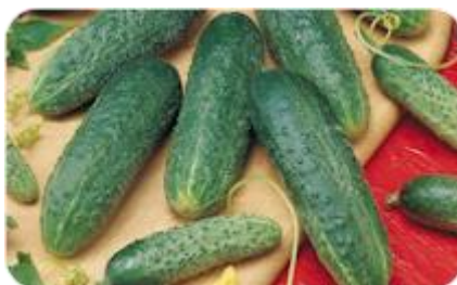
Slika 8. Hibrid krastavca Asterix F1

Asterix F1 - pretežno ženski bradavičasti hibrid. Visoko je tolerantan na plamenjaču, pepelnicu i mozaik virusa krastavca. Otporan na Cladosporium . Plodovi su tamnozeleno boje i bez gorčine. Od sadnje do prve berbe potrebno mu je oko 85 dana.