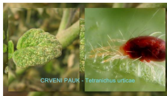
Slika 21. Crveni pauk Tetranychus urticae

Crvenom pauku ne odgovara vlažna okolina, pa je jedna od mjera suzbijanja i češće zalijevanje ili orošavanje nasada. Od velike važnosti je da se u zaštićenom prostoru i oko njega, pred sadnju i tijekom vegetacije uklanjaju korovi i biljni ostaci te njihovo redovito iznošenje iz zaštićenog prostora, čišćenje staza, podizanje zračne vlage, sadnja nezaraženih sadnica i redovita kontrola sadnica. Kod kemijskih mjera su sredstva dosta ograničena a najčešće se koristi VERTIMEC 018 EC u količini od 0,3 – 1,2 l/ha.