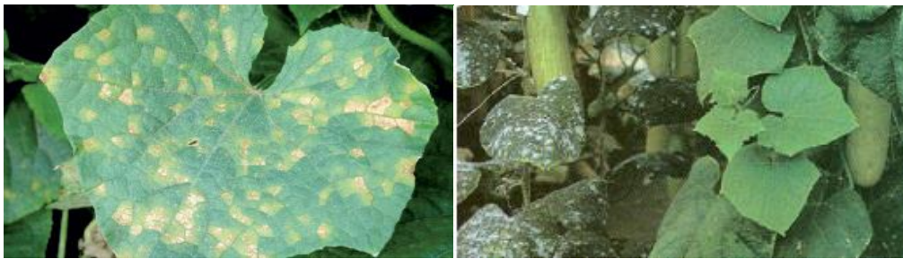
Slika 18 i 19. Simptomi plamenjače i pepelnice na listovima krastavca

Zaštita započinje kada kad krastavac razvije 3-4 prava lista. Plamenjača se može suzbiti fungicidima s površinskim djelovanjem, npr. DITHANE M-45 u koncentraciji 0.15%, RADOZINEB WP u koncentraciji od 0,25%, QUADRIS SC , koji je lokalno-sistemični fungicid, u koncentraciji od 0,075% - 0,1%. Vrlo djelotvorni u zaštiti i suzbijanju plamenjače je kontaktni preventivni fungicid CUPRABLAU SC (Cu 35% + Zn 20 2%) koji se koristi u koncentraciji od 0,3-0,4% ili u količini 3-4 kg/ha (30-40g u 10l vode na 100 m 2 ).