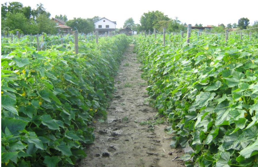
Slika 2. Uzgoj krastavca na armaturi (izv .foto)

Kod nas se krastavac uzgaja na površini od oko 5.400 ha. U Hrvatskoj se godišnje proizvede oko 35 000 tona s prosječnim prinosom od 6,5 t/ha. Za potrebe prerade kod nas se godišnje organizira proizvodnja na oko 400 ha, a s te površine se proizvede oko 7 000 tona krastavaca.