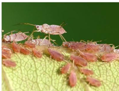
Slika 22. Lisne uši Aphididae sp.