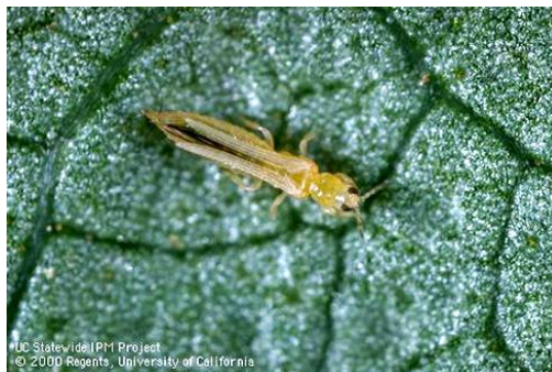
Slika 20. Kalifornijski trips Frankliniella occidentalis

Zaštita se provodi primjenom insekticida MOSPILAN 20 SP u koncentraciji od 0,0125%, CALYPSO SC 480 u koncentraciji od 0,02 %, te LASER u koncentraciji od 0,04 – 0,05 %.