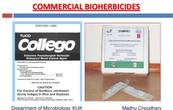
Slika 20. Collego® na osnovi Colletotrichum gloeosporoides f.sp. aeshynomene

Bioherbicid Dr.Bio Sedge® na osnovi je hrđe Puccinia canaliculata i registriran je za suzbijanje vrste Cyperus esulentus (jestivi šilj). Izolat bakterije Xanthomonas campestris pv. Poae izoliran je u Japanu iz vrste Poa annua (jednogodišnja vlasnjača). Bioherbicid Stumpout® na osnovi je basidiomicete Cylindrobasidium laeve i koristi se u suzbijanju izdanaka u rasadnicima drveća i na prirodnim staništima.