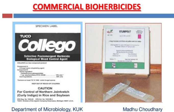
Slika 20. Collego® na osnovi Colletotrichum gloeosporoides f.sp. aeschynomene

Bioherbicid Dr.Bio Sedge® na osnovi je hrđe Puccinia canaliculata i registriran je za suzbijanje vrste Cyperus esulentus (jestivi šilj). Izolat bakterije Xanthomonas campestris pv. Poae izoliran je u Japanu iz vrste Poa annua (jednogodišnja vlasnjača). Bioherbicid Stumpout® na osnovi je basidiomicete Cylindrobasidium laeve i koristi se u suzbijanju izdanaka u rasadnicima drveća i na prirodnim staništima.