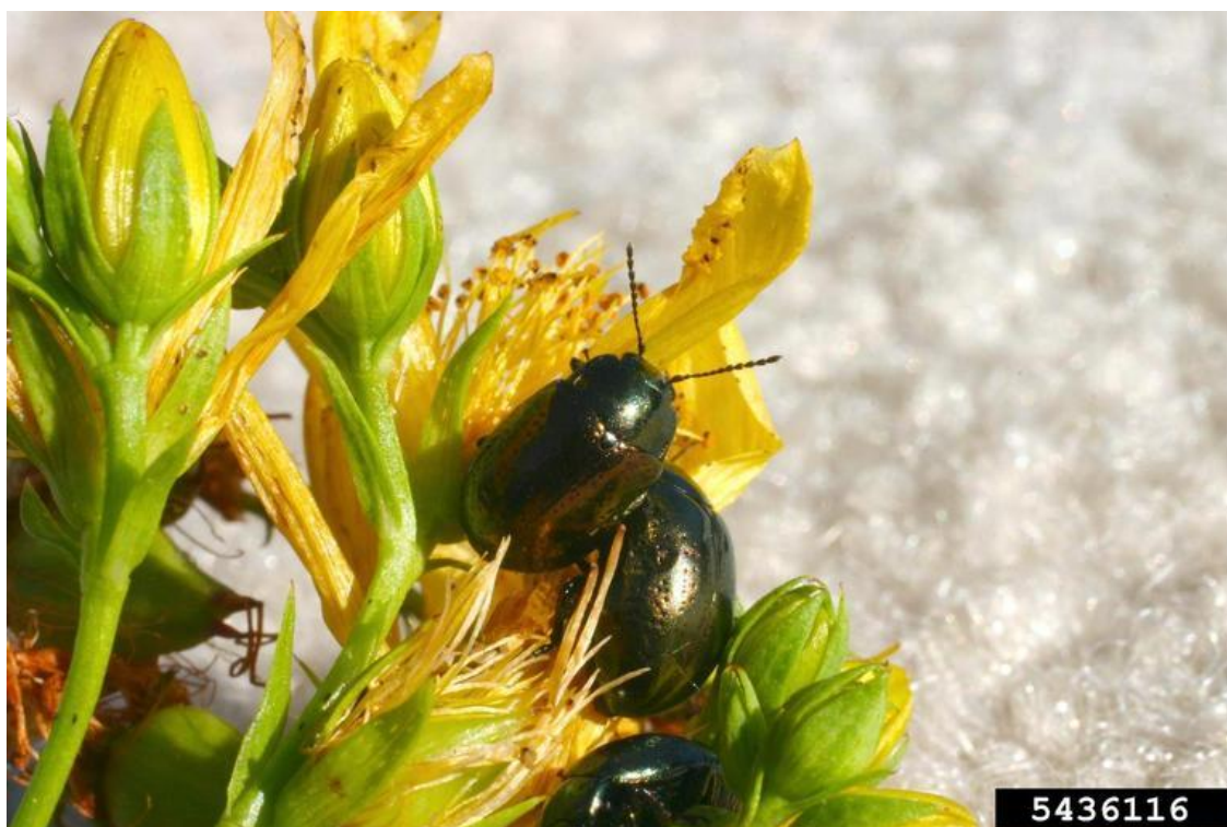
Slika 8. Chrysolina quadrigemina na gospinoj travi

Chrysolina hyperici je puštena u prirodu u proljeće 1945. A Chrysolina quadrigemina u veljači 1946. Obje vrste su se vrlo brzo prilagodile, međutim ubrzo je postalo jasno kako je C. quadrigemina dominantna i vrlo uspješna u suzbijanju gospine trave (Slika 8.).