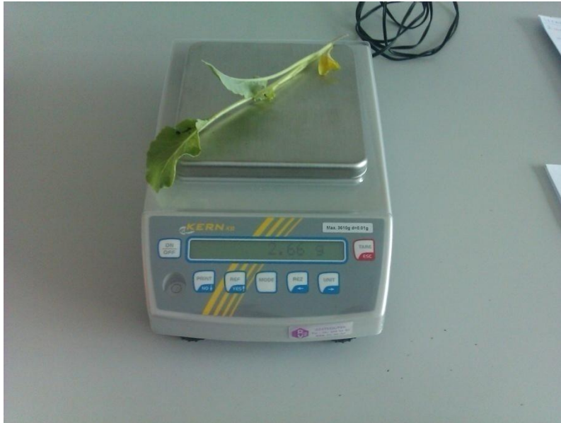
Slika 6. Vaganje nadzemnog dijela presadnice Originalna fotografija

Ovim istraživanjem ispitivali su se slijedeći parametri: utjecaj volumena supstrata te hibrida na visinu i masu nadzemnog dijela presadnice, dužinu i masu korijena presadnice cvjetače te broj listova presadnice cvjetače. Mjerenje visine i mase presadnica prikazano je na slici 6 i 7.