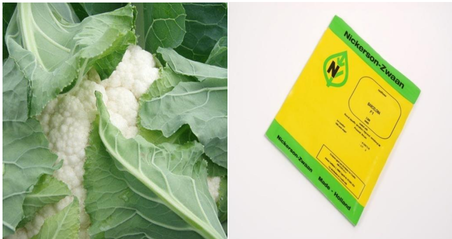
Slika 3. Hibrid Barcelona F1 ( http://www.am-agro.hr/gallery/cvjetaca/ )

Pokus je bio postavljen u četiri ponavljanja, gdje su se koristila dva hibrida cvjetače i kontejneri različitog volumena supstrata. Za sjetvu cvjetače koristili su se hibridi Barcelona F1 i Skywalker F1. Barcelona F1 (Slika 3) je hibrid za kasnu ljetnu ili jesensku proizvodnju, odlikuje se dobro zaštićenom, kompaktnom, bijelom cvati izuzetne kvalitete, nije osjetljiv na pojavu ljubičaste nijanse cvata, a vegetacijatraje 70-75 dana (slika 1). Kasni hibrid Skywalker F1 (Slika 4) karakterizira dobro samopokrivanje, zbijen, težak cvat, za jesensku proizvodnju, sadi se u lipnju i srpnju, a razdoblje vegetacije je oko 96 dana.