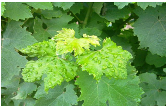
Slika 22. Filoksera

Suzbijanje se ne provodi na cjepljenoj europskoj lozi. U matičnjacima američke loze napad uši šiškarica suzbija se prskanjem tijekom mirovanja vegetacije sredstvima za zimsko prskanje koja ubijaju jaja.