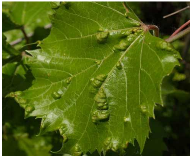
Slika 26. Lozina grinja šiškarića-erinoza