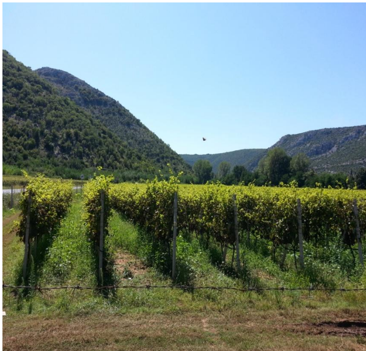
Slika 39. Vinograd Žitomislíci