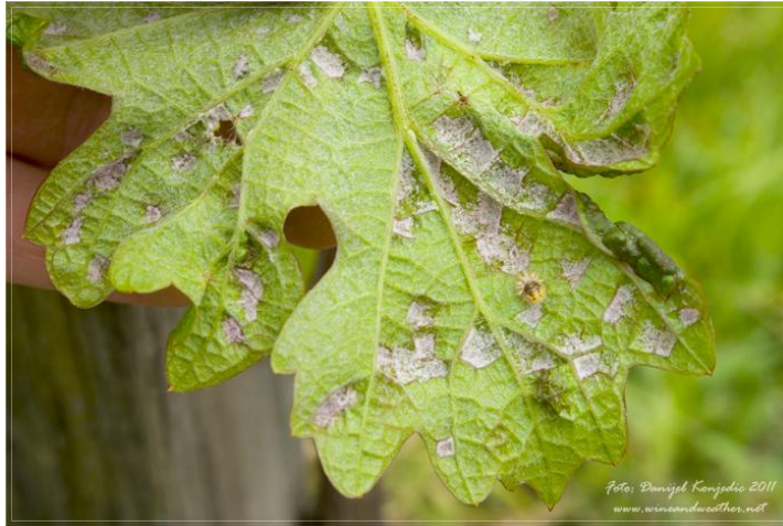
Slika 25. Lozina grinja kovrčavica-akarinoza