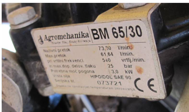
Slika 3. Pločica proizvođača na klipno-membranskoj crpki