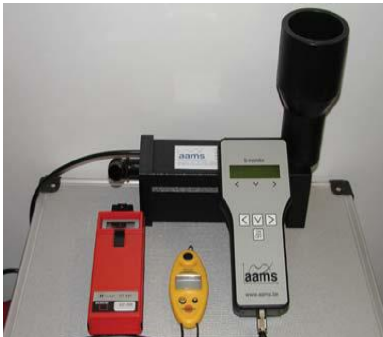
Slika 8. Uređaj AAMS za mjerenje protoka mlaznica

Ispitni stol ima elektronsku jedinicu za mjerenje protoka (Slika 8.) koja mjeri trenutni protok mlaznice, te rezultat sprema u vlastitu memoriju. Rezultati se naknadno obrađuju u posebnom softveru – spray monitor .