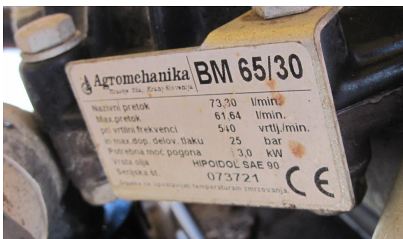
Slika 3. Pločica proizvođača na klipno-membranskoj crpki