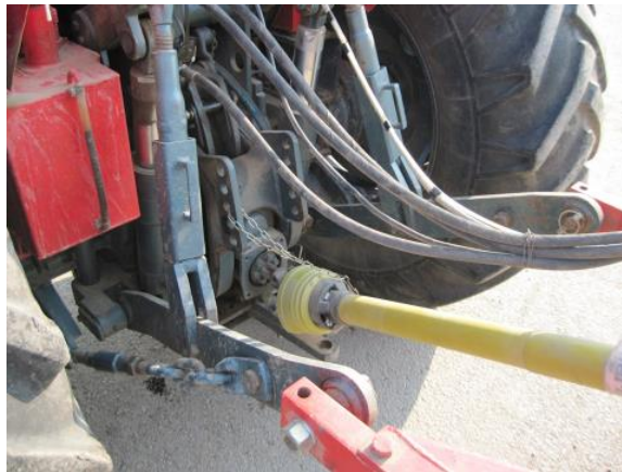
Slika 1. Pravilno postavljena zaštita priključnog vratila