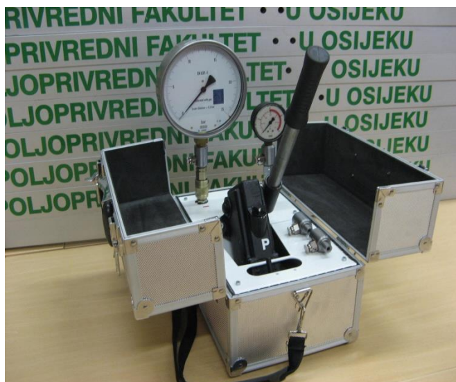
Slika 7. Komparator tlaka Volos

minimalni promjer od 63 mm, te točnost manometra koji se ispituje mora biti \pm 0,2 bara kada se radi o ispitnom području od 0 do 2 bara. Ako se radi o većem ispitnom području odstupanje može iznositi do \pm 10 %.