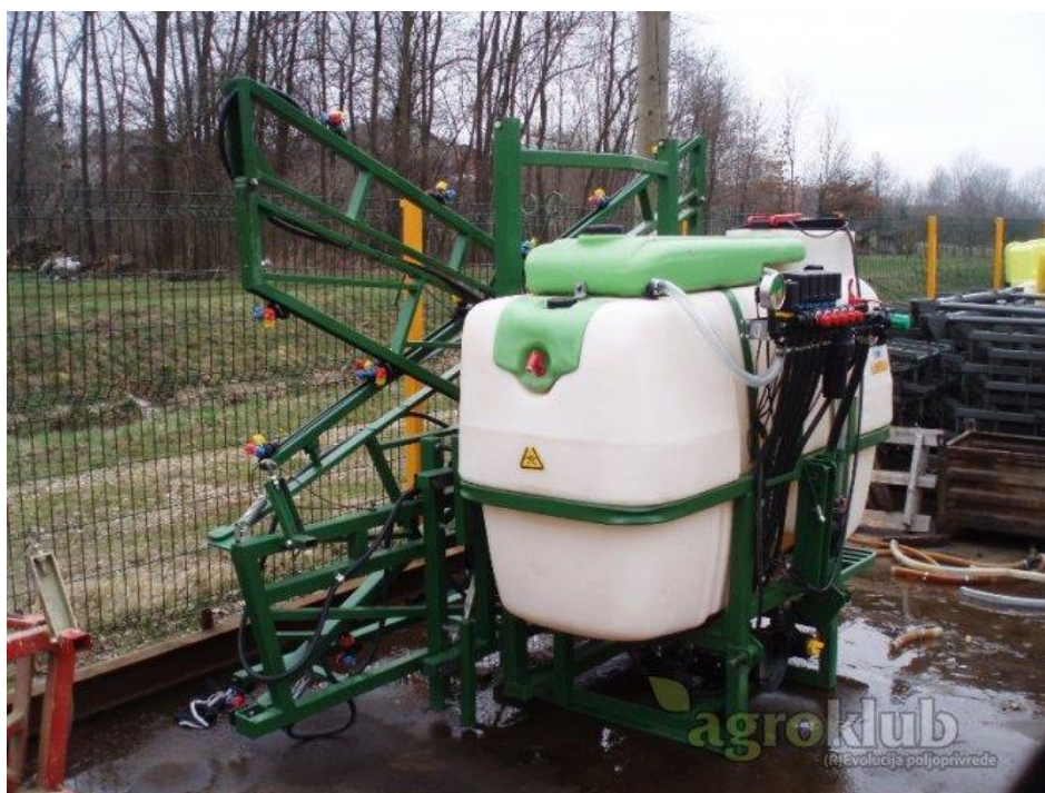
Slika 10. Leško 1100-prskalica

Testiranjem je utvrđeno da dolazi do odstupanja od dopuštenih parametara zbog neispravnosti mlaznica te nepokazivanja dovoljnog tlaka na manometrima radi neispravnosti istih.