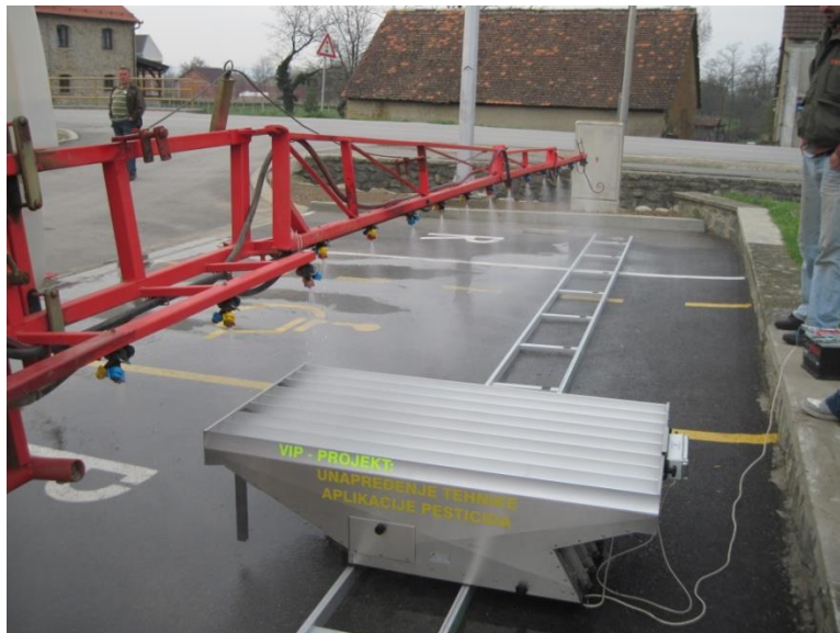
Slika11. Prikaz Spray Scanera u radu

Ispitivanjem pomoću uređaja spray scanner ispituje se poprečna raspodjela tekućine. Prosječni koeficijent varijacije iznosi 18,93% što je optimalan koeficijent varijacije i ostvaruje se zadovoljavanjem horizontalno raspodjele tekućine koja prema EN 13790 standardu mora biti ispod 20%.