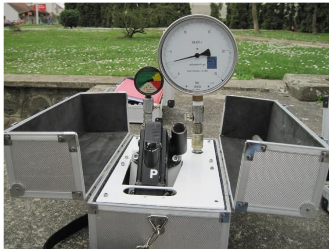
Slika 4. Ispitivanje ispravnosti rada manometara

Ovi radni elementi stroja imaju zadatak, da uz određeni tlak i količinu tekućine izvrše zadanu dozu aplikacije zaštitnog sredstva po biljnim površinama koje se tretiraju.