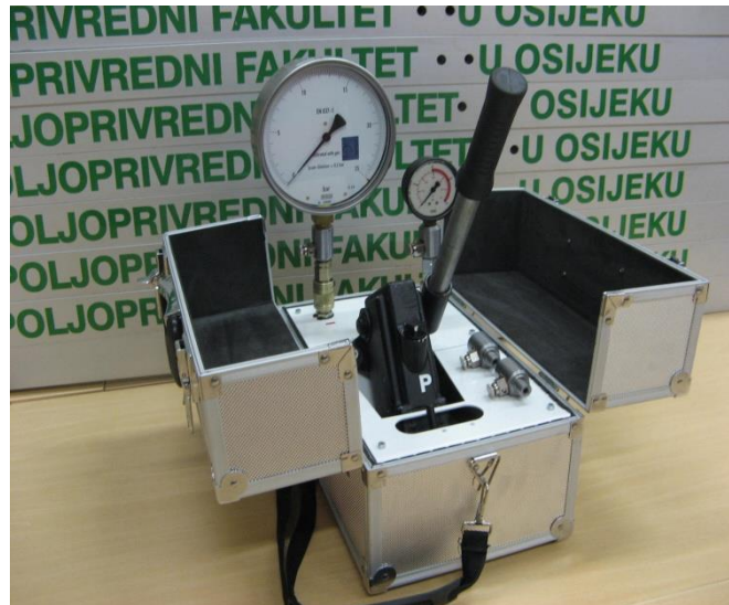
Slika 7. Komparator tlaka Volos

minimalni promjer od 63 mm, te točnost manometra koji se ispituje mora biti \pm 0,2 bara kada se radi o ispitnom području od 0 do 2 bara. Ako se radi o većem ispitnom području odstupanje može iznositi do \pm 10 %.