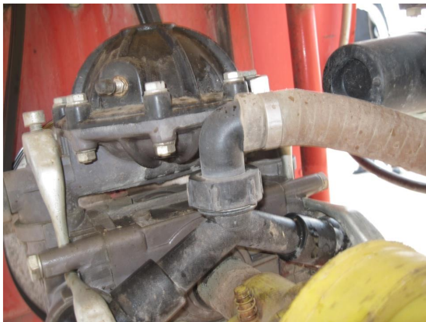
Slika 2. Klipno-membranska crpka AGROMEHANIKA – Model BM 65/30