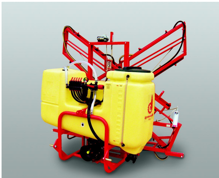
Slika 9. Agromehanika Kranj AGS 600EL-prskalica