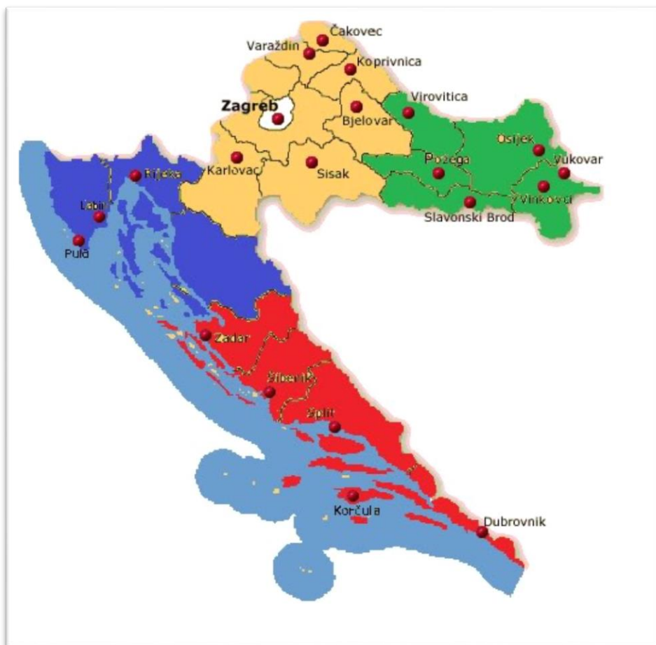
Slika 2. Karta Republike Hrvatske i položaj Osječko – baranjske županije

Osječko – baranjska županija, s površinom od 4.149 km 2 (7,3 % kopnenog teritorija ) i 330.506 stanovnika ( prema popisu iz 2001.godine to predstavlja 7.45 % ukupnog stanovništva Hrvatske ), jedna je od prostorno većih i naseljenijih županija. Smještena je na istoku Hrvatske. Obuhvaća krajeve oko donjeg toka rijeke Drave, prije njezinog utoka u Dunav kod Aljmaša, tj. cijelu hrvatsku Baranju i dio Slavonije koji gravitira gradu Osijeku. Slika 2. pokazuje položaj Osječko – baranjske županije unutar državnog teritorija RH.