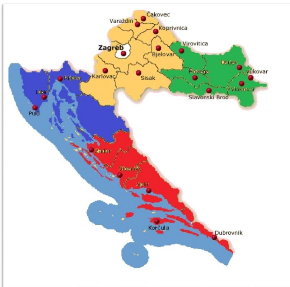
Slika 2. Karta Republike Hrvatske i položaj Osječko – baranjske županije

Osječko – baranjska županija, s površinom od 4.149 km 2 (7,3 % kopnenog teritorija ) i 330.506 stanovnika ( prema popisu iz 2001.godine to predstavlja 7.45 % ukupnog stanovništva Hrvatske ), jedna je od prostorno većih i naseljenijih županija. Smještena je na istoku Hrvatske. Obuhvaća krajeve oko donjeg toka rijeke Drave, prije njezinog utoka u Dunav kod Aljmaša, tj. cijelu hrvatsku Baranju i dio Slavonije koji gravitira gradu Osijeku. Slika 2. pokazuje položaj Osječko – baranjske županije unutar državnog teritorija RH.