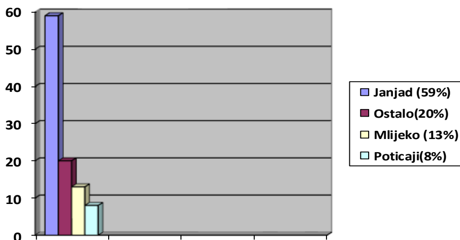
Grafikon 3. Prikaz strukture prihoda na gospodarstvu od 250 grla ovaca u stadu (Izvor: Poljoprivredno-prehrambeni fakultet Univerziteta u Sarajevu, 2007.-2008.)

Najveći dio prihoda ovčarska gospodarstva ostvaruju iz uzgoja janjadi pa dati modeli dominantno ostvaruju iskazanu dobit kod mlijeka na razlici između njegove prodajne cijene i cijene koštanja.