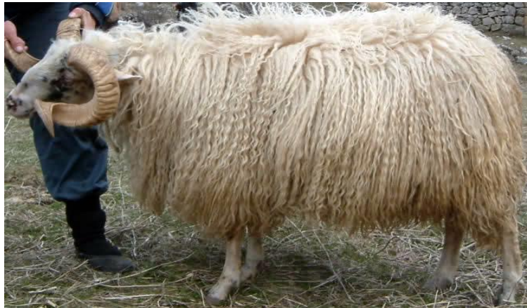
Slika 1. Kupreška pramenka

dubrovačke rude krčke ovce, paške ovce, creske ovce, rapske ovce i ličke pramenke, ali je znatno manjeg tjelesnog okvira od istarske ovce i cigaje (Ivanković i sur. 2009.).