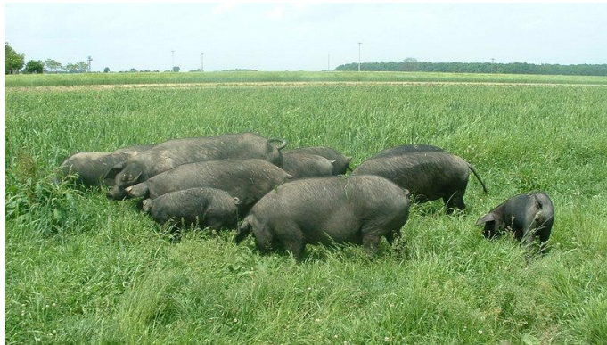
Slika 2. Crna slavonska svinja

Utjecaj tradicionalnog držanja crnih slavonskih svinja na biološku raznolikost pašnjaka i šuma vrlo je značajan. Svinja je kasnozrela, srednje duljine i tamno pigmentiranih papaka. Dlaka je tamno pigmentirana, potpuno crna i ravna. Glava je dugačka, konkavnog profila s polu spuštenim (klopavim) ušima. Prasi 6 do 10 prasadi. Zbog pigmentirane kože, izražene otpornosti i dobrog iskorištavanja voluminoznih krmiva, posebice paše, pogodna je za slobodni sustav uzgoja. U ekstenzivnim uvjetima držanja, prosječni dnevni prirast je 450-500 g, a u intenzivnim uvjetima 600-700 g, uz utrošak hrane za kilogram prirasta 4,5 do 5 kg. Pri držanju na otvorenom, svinje imaju veću mesnatost u odnosu na one držane poluotvorenom, a posebice u zatvorenom sustavu.