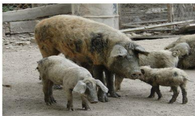
Slika 3. Turopoljska svinja

Prema Đikić, (2003.) upotrebom modernih genotipova svinja kroz križanje s turopoljskom svinjom, ali i uz držanje i turopoljske svinje (zbog uvećanja populacije u svrhu biološke raznolikosti životinja) na obiteljskim gospodarstvima moguće je očuvanje turopoljske svinje kao autohtone i moguće je razvijanje tehnologija niskog inputa za otvorene sustave uzgoja i proizvodnje svinja.