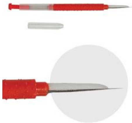
Slika 4. Kineska igla za presađivanje ličinki

Presaðivanje se danas obavlja uglavnom s kineskom iglom (Slika 4.), alatom kojim je moguće najbrže i najkvalitetnije presaditi sitne ličinke. Presaðivanje je vrlo precizan posao koji se mora obaviti brzo, a prostorija mora biti topla i vlažna. Nakon presađivanja okvir se što prije odnosi na pripremljenu zajednicu.