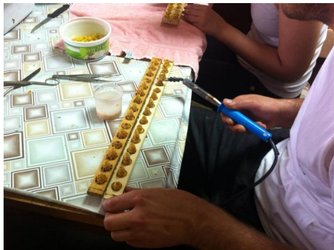
Slika 5. Odsijecanje vrhova matičnjaka

Dodani matičnjaci u košnici ostaju 72 sata. Svakog dana proizvodnje potrebno je prihraniti zajednicu sa šećernim sirupom, a poželjno je u lošijim pašnim uvjetima u plodište umetnuti ram hranilicu sa pogačom, koja će predstavljati stalni izvor hrane.