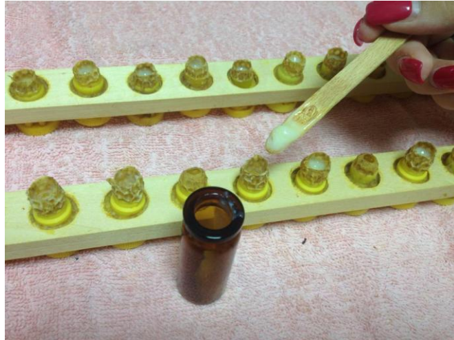
Slika 6. Vađenje matične mliječi

Nakon 72 sata okvir s matičnjacima se vadi i pristupa se vađenju matične mliječi. Prvo se ugrijanim skalpelom ili nožem odsijeca vrh matičnjaka i vade se ličinke ( Slika 5.). Nakon toga se štapićem ili sisaljkom mliječ vadi iz tako pripremljenog matičnjaka (Slika 6.). Prilikom manipulacije s matičnom mliječi potrebno je koristiti samo drvene ili plastične alate. Odmah nakon vađenja mliječi, u iste te matičnjake presađuju se nove ličinke i vraćaju u košnicu. Taj proces se zatim ponavlja opet nakon 72 sata.