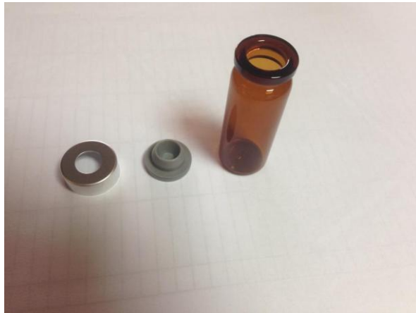
Slika 9. Ambalaža za matičnu mliječ

Matična mliječ se odmah nakon vađenja pakira u bočice (Slika 6. i Slika 9.). To su najčešće penicilinske bočice od 10 grama ili specijalne zatamnjene bočice za matičnu mliječ na koje se stavljaju gumeni čepovi. Iz bočice se iglom izvlači zrak kako bi bila hermetički zatvorena te matična mliječ očuvana od kvarenja i isušivanja. (Kostanjevečki, 2012.) Nepravilno čuvana matična mliječ vrlo brzo gubi svoju vrijednu osobinu - ljekovitost. Matična mliječ čuva se na temperaturama od -18^{\circ}\text{C} ili nižim.