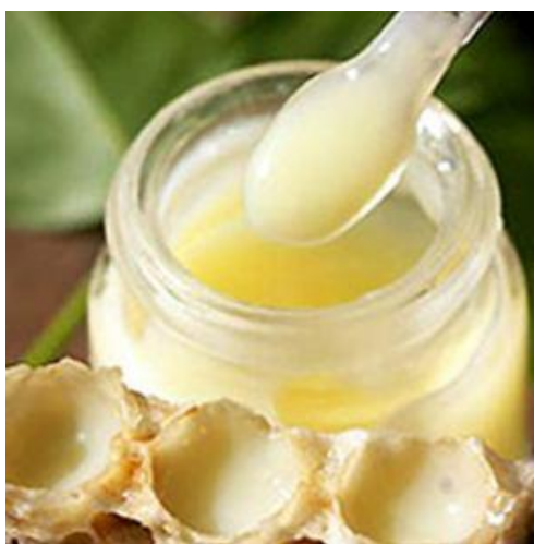
Slika 8. Čista matična mliječ

Čistu matičnu mliječ ili u kombinaciji s još nekim pčelinjim proizvodima preporučava se koristiti sat vremena prije obroka. Pripravak se stavlja ispod jezika (najveća prokrvljenost) i tu se zadrži što je duže moguće kako bi ga organizam u potpunosti apsorbirao. Kod korištenja je potrebno koristiti čiste i suhe drvene, plastične, staklene, keramičke predmete, a nikako metalne. Metali reagiraju sa organskim kiselinama iz pčelinjih proizvoda i razgrađuju visokovrijedne tvari u njima.