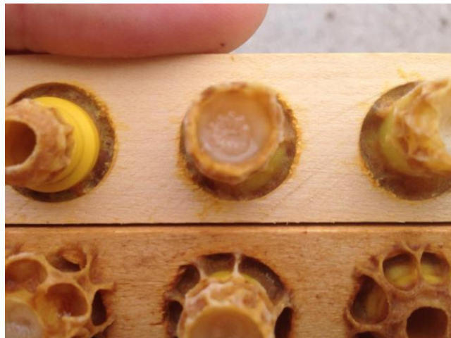
Slika 7. Ličinke u obilju matične mliječi