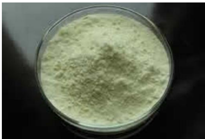
Slika 11. Liofilizirana matična mliječ