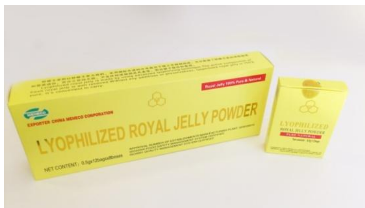
Slika 10. Liofilizirana matična mliječ

Liofilizirana matična mliječ u prahu upotrebljava se tako da se sadržaj vrećice istrese pod jezik, pusti se da se lagano otapa i kanalima žlijezda slinovica otopljena mliječ prelazi u krv koja je dalje prenosi do svake stanice u organizmu čime se postiže maksimalna iskoristivost svih aktivnih sastojaka i maksimalna brzina djelovanja. Za dobivanje 1 grama liofilizirane matične mliječi u prahu potrebno je 6 grama svježe matične mliječi izvađene iz košnice.