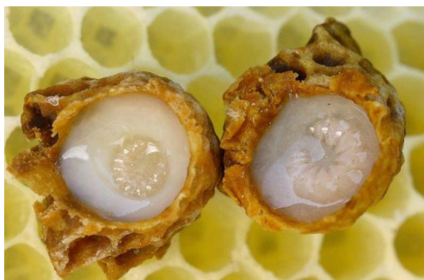
Slika 1. Ličinke budućih matice u obilju matične mliječi

Životni vijek pojedinih članova pčelinjeg društva (matica, radilica, trut) poprilično se razlikuje. Radilica živi nekoliko tjedana do nekoliko mjeseci (ovisno o godišnjem dobu) dok matica živi par godina, a tijekom sezone u povoljnim pašnim uvjetima može položiti do 2000 jajašaca dnevno što je izuzetno veliki napor za organizam. Masa jajašaca je i do dva puta teža od tijela matice. Ovu izdržljivost matici omogućuje konstantna hranidba matičnom mliječi, dok se radilica hrani nektarom i peludom. Podatak o znatno dužem životnom vijeku matice, tijekom kojega je zadržana njezina plodnost i vitalnost, potaknuo je čovjeka da na sebi provjeri učinke matične mliječi.