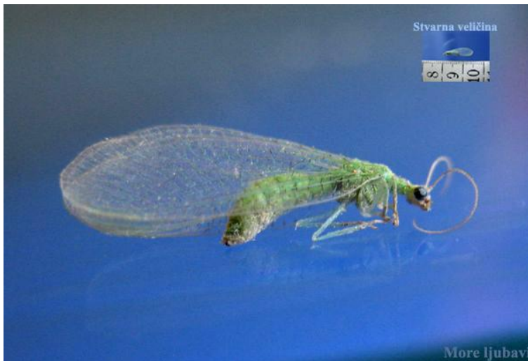
Slika 19. zlatooka ( Crysoperla carnea )

Prava je ljepotica među kukcima jer ima vitko, zeleno tijelo, dva para mrežastih krila, velike, zlatne, sjajne oči i duga ticala (slika 19,20.). Odrasle jedinke hrane se peludom, nektarom i mednom rosom. Ženka zlatooke polaže do 350 jaja, koja na dugim nosačima uvijek postavi na naličje lista, najčešće u blizini kolonije biljnih uši. Iz jaja se razvijaju ličinke, osobito korisne u vrtu jer se hrane biljnim ušima, jajima leptira i grinja, te štitastim ušima i resičarima. Ličinka se intenzivno hrani i jača tijekom dva tjedna svog razvoja te pojede između 200 do 500 biljnih uši, 500 jaja leptira ili 12 000 jaja grinja. Obitavaju u živicama, odakle polijeću u povrtanjak ili voćnjak. Privlači ih crvena boja pa tako treba obojati kućice koje ćemo postaviti.