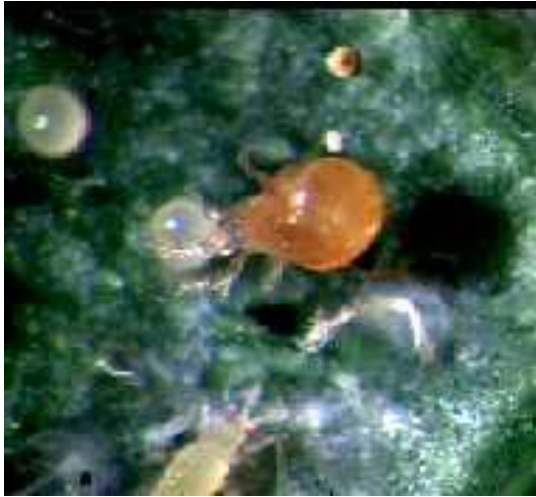
Slika 27. Grabežljive grinje ( Phytoseiulus persimilis )