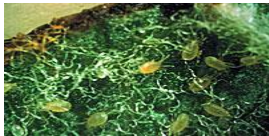
Slika 29. Kampimodromus aberrans