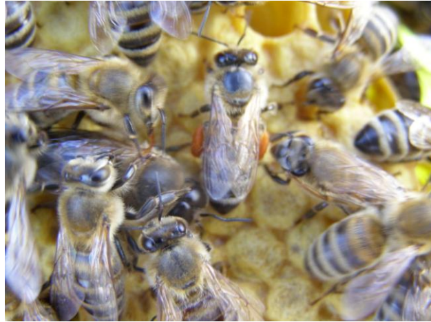
Slika 4. Pčela radilica sa peludi

Pčele radilice razvijaju se iz oplodjenog jaja. Razvoj oplodjenog jaja traje tri dana, a četvrto dana razvije se ličinka. Prva tri dana mlade pčele ju hrane matičnom mliječi, a poslije peludom i medom. Desetog dana pčele pokriju ličinke poroznim voštanim poklopcem (stadij poklopljenog legla). Dvadeset i prvog dana gotova je metamorfoza i nova mlada pčela progriza porozni voštani poklopac i izlazi van iz stanice saća (Belčić, J. 1985.).