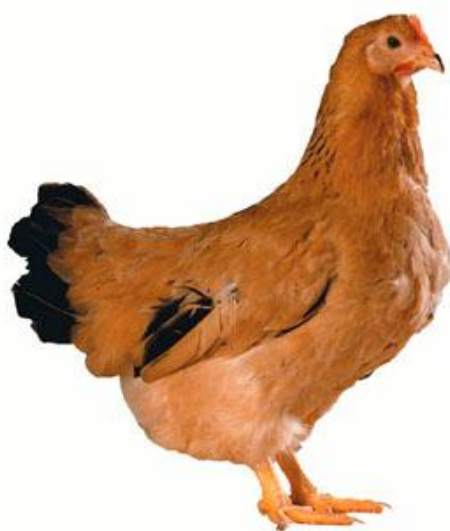
Slika 6. COBB SASSO 150 TM.

genetski odgovara slobodnom načinu uzgoja. Maksimalni prosječni prirast iznosi do 45 grama po danu. Trup je uniformnog izgleda, a meso sočnog okusa (The Poultry Site, 2011).