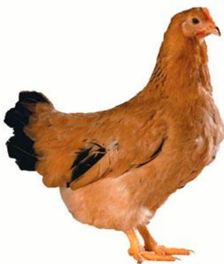
Slika 6. COBB SASSO 150 TM.

genetski odgovara slobodnom načinu uzgoja. Maksimalni prosječni prirast iznosi do 45 grama po danu. Trup je uniformnog izgleda, a meso sočnog okusa (The Poultry Site, 2011).