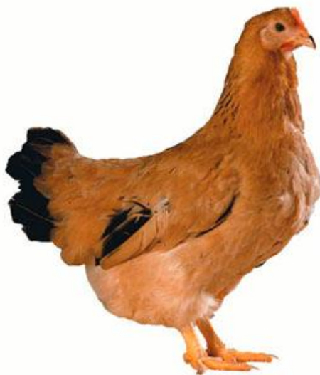
Slika 6. COBB SASSO 150 TM.

genetski odgovara slobodnom načinu uzgoja. Maksimalni prosječni prirast iznosi do 45 grama po danu. Trup je uniformnog izgleda, a meso sočnog okusa (The Poultry Site, 2011).