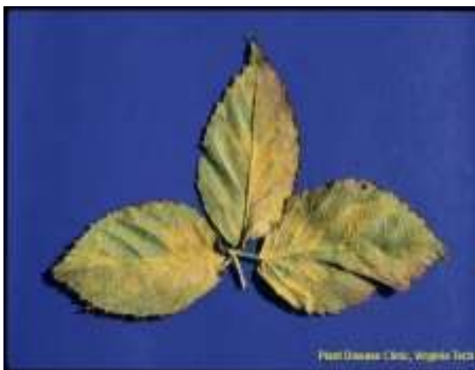
Slika br.4 Kuehneola uredinis na listu kupine

http://ppwsidlab.contentsrvr.net/details.pg_579.vesh