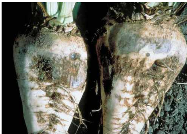
Slika 41. Simptomi bolesti sa Rhizoktonijom solani na korijenu

Na peteljčkama blizu rozete vidimo crne nekroze, tzv. suhu crnu rozetu koju čini osušeno lišće. Repa vene i zaostaje u rastu i razvoju. Korijen može biti zahvaćen u potpunosti ili samo na nekim dijelovima. Na korijenu vidimo trula mjesta koja su sivo-smeđe do crne boje i pukotine, a tkivo se ne razmekša (Slika 41.).