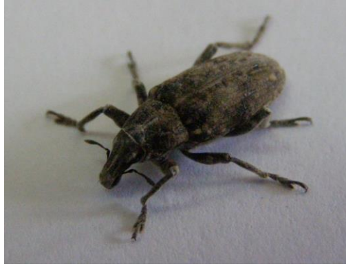
SLIKA 18. Imago repine pipe