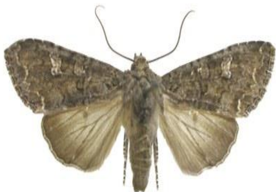
Slika 16. Leptir kupusne sovice