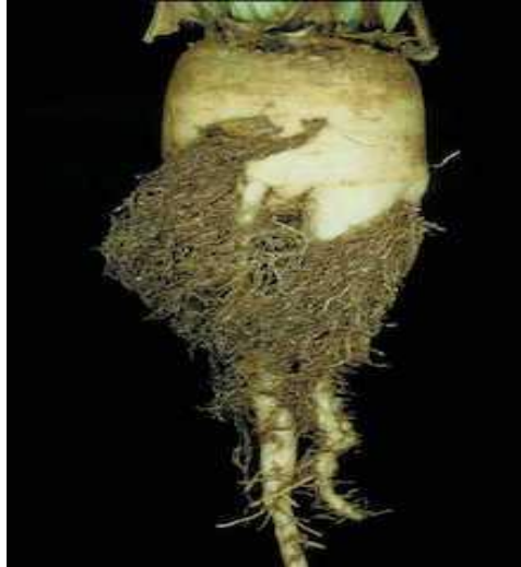
Slika 30. Oštećenje korijena od napada repine nematode