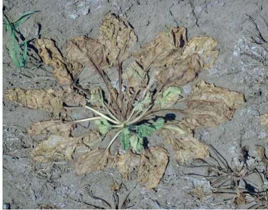
SLIKA 42. Simptomi na listovima od napada Rhizoctonie solani

Kod uznapredovale truleži listovi leže na tlu oko repe u obliku zvijezde ( http://www.Kws.Hr ), (Slika 42.).