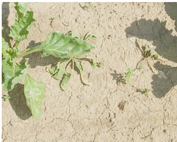
Slika 40. Prvi simptomi Rhizoctonije solani na listovima