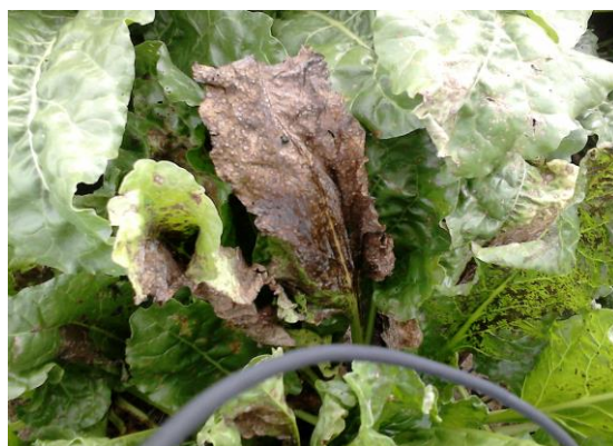
Slika 32. Sušenje lista od napada Cercospora beticola