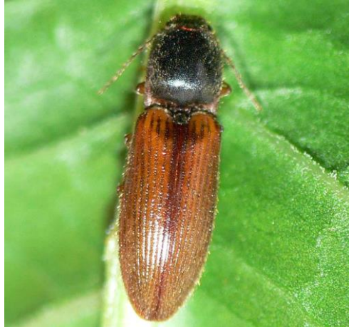
Slika 8. Imago klisnjaka vrste A.sputator Linnaeus