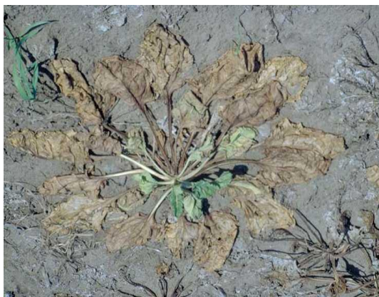
SLIKA 42. Simptomi na listovima od napada Rhizoctonie solani

Kod uznapredovale truleži listovi leže na tlu oko repe u obliku zvijezde ( http://www.Kws.Hr ), (Slika 42.).