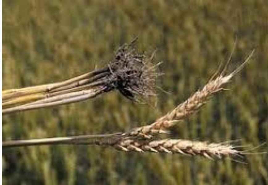
Slika 3. Uzročnik patološkog polijeganja žitarica ( Gaeumannomyces graminis tritici )

Kompeticija podrazumijeva da se korijen biljke domaćina (rizosfera) mora naseliti organizmom koji se primjenjuje za biološko suzbijanje uzročnika bolesti prije nego što dođe do infekcije patogenom (Grahovac i sur., 2009.).