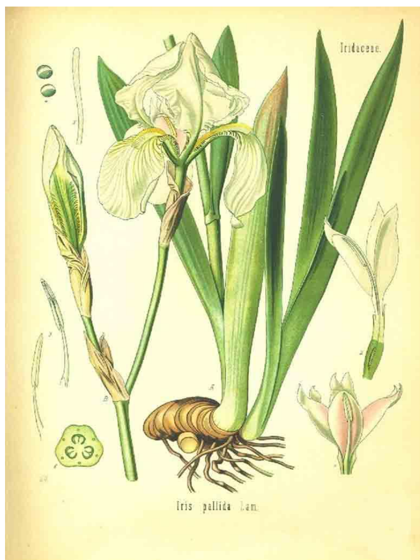
Slika 2. Blijeda perunika ( Iris pallida Lam.)

Od navedenih svojti patuljaste perunike su I. adriatica i I. pumila , koja kao i većina navedenih vrsta pripada „bradatim irisima“ (Pogon-Iris). Pripadnici grupe bez „brade“ (Apogon-Iris) su I. graminea , I. pseudoacorus i I. sibirica (Mitić i Cigić, 2009.).