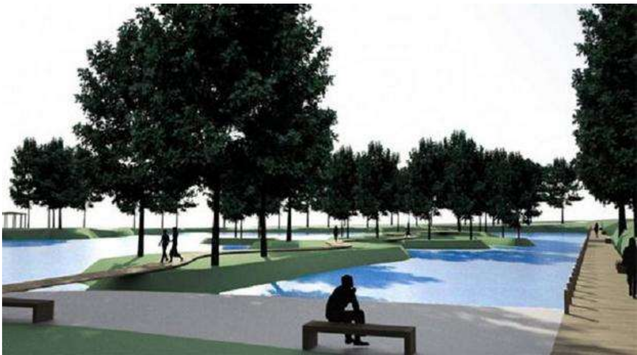
Slika 1: Primjer plana restauracije perivoja Erdödy u Jastrebarskom

Replika je metoda faksimilske rekonstrukcije pri kojoj se kopiraju čitava izvorna graditeljska i umjetnička djela. Ukoliko, recimo, u perivoju postoje vrijedne skulpture, izložene atmosferskim utjecajima, poželjno je napraviti replike tih skulptura kako bi se originalne skulpture zaštitile od negativnih utjecaja.