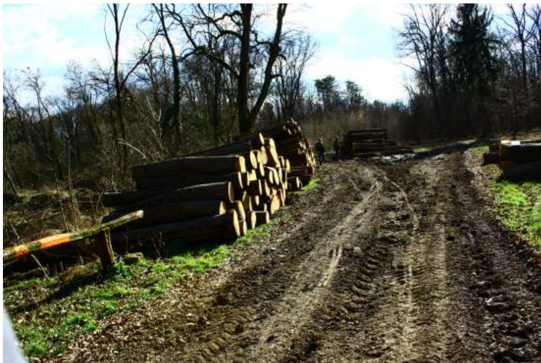
Slika 7: Posječena stabla u park-šumi Zvjerinjak 2009. godine

Ovaj je podhvat također imao posljedice teže od samog narušavanja vizualnosti perivoja. Sječa stabala bila je bučan i dugotrajan podhvat koji je utjecao na cijeli ekosustav park-šume. Rušenjem stabala mnoge su sitne životinje i ptice, ukoliko sječa za njih nije bila kobna, morale potražiti novi smještaj koji je gotovo sigurno bio daleko od buke strojeva i opasnosti. Takvim se potezom narušava ravnoteža tog ekosustava, a brinuti o perivoju znači brinuti o svakom njegovom elementu i njegovoj korelaciji s drugim elementima. Takav pristup ne jamči održanje perivoja kao spomenika vrtne arhitekture, nego njegovu propast.