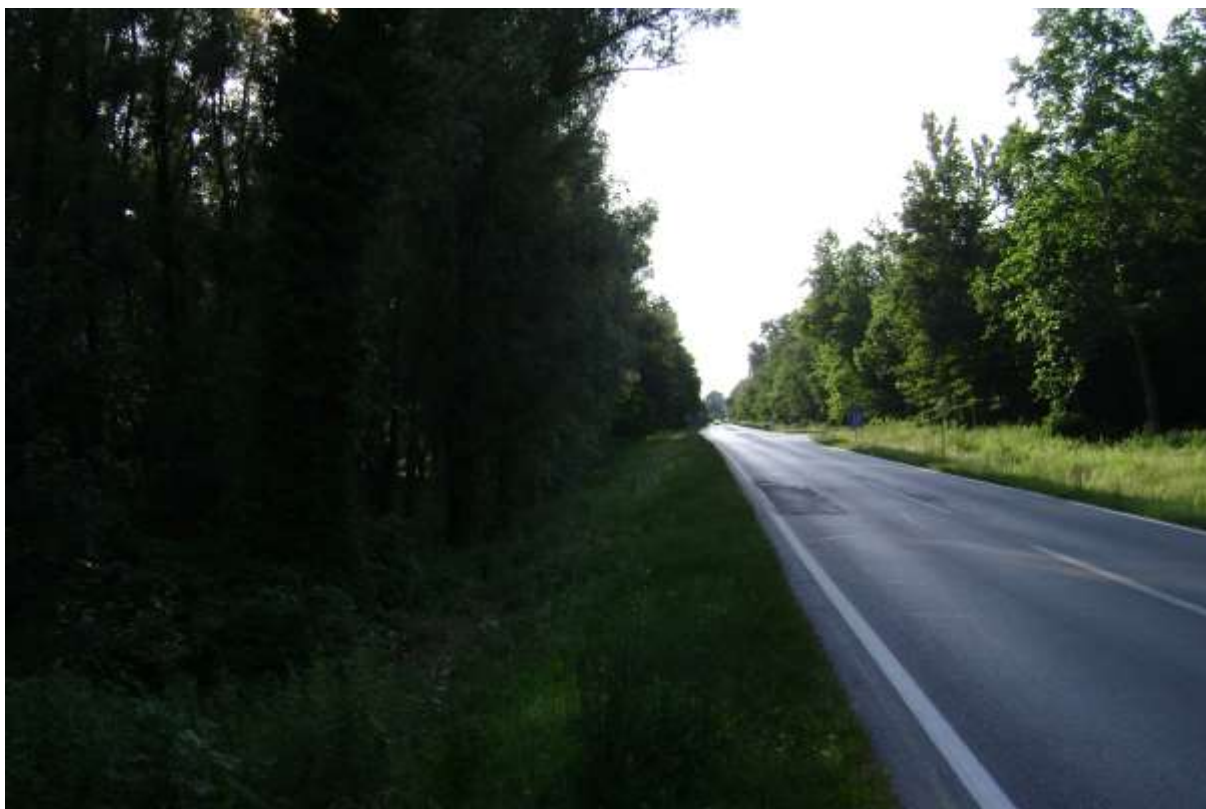
Slika 6: Valpovačka obilaznica (s lijeve strane- park-šuma Zvjerinjak, s desne strane perivoj)