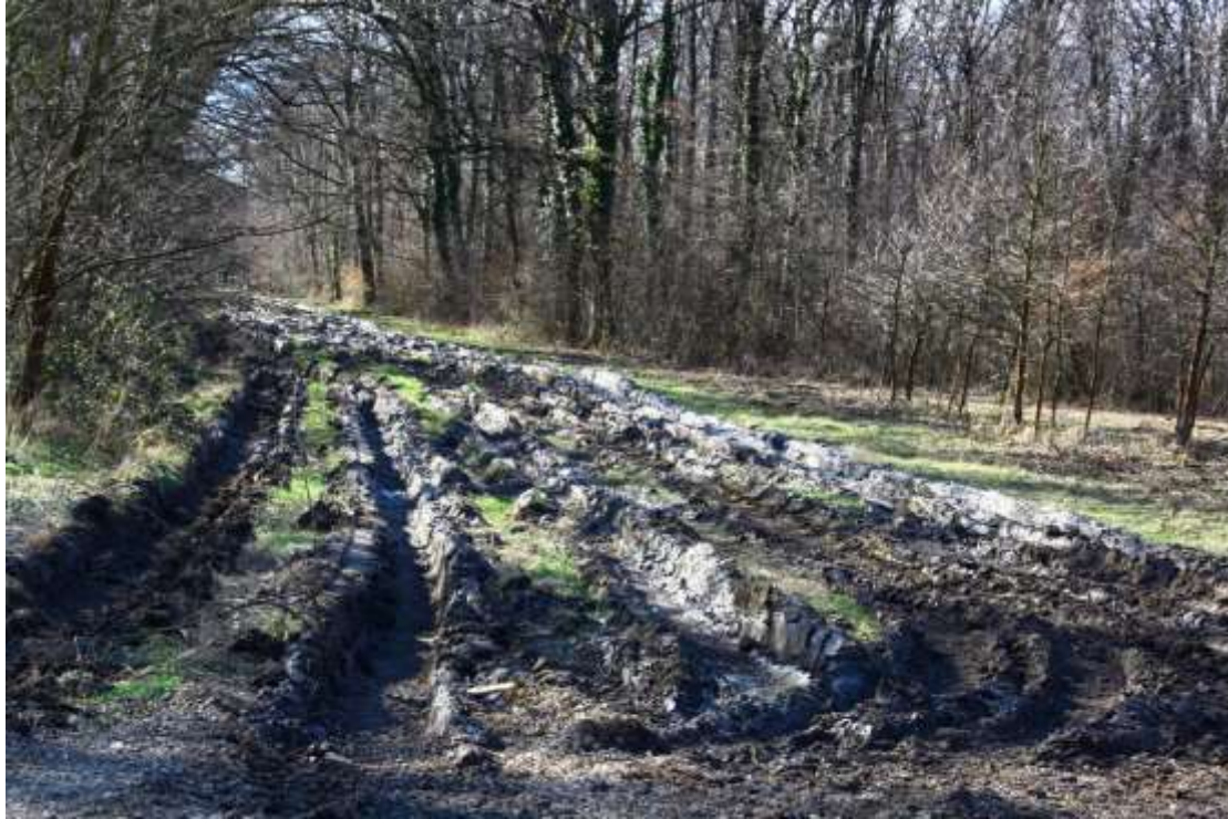
Slika 8: Tragovi vozila za odvoz trupaca u park-šumi Zvjerinjak 2009. godine