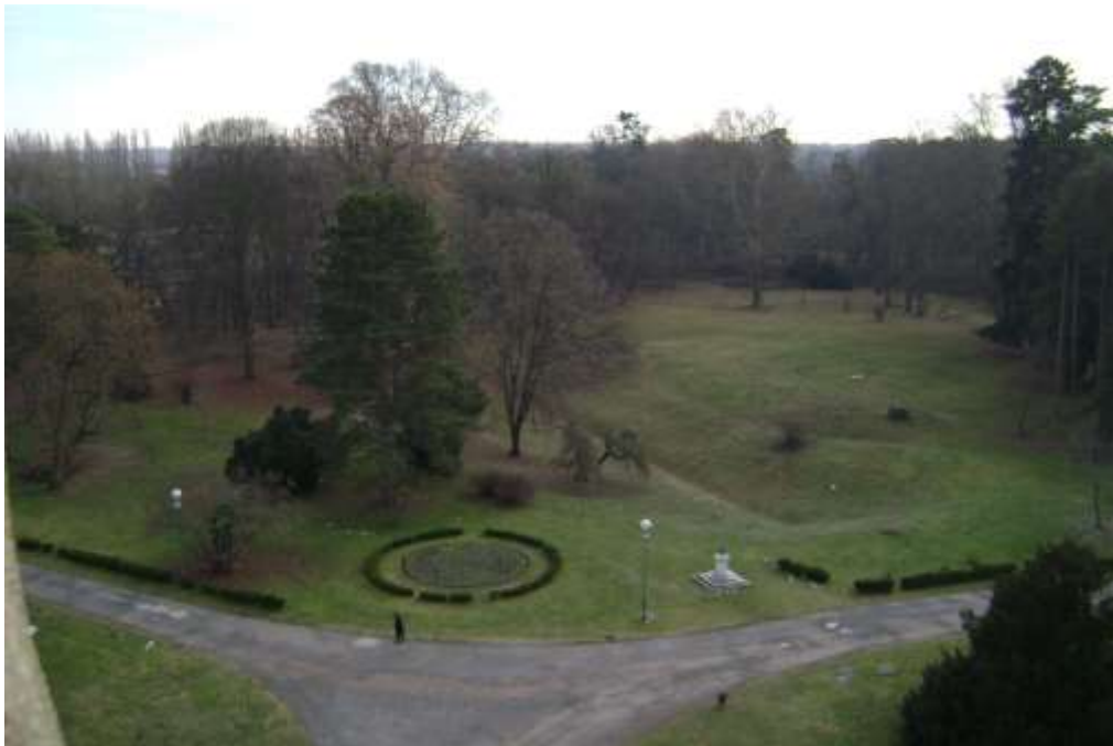
Slika 5: Perivoj u Valpovu 2012.

Godine 1991. započeta je još jedna obnova perivoja, u kojoj je posječen ostatak samoniklog i unesenog drveća.