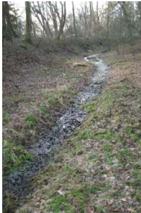
Slika 2: Presušeni tok rijeke Jadike

Dio perivoja između Jadike i dvorca također ima odlike pejzažnog perivoja, ali tu već nalazimo romantičarske preinake i nevješte zahvate iz 20. stoljeća. Ono što je posebnost ovog perivoja je tek takova neznatna izmjena od njegovog originalnog stanja do danas. Ta ga rijetka osobitost svrstava među najvažnije spomenike vrtlarske arhitekture u Hrvatskoj. 1