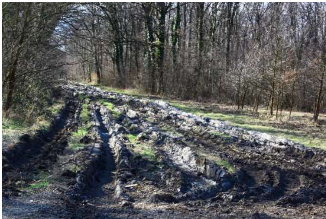
Slika 8: Tragovi vozila za odvoz trupaca u park-šumi Zvjerinjak 2009. godine