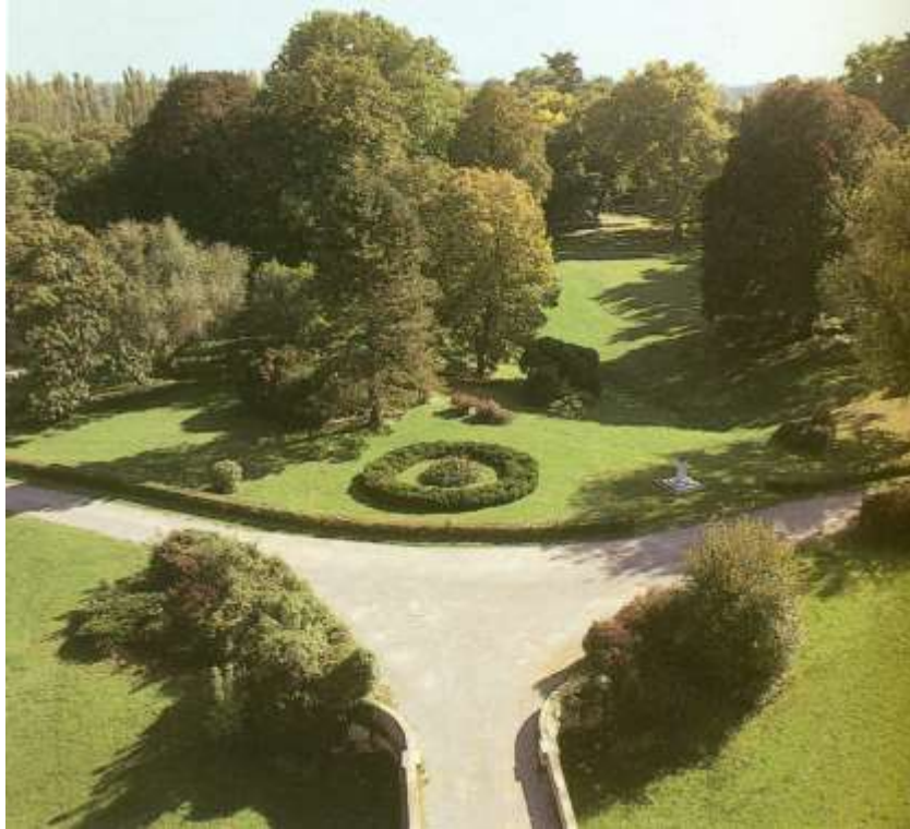
Slika 4: Pogled na perivoj nakon obnove 1990.