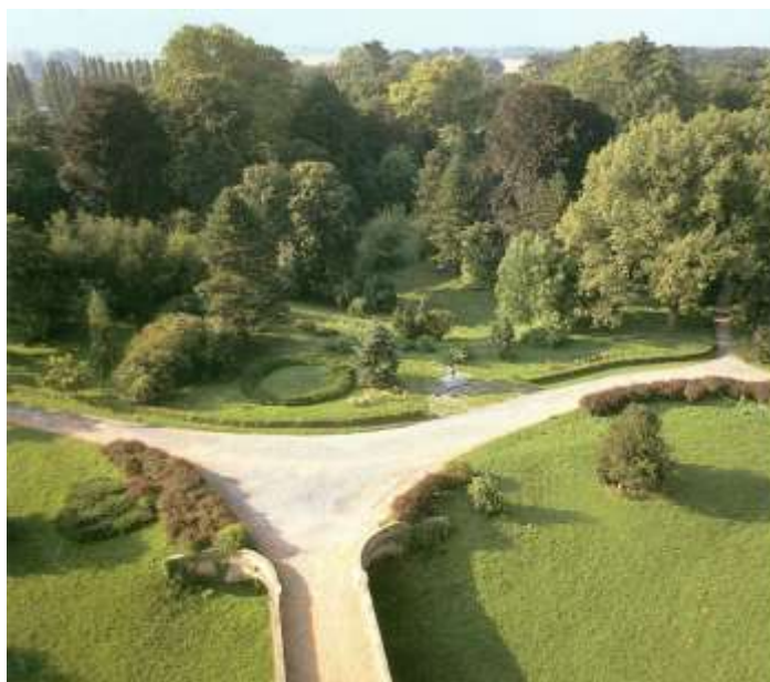
Slika 3: Perivoj 1988. godine zakrčen novim vrstama

Godine 1988. započela je obnova perivoja i prekinuta je nakon dvije godine. U te dvije godine posjećena je većina novounašenog i samoniklog drveća i perivoju su većinom vraćene stare livade i vidici.. 1989. 15 i 1991. 16 godine nastala su dva nova projekta za obnovu i uređenje perivoja, no izvedbeni je projekt iz 1991. godine prekinut zbog početka Domovinskog rata i nikada nije nastavljen.