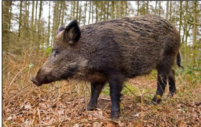
Slika 5: Divlja svinja