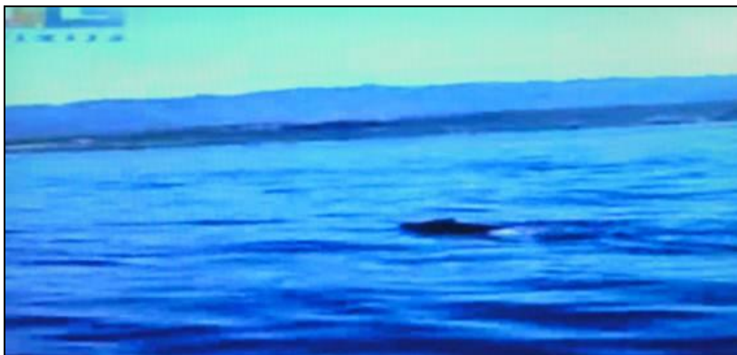
Slika 3: Divlja svinja pliva u moru s otoka Cresa na Krk