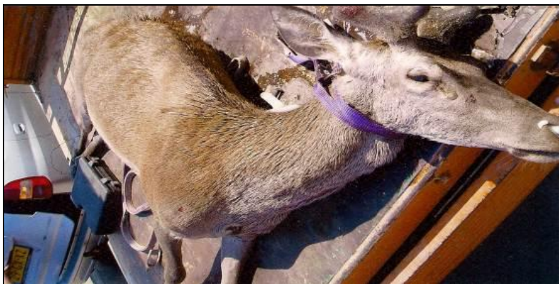
Slika 2: Izvađeni utopljeni jelen na plaži Baška 2008. g.