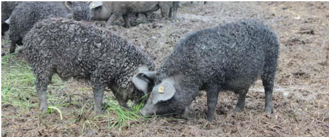
Slika 7. Mangulica