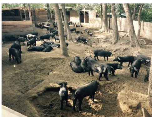
Slika 11. Uzgoj crne slavonske svinje na otvorenom

svinja koji potječu iz takvih sustava uzgoja. Uzgojne sustave možemo podijeliti na intenzivni, poluintenzivni i ekstenzivni način uzgoja. Dok se intenzivni sustav bazira na uzgoju plemenitih pasmina svinja s velikim tovnim svojstvima te hibrida, ekstenzivni uzgoj se koristi u proizvodnji većinom domaće autohtone pasmine. Držanje autohtonih pasmina ima brojne prednosti pa su one tako puno otpornije na bolesti, otpornije su na stres, imaju veću mogućnost aklimatizacije na različite vanjske uvjete, iskorištavaju nisko vrijedna krmiva te za razliku od intenzivnog sustava pojeftinjuju proizvodnju (tablica 1.) (Margeta i sur., 2015.).