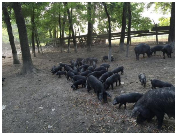
Slika 12. Držanje krmača s podmlatkom na otvorenom

Crna slavonska svinja u Hrvatskoj se uzgaja na ekstenzivni i poluekstenzivni način. Ovakav vid hranidbe omogućuje potpuno iskorištenje genetskog potencijala crne slavonske svinje u pogledu njezine plodnosti i mesnatosti (Karoly, 2010.). U zadnjih desetak godina u Republici Hrvatskoj bilježi se rast ekstenzivnog uzgoja crne slavonske svinje ili fajferice, koja je po svojim morfološkim i fiziološkim svojstvima prilagođena ovakvom načinu uzgoja i klimatskim uvjetima koji prevladavaju u Slavoniji i Baranji (Margeta i sur., 2015.). Kroz povijest crna slavonska svinja je držana na tradicionalniji način koji je podrazumijevao napasivanje na pašnjacima i žirovanje u šumama Slavanskog hrasta. Danas se povećava broj fajferica uzgajanih na ovakav način što omogućuje proizvodnju naših kvalitetnih tradicionalnih proizvoda i bolju poziciju na tržištu. Uzgoj crnih slavonskih svinja u Hrvatskoj podrazumijeva držanje svinja u šumama i napasivanje na kvalitetnoj ispaši, te je crna slavonska svinja prilagođena za iskorištavanje paše i voluminozne krme. U Hrvatskoj se žirovala sve do 60-ih godina prošlog stoljeća. Žirovanje svinja (iako je danas u Hrvatskoj zabranjeno držanje svinja u šumama) se provodi od prosinca do veljače te se svinje većinom hrane žirom hrasta lužnjaka i kitnjaka. Upravo donošenje zakona o šumama u kojima je silvopastoralni način držanja svinja zabranjen, imao je veliki utjecaj da se ova tradicija žirovanja danas u potpunosti izgubila.