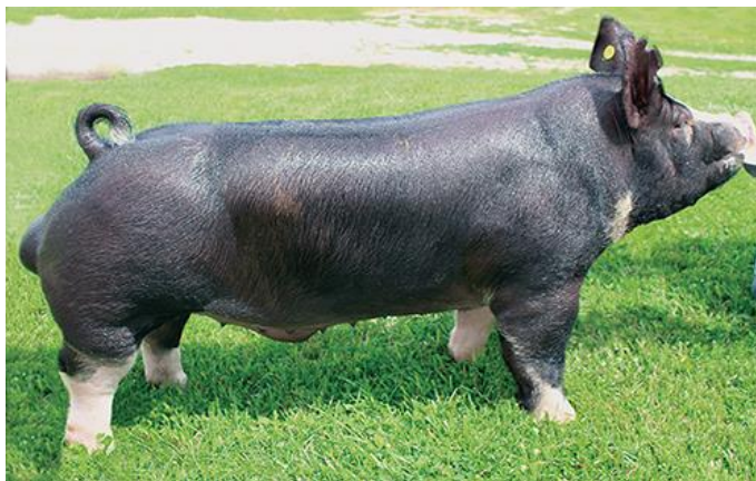
Slika 8. Berkshire

su tanke i kratke. Koža i dlaka su crne boje (Kralik, 2007.). Čekinje crne boje, ravne i srednje duge, sa bijelim oznakama na perifernim dijelovima nogu, glave i repa. Krmače daju 6 – 12 prasadi u leglu.