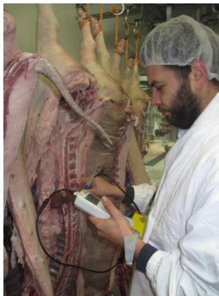
Slika 20. Određivanje pH vrijednosti u MLD-u

Boja mesa određivana je pomoću Minolta kolorimetra (CR 300, Minolta Camera Co. Ltd., Osaka Japan). Minolta – 300 mjeri boju na odsječku najdužeg leđnog mišića 24 sata post mortem . Boja mesa je određena s tri vrijednosti, L^* , a^* i b^* , L^* koje označavaju bljedoću, a^* stupanj crvenila mesa i b^* mjeri stupanj žute boje. Kao standard pri mjerenju je korištena bijela pločica ( L^*=93,30 ; a^*=0,32 ; b^*=0,33 ).