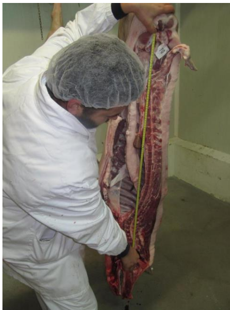
Slika 17. Mjerenje dužine polovice

Na liniji klanja određeni su masa polovica, dužina polovica, dužina i opseg buta i debljina slanine i mišića. Dužina polovice „a“ mjerena je od prvog reba do os pubis . Mjera polovice „b“ mjerena je od os pubis do atlasa .