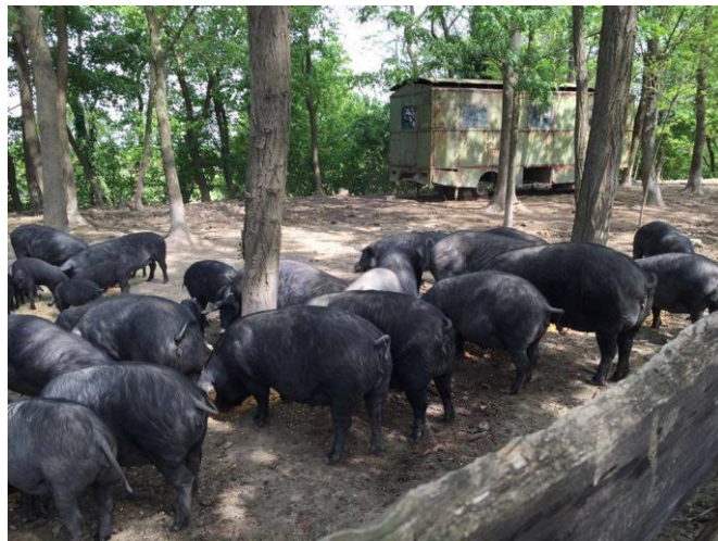
Slika 13. Tovljenici crne slavonske svinje

Prema Pravilniku crne slavonske svinje (UCSS „Fajferica“, 2014.) u intenzivnom uzgoju imaju veliki problem zbog zamašćenja trupa što nepovoljno utječe na klaoničku i tržišnu vrijednost polovica dok ekstenzivni način uzgoja, koji omogućava slobodno kretanje životinjama i hranidbu voluminoznim krmivima uz dodatak žitarica ili leguminoza, omogućava postizanje optimalnih klaoničkih vrijednosti u polovicama. Smještaj svinja ne zahtjeva velike financijske troškove, ali treba obratiti pozornost na uvjete držanja prasadi te gravidnih krmača. Krmače u visokom stadiju graviditeta drže se u krmačarnicama koji trebaju zadovoljavati određene uvjete (Karoly 2010.). Prostor mora biti ograđen da bi se smanjio kontakt s divljim svinjama, a to je vrlo važno radi spriječavanja širenja zaraznih bolesti. Važno je osigurati pravilan smještaj, da bi se smanjio nepovoljan utjecaj ljeti radi visokih temperatura te zimi radi niskih temperatura. Danju se slobodno kreću po pašnjaku, a noću i za lošeg vremena zatvaraju se u objekte. Krmače s leglom držimo u kućicama 1 do 1, 5 mjeseci nakon prasnjenja s mogućnosti izlaženja krmača na otvoreno. Nakon odbića krmače držimo zajedno s nerastovima u ograđenom prostoru (Uremović, 2002.).