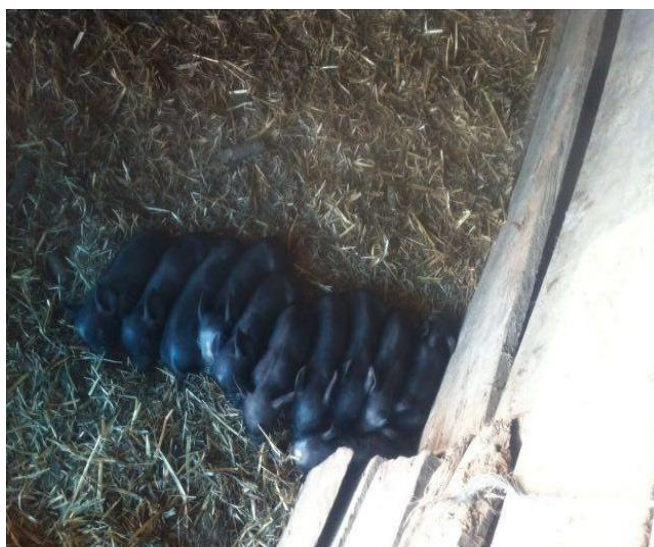
Slika 4. Prasad crne slavonske svinje

Udio i kakvoća mesa crna slavonske svinje ovisi o načinu hranidbe. Prema Uremović (2004.) postotak mesa tovljenika u tovu na paši, žiru uz dohranu kukuruza , kreće se oko 40 % u polovicama, te se unutarmišćna mast kreće od 4 do 8 %. Meso ima dobru sposobnost vezanja vode, što s ostalim svojstvima kakvoće je velika prednost za preradu u trajne proizvode. Meso crne slavonske svinje je zadovoljavajuće kakvoće, a boja