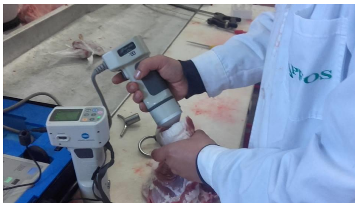
Slika 21. Određivanje boje mesa

Gubitak mesnog soka, odnosno drip loss, određen je „metodom vrećice“ prema Kauffmanu (1992). Ovom metodom se izuzima odsječak najdužeg leđnog mišića koji je prethodno ohlađen 24 sata. Debljina odsječka je 3 cm. Daljni postupak zahtjeva skladištenje uzorka pri temperaturi od 6°C. Nakon 48 sati, uzorak se važe te se stavljaju u omjer mase uzorka s početka vaganja i nakon 48 sati. Dobivena vrijednost se izražava u postotku.