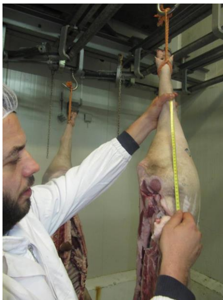
Slika 18. Mjerenje dužine buta

Metodom dvije točke mjerena je debljina leđne slanine na mjestu gdje m. gluteus medius najdublje prodire u slaninu (S). Debljina mišića određena je na mjestu gdje je najkraća udaljenost između kranijalnog završetka m. gluteus medius-a i dorzalnog spinalnog kanala.