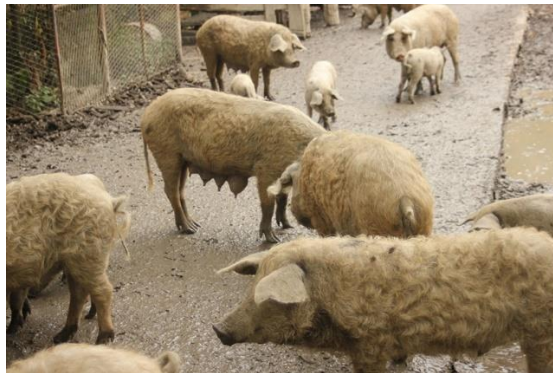
Slika 10. Turopoljska svinja

Uz crnu slavonsku svinju, turopoljska svinja također spada u autohtonu pasminu koja je nastala na području Turopolja. Pripada primitivnim pasminama svinja, te u masnu pasminu. Tijelo je duboko i kratko, obraslo kovrčavom dlakom, žućkasto prljave boje s crnim mrljama (Kralik 2011.) te je koža nepigmentirana (Kralik, 2007.). Plodnost je srednja te krmača prasi 6 do 7 prasadi u leglu. Prasad s 8 tjedana dostižu 12 kg, a sa 6 mjeseci 40 kg. Tovljenici postižu 150 do 160 kg sa 16 – 18 mjeseci s visokim randmanom od 85 % (Uremović Z., Uremović M., 2002.). Vrlo otporna pasmina i pogodna za ekstenzivan uzgoj.