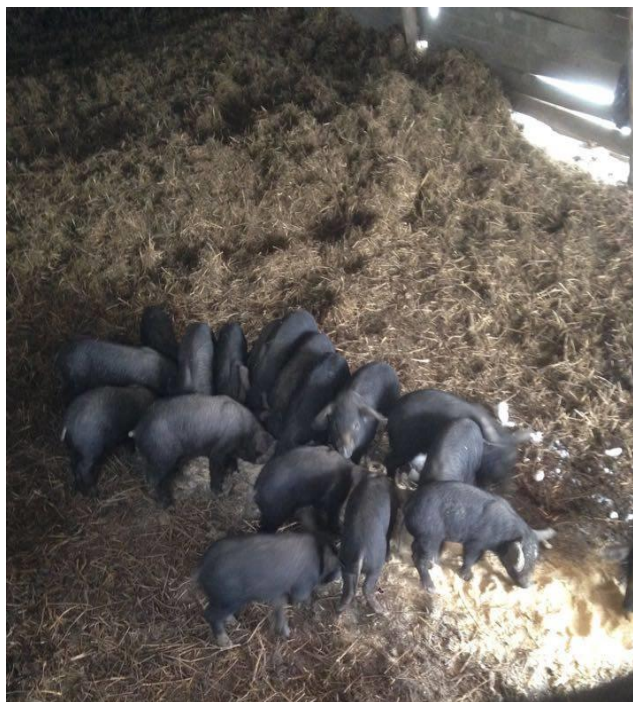
Slika 5. Uzgoj prasadi na dubokoj stelji

mesa je svjetloružičasta. Udio mišića u polovicama na liniji klanja iznos od 32,59 do 42,59 %. U gospodarskom smislu od crne slavonske svinje treba istaknuti vrlo kvalitetne suhomesmate proizvode, od kojih je najpoznatiji slavonski kulen (Karolyi i sur., 2010). Također, kakvoća prerađevina ovisi i o sastavu masnih kiselina u unutarmišićnoj masti koji je u usporedbi s plemenitim pasminama bolji kod crne slavonske svinje (Uremović, 2004.).