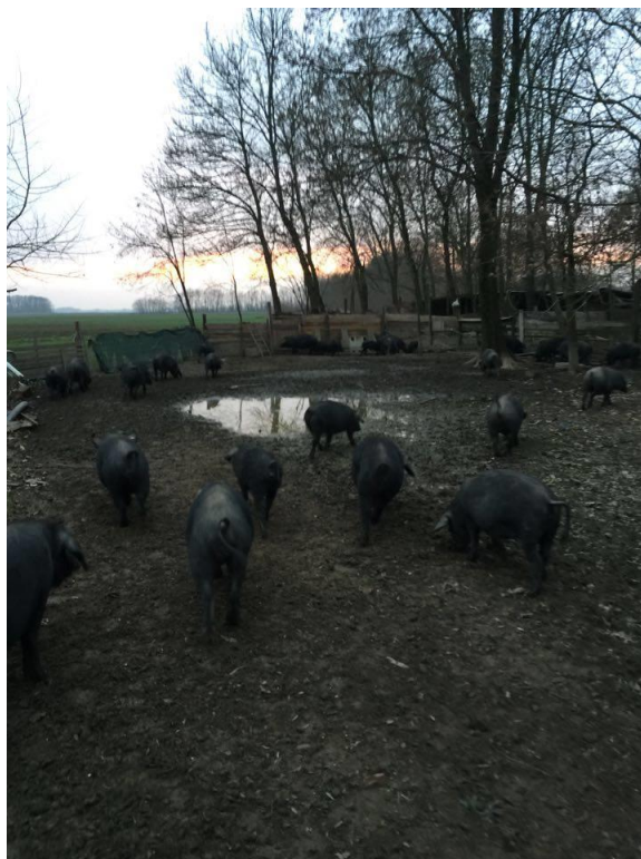
Slika 16. Ekstenzivni način uzgoja

izvodimo na pašu u ekstenzivnim proizvodnim sustavima jer se povećava unos omega – 3 polinezasićenih masnih kiselina. Pozitivan učinak žira na masno – kiselinski sastav mišićnog tkiva utvrđen je nakon što su se crne slavonske svinje u završnim fazama tova hranili sa žirom umjesto kukuruznom krmnom smjesom. Žir je izrazito bogat alfa linolenskom kiselinom (C18:3 n-3) te se pokazalo znatno povećanje ove masne kiseline u sastavu mišića svinja koje su hranjene ad libitum sa žirom. Ima povoljan utjecaj na kvalitetu mesa i na zdravlje potrošača ( Karoly i sur., 2010.).