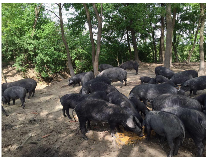
Slika 14. Prihrana prasadi s kukuruzom

Hranidba svinja na ekstenzivan način podrazumijeva hranidbu svinja na pašnjacima, u šumama te prihranjivanje, posebno u zimskom periodu, kukuruzom i ostalim žitaricama. Napasivanje svinja ima bolji utjecaj na svinje nego hranidba u zatvorenom prostoru jer vrlo brzo povećava obujam probavnih organa pa životinje mogu konzumirati veće količine hrane. To je posebno bitno za krmače, pogotovo u razdoblju laktacije. U tom slučaju manja je razgradnja tjelesnih rezervi potrebnih za sintezu mlijeka. Paša sadrži jako veliku ugljikohidratnu i vitaminsko – mineralnu komponentu ali zbog veće količine vlakana potrebna je velika masa koju životinja mora konzumirati. Sama ispaša može zadovoljiti potrebe gravidnih krmača, ali ne i onih u laktaciji. Kod njih je potrebna dodatna hrana, a tu koristimo voluminozu (kukuruzne silaže, stočne repe, krumpir, bundevu, mrkvu) te koncentrat (Pejaković 2002.).