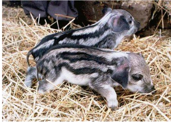
Slika 6. Prasad mangulice

skromnijim uvjetima držanja i slabijoj kakvoći hrane ( Uremović Z., Uremović M., 2002.). Danas je značajna u smislu očuvanja autohtonih pasmina i njihova genoma. Uzgoj magulice održao se u Mađarskoj.