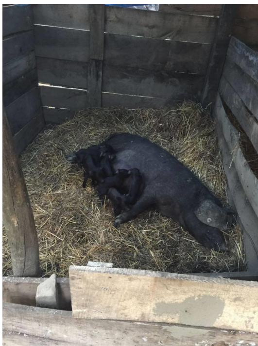
Slika 3. Krmača s prasadi