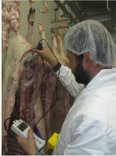
Slika 19. Određivanje pH vrijednosti u butu