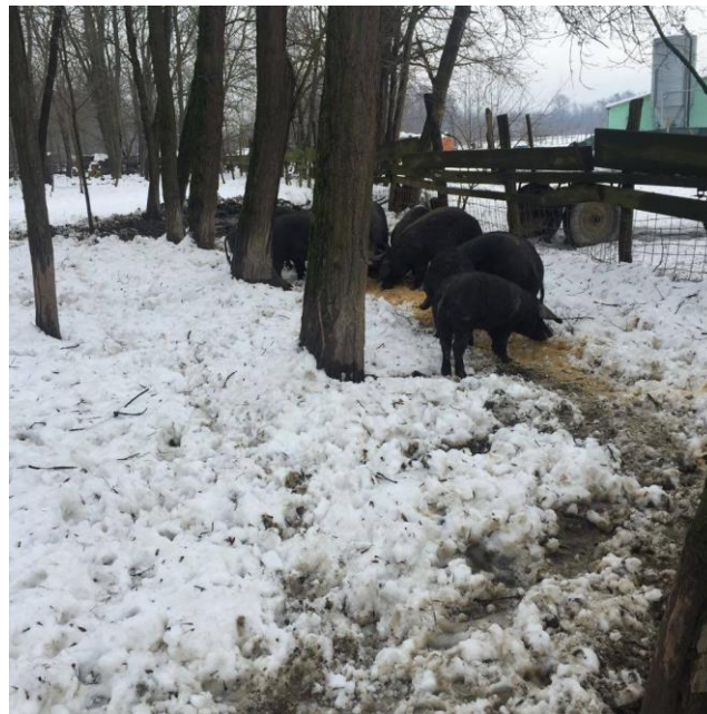
Slika 15. Hranidba crnih slavonskih svinja tijekom zimskog razdoblja

pasmine te se tako kod nas posebno ističe crna slavonska svinja, koja najveći potencijal za uzgoj ima u hrastovim šumama ali i u šumama bukve i pitomog kestena. Zbog velikih zahtjeva svinja u graviditetu i laktaciji, te preko zimskog perioda, uz prirodnu hranu potrebno je dodavati žitarice te drugu voluminozu. Uz to, veoma je bitno svinje izvoditi na pašnjake i strništa (Margeta i sur., 2013.). Ovaj sustav također ima i nedostatke kao što su uništavanje mladih stabala, križanje s divljim svinjama, prekomjerno povećanje populacije te mogući prijenos zarazne bolesti.