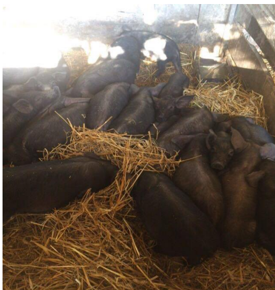
Slika 2. Prasad crne slavonske svinje

Spolno dozrijeva s godinu dana (Poljak, 2011.). Krmače imaju između 10 i 14 sisa, a veličina legla krmača crne slavonske pasmine je niža u odnosu na krmače plemenitih pasmina i kreće se između 6 i 7 živooprasene prasadi u leglu (Senčić i sur., 2001) tjelesne mase 1,1 do 1,2 kilograma. Prasad je kod rođenja jednobojno sivkaste boje te se rađa gotovo bez dlake. Odbijena prasad sa 2 mjeseca teži oko 12 kilograma. Tovljenici tjelesnu masu od 100 kilograma postižu sa 7 – 8 mjeseci, te za kilogram prirasta troše 4,5 do 5 kilograma hrane (kukuruza) (Uremović, 2004.). Prosječni dnevni prirast je oko 550 grama. Spolno zrele nazimice teže od 90 do 100 kg, a tovljenici 120 do 140 kg u dobi od godinu dana, s 40 – 45 % masti u polovicama (Uremović Z., Uremović M., 2002.). U prosjeku krmače se prase 1.5 puta godišnje (Karolyi i sur., 2010).