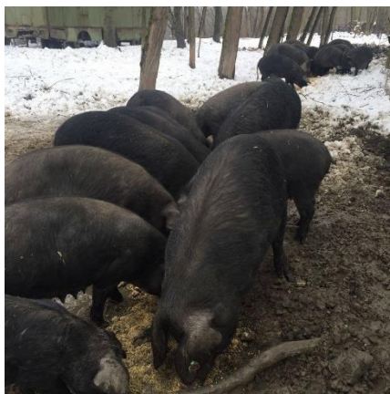
Slika 1. Crne slavonske svinje

Crna slavonska svinja pripada skupini prijelaznih pasmina svinja koje su nastale selekcijom i križanjem domaćih pasmina. Prema proizvodnim karakteristikama pripada masno – mesnom tipu svinja (Kralik, 2007.). Kasnozrela je, srednje veličine (Poljak, 2011.), trup je kratak s dubokim i širokim prsima, ravnih leđa, butovi su dobro razvijeni, a noge kratke i tanke, ali čvrste (Uremović, 2004.). Koža crne slavonske svinje je tamno pigmentirana, pepeljasto sive boje s rijetkim, potpuno crnim i ravnim čekinjama. Glava je duga, konkavnog profila u širokom čeonom dijelu, dok je u nosnom dijelu ravna, a uši poluklempave. Rilo i papci su crni. Visina grebena je oko 68 cm, a težina odraslih svinja kreće se oko 270 kg (Poljak, 2011.). U intenzivnom tovu (14 – 16 mjeseci) crna slavonska svinja može postići masu od 180 do 200 kilograma (Kralik, 2011.).