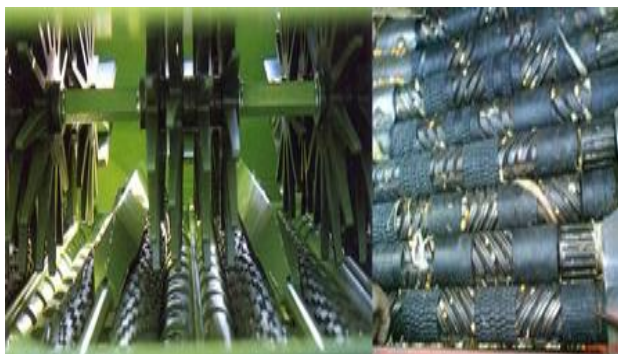
Slika 9. Transporteri

kod nekih nakon branja ostane i do 30% neokomušanih klipova. Berbu kukuruza u klip u treba započeti kada vlažnost zrna na klipu padne ispod 30%. Za uspješno čuvanje kukuruza u košu treba paziti da se skladište samo zdravi, čisti i zreli klipovi. Vlaga zrna ne bi trebala biti viša od 26%. Ukoliko se uskladištio vlažniji kukuruz, tada je potrebno ventiliranjem dosušiti kukuruz na navedenu vlažnost.