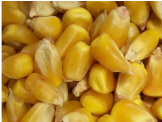
Slika 6. Plod kukuruza

dijelom primarne stabljike ili pupoljčićem (plumula). Primarna stabljika sastoji se od 5-6 kratkih članaka, a na svakom koljencu nalazi se po jedan list. Prvi list poznat je pod imenom štitić (scutellum).