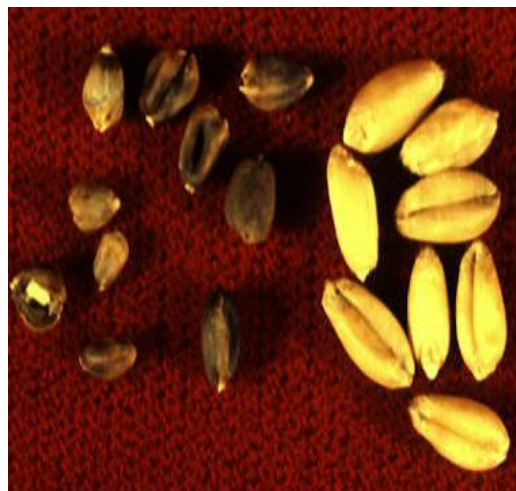
Slika 9. Zrno pšenice lijevo - napadnuto zrno, desno - zdravo zrno