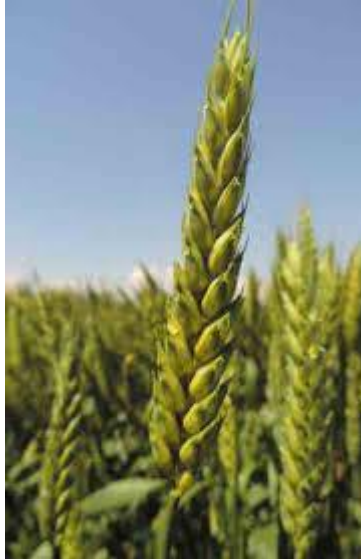
Slika 18. Klas pšenice Sranjka