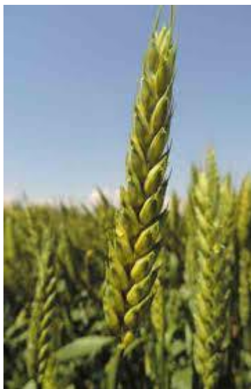
Slika 18. Klas pšenice Srpanjka