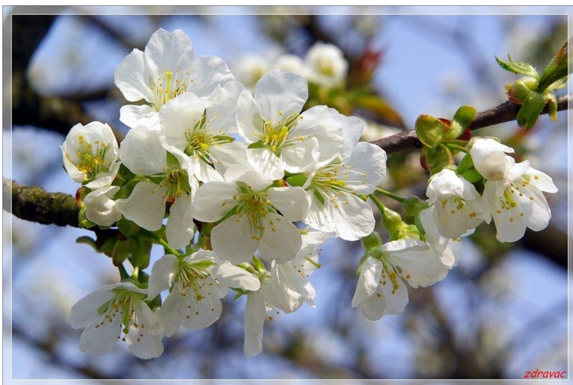
Slika 13. Cvijet trešnje – Prunus avium L.

To je visoko drvo (20 - 30 m), s razgranatom krošnjom. Bijeli cvjetovi su na dugim stapkama i skupljeni su u gronjaste cvati (Slika 13.). Obilno cvjeta u travnju ili svibnja, ovisno o tome radi li se o ranoj ili kasnoj sorti. Cvjetanje jednog drveta traje 10-12 dana. Cvjetovi daju mnoštvo peluda i nektara, pa ih pčele posjećuju tijekom cijelog dana. Med je ugodnog i slatkastog okusa, nježno žute boje, ali se nakon vrcanja kristalizira.