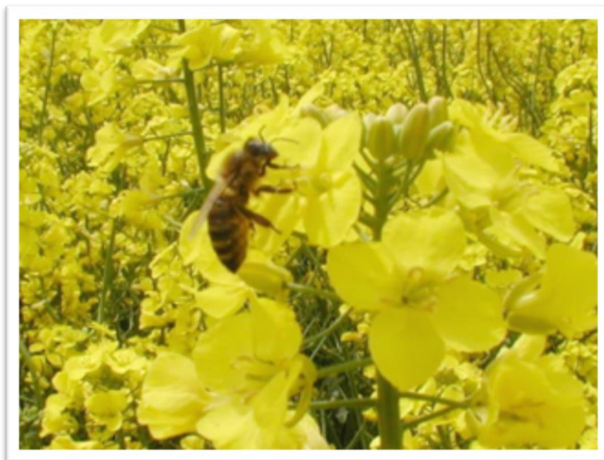
Slika 23. Uljana repica – Brassica napus

Uzgaja se na oranicama za proizvodnju sjemena koje se prerađuje u proizvodnji ulja. Najbolje uspijeva na plodnim i strukturnim tlima, ne preporučuje se sjetva na pjeskovitim i laganim tlima na kojima nema dovoljno vode. Cvjeta od travnja do srpnja. Cvjetovi su sitni i žute boje. Za pčele je uljana repica dobra ispaša jer daje velike količine peluda i nektara. Od uljane repice se dobiju velike količine voska. Med je svjetložute boje i brzo kristalizira.