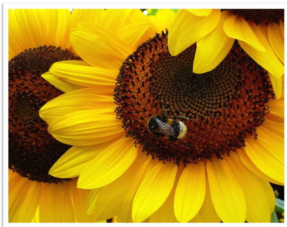
Slika 21. Suncokret – Helianthus annuus

Suncokret najbolje uspijeva na dubokim i plodnim tlima. Najpovoljniji tipovi tala su: černoze, smeđa tla, duboka ritska i aluvijalna tla. Najbolje vrijeme za ispašu pčela je ujutro i predvečer. Med je žute boje no nakon vrcanja kristalizira i otvrdne. Dobar je za prezimljavanje pčela zbog velikog sadržaja peluda.