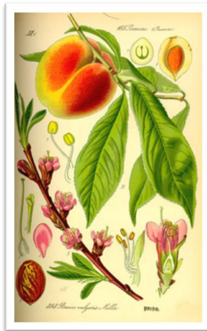
Slika 11. Prunus persica – breskva

Potječe s područja Irana. Potrebno je duboko prozračno, mrvičasto tlo s dosta humusa, ali se širi i na tla slabije kvalitete odabirom prikladne podloge za to područje. Relativno je otporna na sušu, ali su plodovi slabije kvalitete. Za razliku od većine voća, breskva ima pojedinačne ručičaste cvjetove (Slika 12.). Ranije sorte pčele posjećuju već u ožujku. Daje mnogo peluda i nektara.