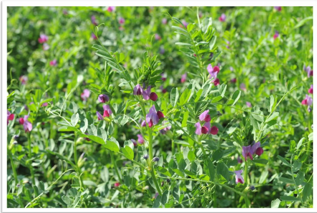
Slika 20. Grahorica - Vicia sp.

Višegodišnje zeljaste biljke, stabljike visoke 30-100 cm. Grahoricama pogoduju tla slabo kisele reakcije. Raste na livadama i pašnjacima, po rubovima šuma, ta na oranicama. Cvijet je smješten u pazušcu lista. Može biti ljubičaste, crvenkaste, plavoljubičaste ili bijele boje, ovisno o kojoj se grahorici radi. Cvjetaju od lipnja do kolovoza. Daju mnogo nektara, no malo peluda. Med je nježno žute boje, kasnije posivi, ima karakterističan okus.