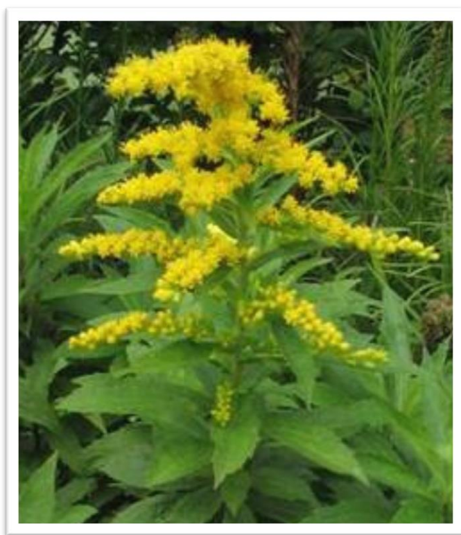
Slika 22. Zlatnica – Solidago virgaurea

Porijeklom je iz Sjeverne Amerike, a u Europu je stigla u 19. stoljeću kao ornamentalna biljka. Kako je zlatošipka veoma invazivna biljka (Nikolić i sur., 2014.) brzo se proširila po kanalima i neobrađenim i napuštenim površinama. Raste na pjeskovitim terenima pored Drave, Save i drugih rijeka. Ovo je višegodišnja zeljasta biljka visine 10-100 cm. Ima cvjetne zlatnožute glavice (Slika 22.) smještene u cvati koje izgledom sličje grozdu. Cvjeta od lipnja do listopada i čini kasnu pčelinju pašu. Med je mirisan i ugodnog okusa, zlatnožute boje.