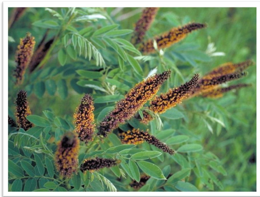
Slika 16. Bagremac – Amorpha fruticosa

Cvijet bagremca stvara mnoštvo peluda i pčele ga posjećuju čitav dan te se od njega može dobiti dosta meda. Med je tamnocrvenkast i ugodan za jelo.