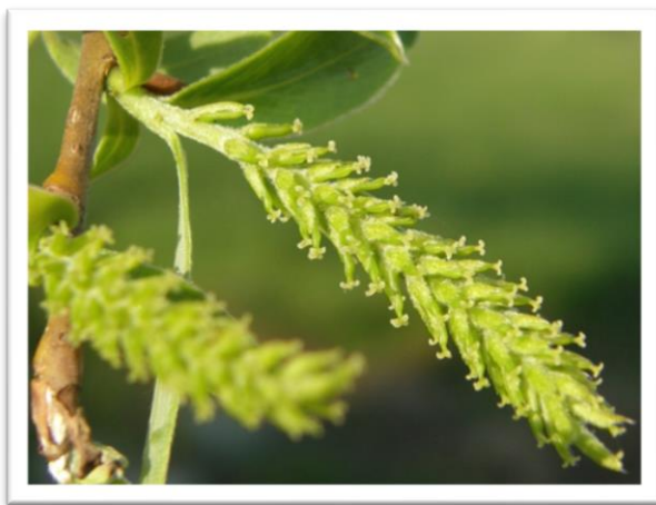
Slika 3. Ženski cvijet ( Salix alba )

Vrbe pčelama osiguravaju ranu proljetnu pašu i zato su važne za pčelarstvo (Šimić, 1980.).