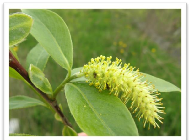
Slika 4. Muški cvijet ( Salix alba )