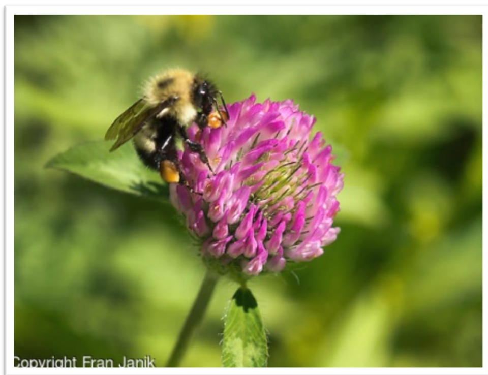
Slika 18. Crvena djetelina – Trifolium pratense L.

Crvena djetelina je višegodišnja biljna vrsta čija je uspravna stabljika visoka 20-50 cm. Crveni cvjetovi skupljeni su u cvatove glavičastog oblika. Cvjeta od svibnja do rujna. Veoma je medonosna biljka, a daje i mnogo peluda. Na crvenu djetelinu (Slika 18.) pčele masovnije idu u drugom otkosu, jer su u prvom prebujne, točnije jer ima preduboke cvjetne čaške s nektarom, pa pčele sa svojim kračim rilom ne mogu dohvatiti nektar. Uspijeva na umjereno vlažnim područjima. Rasprostranjena je kao samonikla na livadama, pašnjacima i svijetlim šumama.