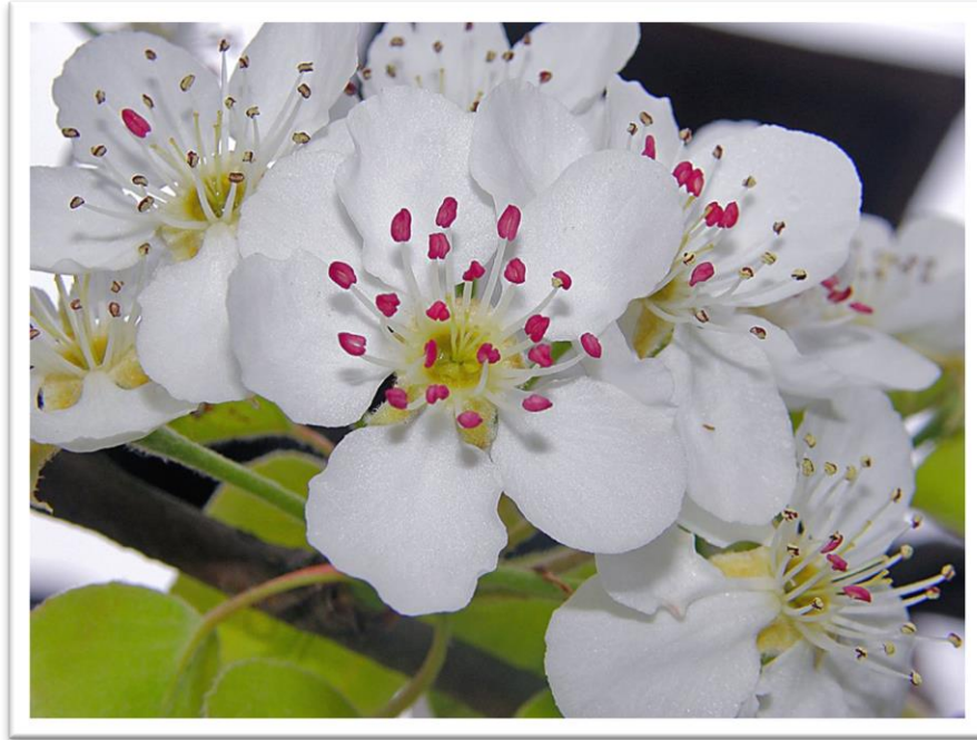
Slika 14. Cvijet višnje – Prunus cerasus

Porijeklom je iz Indije i Irana. Pjeskovite ilovače te ilovasta i ilovasto-glinasta tla pogodna su za rast ove biljke. Višnja je listopadno drvo s tankim granama i gustom krošnjom koje može narasti do 6 m visine. List je jajolikog oblika, a cvjetovi su bijele boje i skupljeni su u gronje. Cvjeta u travnju, te daje pelud i nektar smeđe boje.