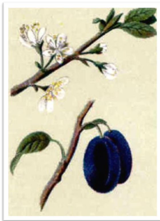
Slika 10. Prunus domestica – šljiva

Ovo listopadno drvo ima razgranatu krošnju, visine od 6-12 metara. Cvjetovi su pojedinačni ili u skupinama, i bijele su boje (Slika 10.). Kod šljiva postoje ranije i kasnije sorte, te kod ranijih sorti ispaša pčela počinje početkom travnja, a za kasnije sorte krajem travnja i traje oko tjedan dana. Ova biljka pčelama daje nektar i pelud. Svojom ranom cvatnjom, šljiva povoljno utječe na proljetni razvoj pčelinje zajednice.