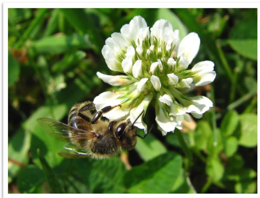
Slika 17. Bijela djetelina – Trifolium repens L.

Ovo je višegodišnja zeljasta biljka s puzećom stabljikom dugom do 40 cm. Najbolje uspijeva na vlažnijim i hladnijim tlima, u brdskom i planinskom području. Dobro podnosi hranivima siromašna tla. Cvjetovi su skupljeni u glavice okruglog oblika i rastresite su. Bijela djetelina (Slika 17.) cvjeta od svibnja, pa do rujna, odnosno dok ne počnu jesenski mrazovi. Cvatnja traje oko 20 dana. Dobro podnosi zimu i niske zimske temperature. Osim nektara daje i nešto peluda tamne boje. Med je svjetlije boje te proziran, ukusnog okusa.