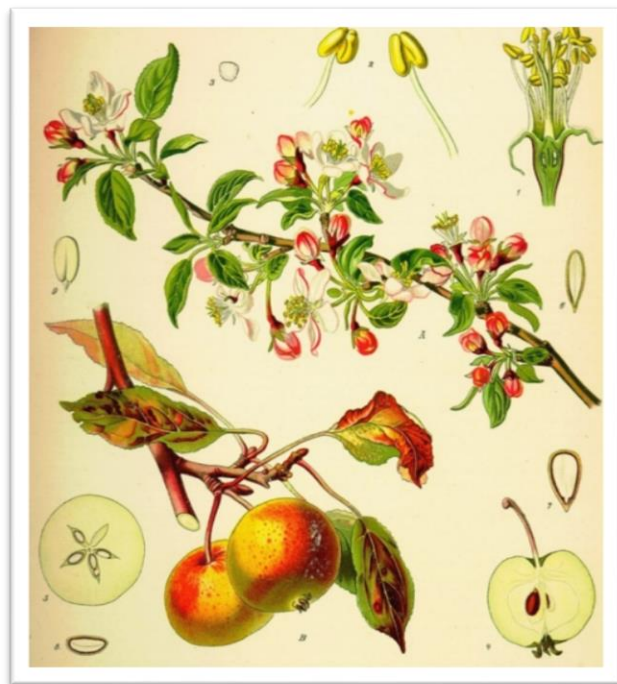
Slika 7. Malus sylvestris – šumska jabuka