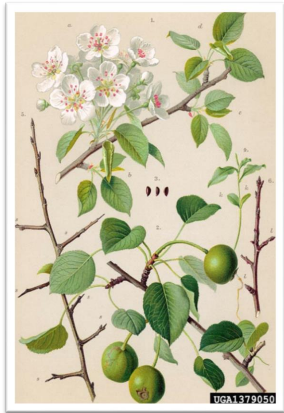
Slika 8. Pirus domestica – kultivirana kruška