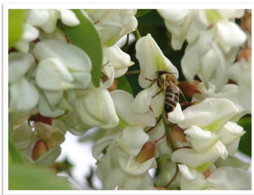
Slika 15. Pčela na cvijetu bagrema – Robinia pseudoacacia L.

Ova biljka daje mnogo nektara, dok peluda daje malo. Najjače luči nektar kada je vrijeme bez vjetra, uz jutarnju rosu i temperaturu iznad 16 0 C. Bagremov med je cijenjena vrsta meda, odlične kvalitete, proziran i gotovo bezbojan.