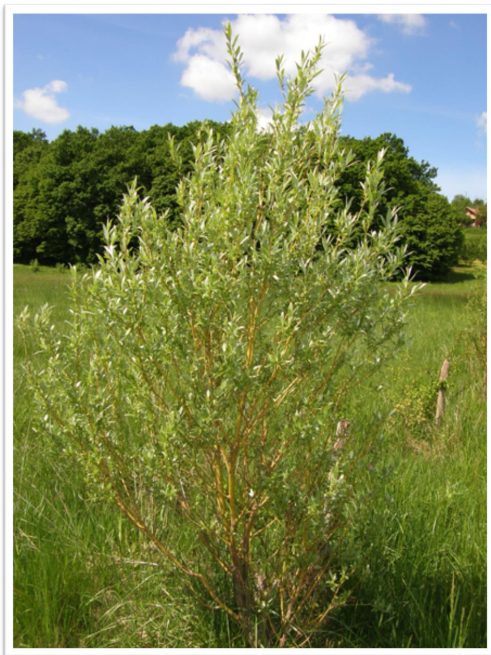
Slika 5. Mlada, grmolika bijela vrba ( Salix alba ) na vlažnoj livadi blizu šume