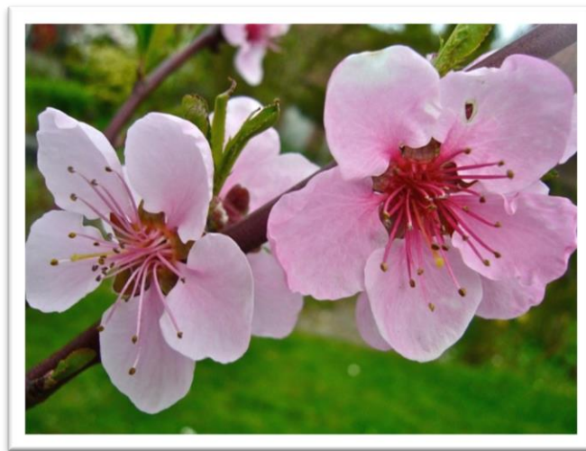
Slika 12. Cvijet breskve – Prunus persica