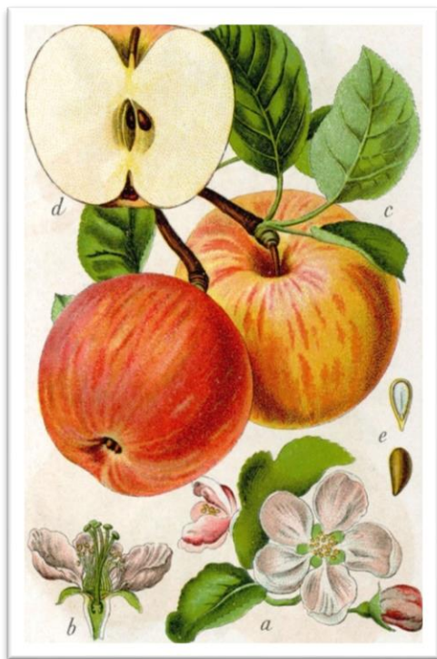
Slika 6. Malus pumila – jabuka