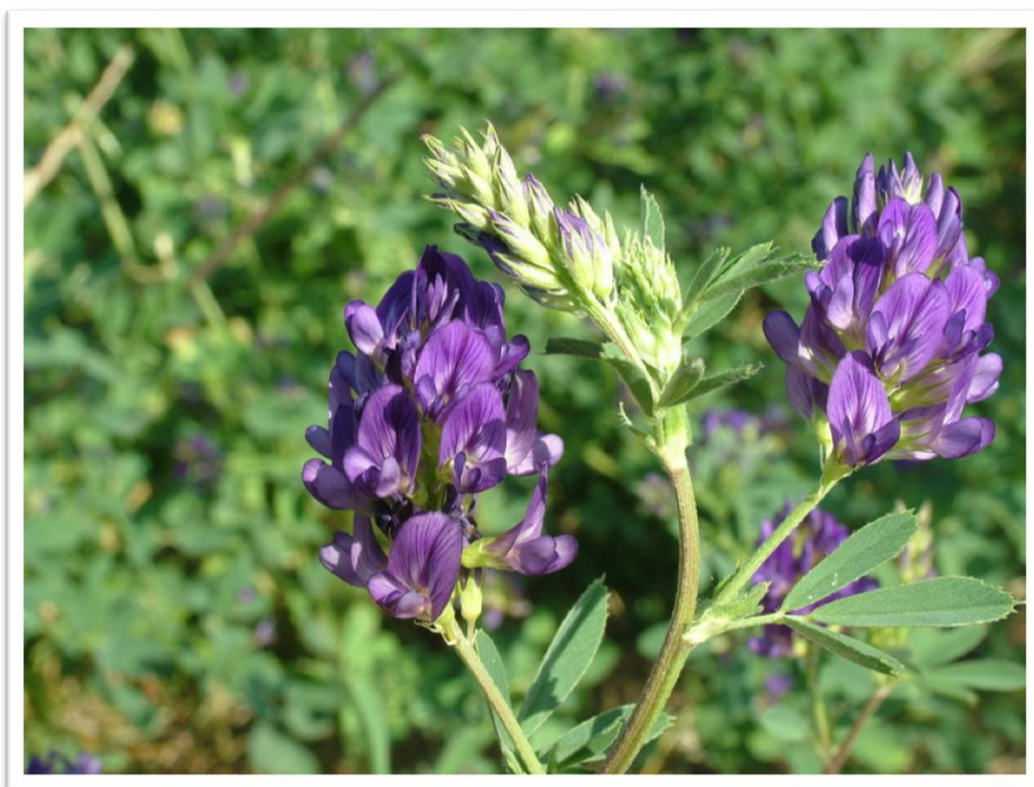
Slika 19. Lucerna – Medicago sativa L.

Raste na livadama, pokraj putova, po vrtovima i nasipima, osim na visokim planinama.