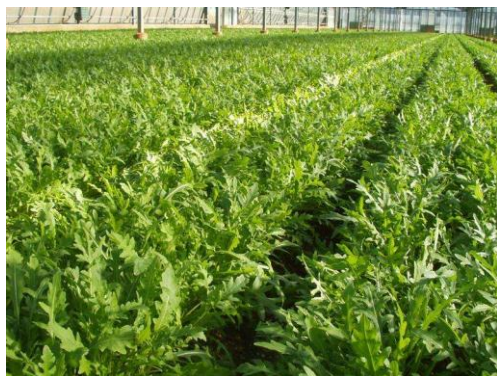
Slika 7. hidroponski uzgoj rukole

Rukola je pogodna i za hidroponski uzgoj (slike 7. i 8.). Uzgoj povrća hidroponskom tehnikom u zaštićenom prostoru, plasteniku ili stakleniku, omogućava proizvodnju i opskrbu tržišta tijekom cijele ili veći dio godine. U hidroponskom uzgoju vrijeme od sjetve do berbe je kraće nego pri uzgoju na tlu, zato što biljka raste u idealnim uvjetima. U zaštićenim prostorima ima manje štetnika i biljnih bolesti pa je zaštita kemijskim sredstvima minimalna. Ipak, usjev treba pregledavati redovito, jer infekcija bolešću i napad štetnika brže se šire nego na otvorenim površinama (Geršek i sur., 2011.).