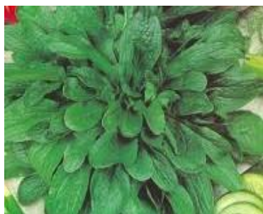
Slika 1. nizozemski širokolisni matovilac

Postoji više sorata matovilca, a u Hrvatskoj su najpoznatije dvije sorte, ljubljanski sitnolisni i nizozemski širokolisni matovilac. Nizozemsku sortu je lakše proizvoditi jer su biljke relativno krupne pa su veći proizvodni učinci. Berba i čišćenje su lakši te daje daleko veće urode od sorata sa sitnijim listovima (slika 1.). Ljubljanski matovilac je autohtoni matovilac iz Slovenije. Listovi su mu srednje veliki, duguljasti, uski, glatki i sjajno zelene boje (slika 2.). Iznimno je otporan na hladnoću.