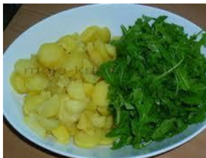
Slika 11. Krumpir s rukolom