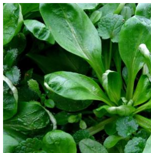
slika 2. ljubljanski uskolisni matovilac