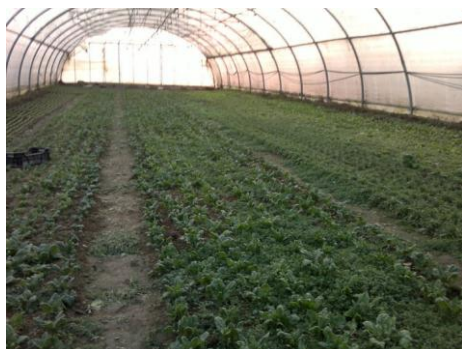
Slika 3. uzgoj matovilca u zaštićenom prostoru

Budući da se matovilac uzgaja tijekom jeseni, zime i ranog proljeća, različiti načini zaštite usjeva, kao što je pokrivanje gredica agrotekstilom ili niskim tunelima mogu pospješiti rast, omogućiti raniju berbu i osigurati bolju kvalitetu. U visokim tunelima ili plastenicima bez zagrijavanja ili sa zagrijavanjem kad temperature padnu ispod minimalne temperature rasta, može se postići berba matovilca zimi pa čak i u više navrata tijekom zime (slika 3.). U zaštićenim prostorima često se primjenjuje uzgoj iz presadnica. Sjetva se obavlja u kontejnere s lončićima od 3 cm po 4 do 8 sjemenki u lončiću. Kasnije se obavlja sadnja u zaštićenom prostoru. Uzgojem matovilca iz presadnica u grijanom zaštićenom prostoru moguća su 4 sukcesivna usjeva tijekom zime.