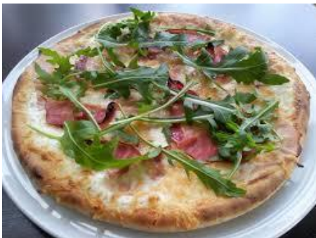
Slika 10. Pizza s rukolom

Rukola je odlična salata, a njezin pomalo gorkasti okus odlično se uklapa gotovo uz sve, od pizze (slika 10.) pa sve do rižota, a osim što joj je okus odličan, vrlo je zdrava namirnica. U kuhinji, rukola se priprema kao salata ili se kuha kao povrće, a nasjeckani listovi se koriste kao začin. Odličan je dodatak miješanim salatama, pitama i tjesteninama te ukusan prilog uz kuhanu rižu i krumpir (slika 11.). Njen oštar okus se odlično uklapa sa kruškama, rajčicama, orasima i sirevima poput parmezana, kozjeg ili plavog sira.