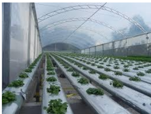
Slika 8. hidroponski uzgoj rukole