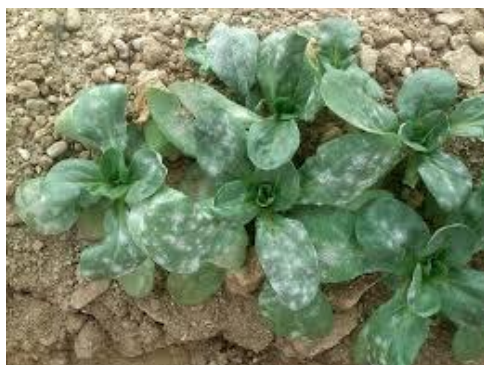
Slika 4. plamenjača matovilca

ZAŠTITA: Matovilac ne treba sijati pregusto. Pojedinačne zaražene biljke treba odstraniti iz usjeva. Djelotvorni su fungicidi za zaštitu salate od plamenjača (Maceljski i sur., 2004.).