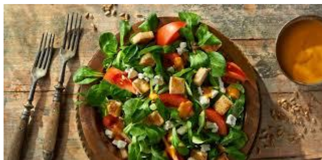
Slika 6. salata od matovilca i rajčice

Matovilac se bere u rano proljeće kao „prva“ salata. Vrlo je dobar izvor vitamina C i željeza, a može sadržavati i do deset puta više vitamina nego ostale salate glavatice. Najčešće se poslužuje uz jela od ribe i bijelog mesa te kao vrlo zanimljiv dodatak širokoj paleti miješanih salata i sendviča. Salata od matovilca, svježe rajčice i vlasca (slika 6.) odlično ide uz lasanje, a salata od rotkvice i matovilca ide odlično gotovo uz svako mesno jelo.