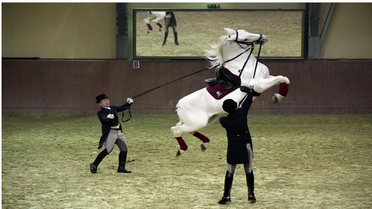
Slika 1. Božićni bal lipicanaca ( http://vs-djakovo.hr/wp-content/uploads/photo-gallery/10296434_10153756308715505_3597300152658647289_o.jpg )

Predstava sadrži elemente glume, u kojoj se jasno vide elementi ustrajnog dresurnog rada kao što su propnjevi, levade, pesade, komplimenti, rad na dugim uzdama bez jahača, "Pas de Deux" i gracioznost lipicanaca u izvođenju Quadrille. U predstavi sudjeluju jednoprezi, dvoprezi, četveroprezi, jahači te lipicanci bez jahača. Božićni bal lipicanaca je najveća i najspektakularnija predstava konja u hrvatskoj, a i šire ( http://www.ergela-djakovo.hr/content/bozicni-bal-lipicanaca-2015 ).