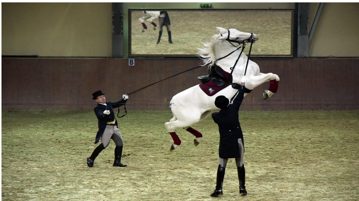
Slika 1. Božićni bal lipicanaca

Predstava sadrži elemente glume, u kojoj se jasno vide elementi ustrajnog dresurnog rada kao što su propnjevi, levade, pesade, komplimenti, rad na dugim uzdama bez jahača, "Pas de Deux" i gracioznost lipicanaca u izvođenju Quadrille. U predstavi sudjeluju jednoprezi, dvoprezi, četveroprezi, jahači te lipicanci bez jahača. Božićni bal lipicanaca je najveća i najspektakularnija predstava konja u hrvatskoj, a i šire ( http://www.ergela-djakovo.hr/content/bozicni-bal-lipicanaca-2015. ).