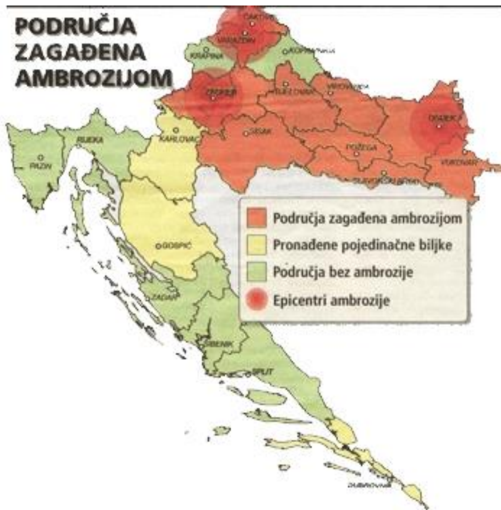
Slika 7. Područja zagađena ambrozijom

željezničke pruge, na obalama rijeka, na nekultiviranim mjestima, na gradilištima, te na oranicama kao korov u kukuruzu, suncokretu, šećernoj repi, te povrtnjacima.