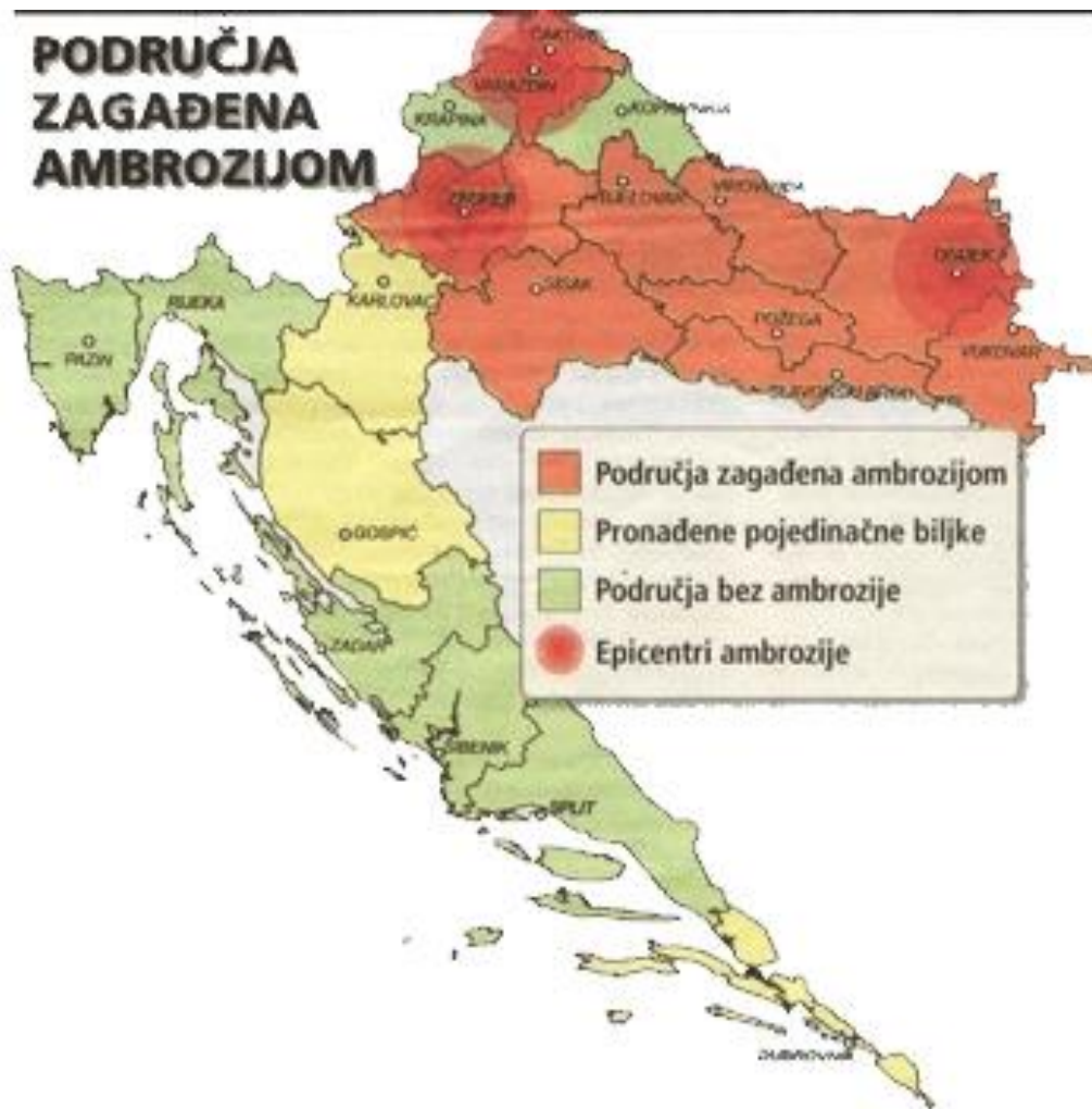
Slika 7. Područja zagađena ambrozijom

željezničke pruge, na obalama rijeka, na nekultiviranim mjestima, na gradilištima, te na oranicama kao korov u kukuruzu, suncokretu, šećernoj repi, te povrtnjacima.