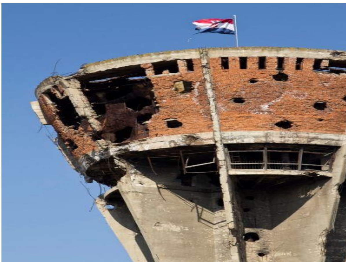
Slika 4: Vodotoranj, Vukovar

Sve do rata, na vrhu Vodotornja nalazio se restoran s vidikovcem na Vukovar, Dunav i okolno srijemsko vinogorje. Tijekom srpske agresije na Vukovar, Vodotoranj bio je jedna od najčešćih meta neprijateljskog topništva koje mu je nanijelo više od šest stotina oštećenja danas predstavlja simbol pobjede i nepobjedivosti. Objekt se neće obnovljati u izvornu funkciju nego će postati Memorijalno područje koje će podsjećati na patnje i boli koje je Vukovar proživio. 42