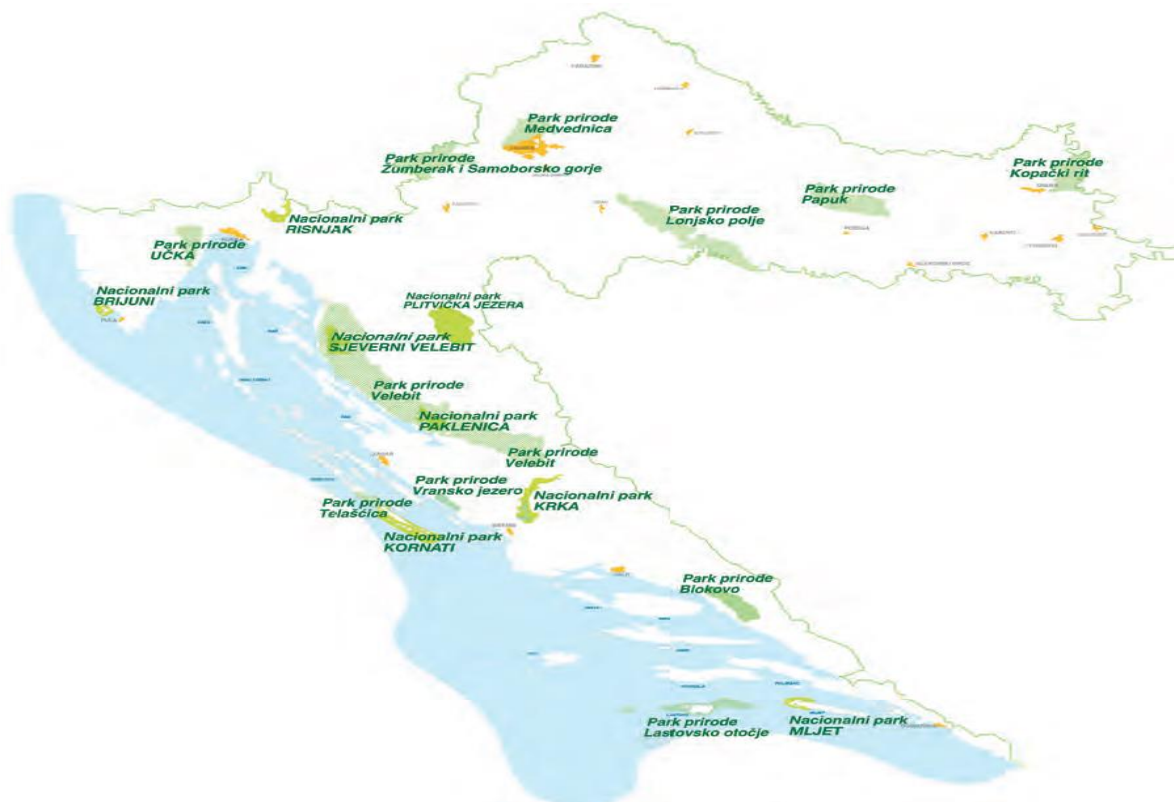
Slika 3: Prikaz Parkova prirode i Nacionalnih parkova Republike Hrvatske