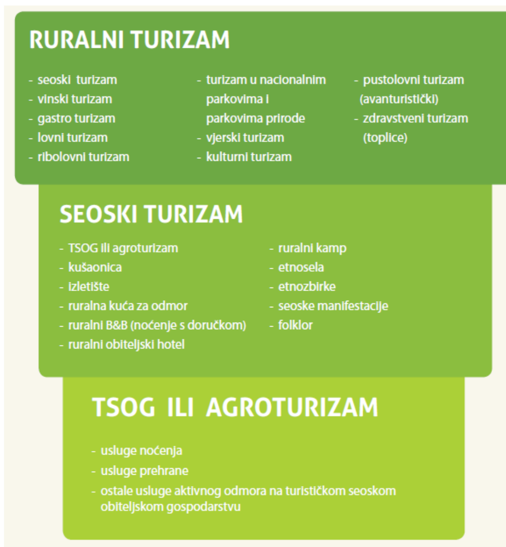
Slika 1: Pojavni oblici ruralnog turizma