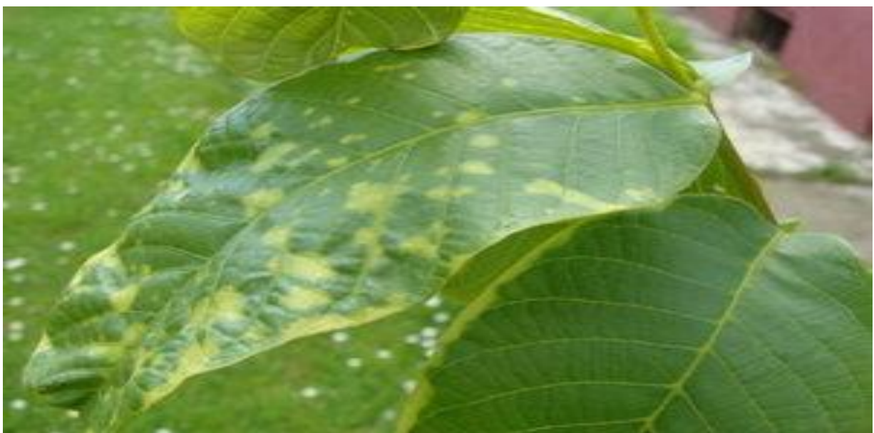
Slika 13 . Oštećenje na orahu

Najčešći razlozi pojave fitotoksikoze su primjena prevelike doze, zanošenje vjetrom, primjena u nepovoljnim vremenskim prilikama, kriva fenofaza, osjetljive sorte kulturnih biljaka, rezidualni ostatci i neispravnost sredstva. Neispravnost prskalice je čest uzrok pretjerivanja količine sredstva. Često kod korištenja orošivača u voćnjacima i vinogradima zbog drifta dolazi do većeg gubitka zaštitnog sredstva, koje može uzrokovati trovanje kod ljudi, životinja i divljači (Barčić, 2001). Zanošenje se javlja kod prskanja pri jakom vjetru te bi se zbog ovoga razloga herbicidi trebali primjenjivati pri mirnom vremenu. Herbicidi mogu ostati duže vrijeme u tlu ili u vodama te u tom vremenu biti aktivni. Njih tada mogu usvajati biljke koje nismo htjeli tretirati. Preko prevelikih tretiranja dolazi da nakupljanja kemikalija u biljkama, te biljke nisu pogodne za ljudsko zdravlje. Mnoge od tih kemikalija mogu biti aktivne u tlu nekoliko godina poput atrazina, trifluarina, itd. Neki korovi ostaju u biljnim proizvodima i dijelovima koji se koriste u ljudskoj i životinjskoj ishrani te tako dođe do sekundarnog trovanja.