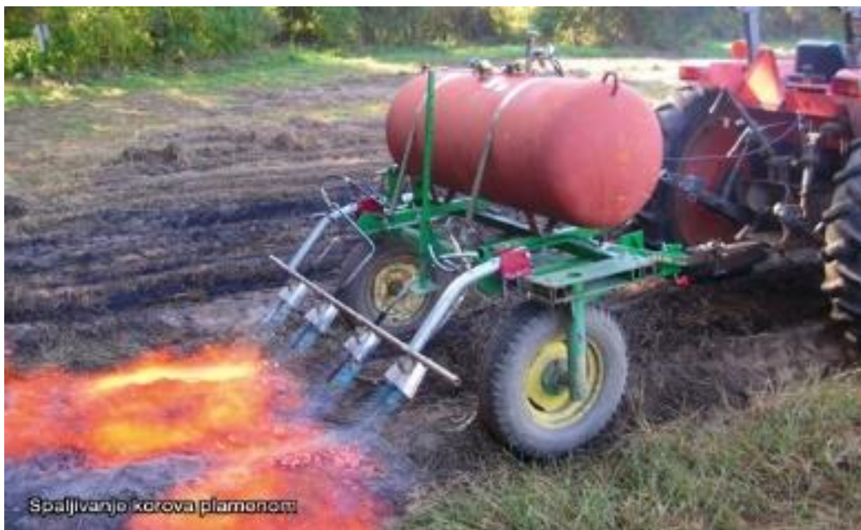
Slika 10. Stroj za suzbijanje korova plamenom