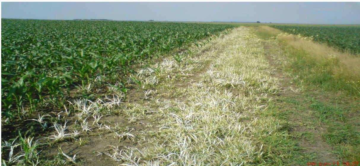
Slika 12. Herbicidi u kukuruzu

Herbicide koristimo u tri roka: prije sjetve, nakon sjetve i nakon nicanja. Prije sjetve primjenjujemo rezidualne herbicide tako da ih tretiramo po tlu ili inkorporiramo u tlo. U ovom razdoblju biljka usvaja herbicid kroz korijen te često odumre tijekom nicanja. Nakon sjetve koristimo rezidualne i folijarne herbicide. Rezidualne koristimo po tlu dok folijarne ako je korov već iznikao te ima prve listove. Nakon nicanja koriste se folijarni herbicidi. Oni mogu biti sistemični i kontaktni. Kao što je objašnjeno defolijanti djeluju tako da uništavaju nadzemne dijelove biljke. Budući da u ovom u ovom vremenu korovi imaju nekoliko listova, herbicidi su izuzetno korisni (Slika 12.).