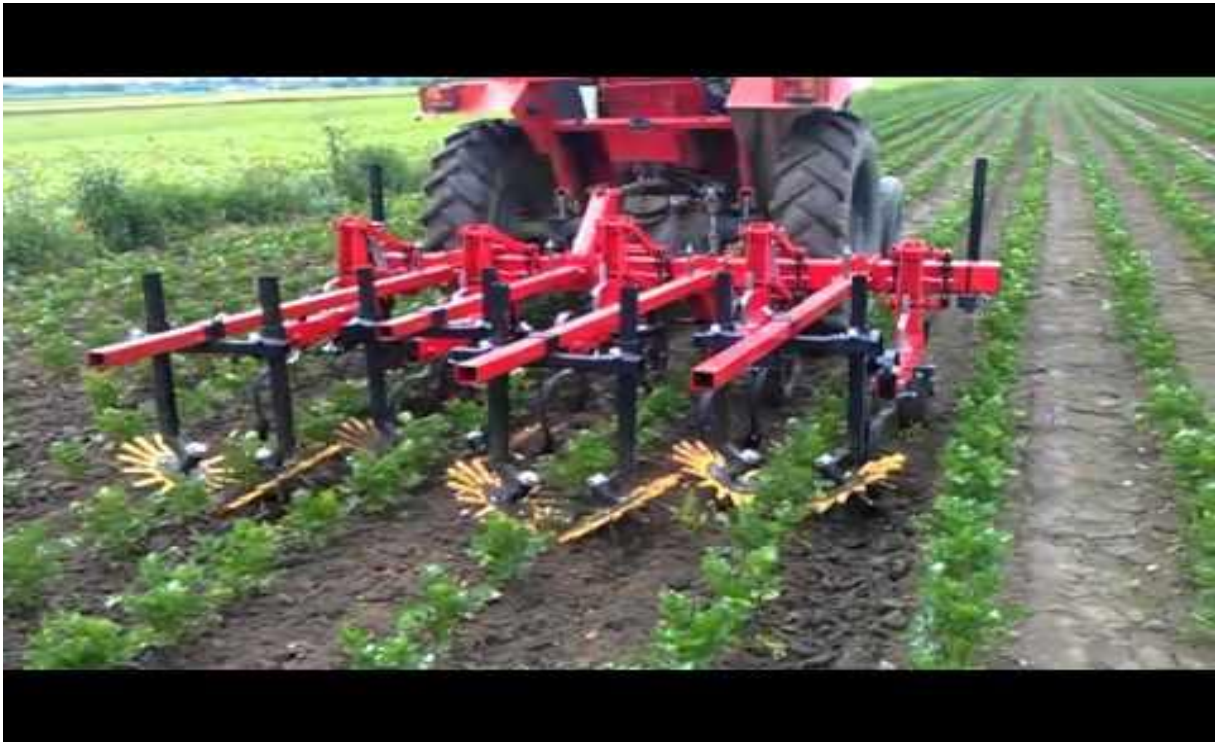
Slika 4. Fingerweeder

To je jedna od mjera koje se mogu bez većih problema koristiti na manjim površinama, ne zahtijeva posebnu mehanizaciju i ekološki je prihvatljiva. Na većim površinama se može ručno vršiti ako je napad na posebnim mjestima. Često se ova mjera mora izvoditi par puta mjesečno (ovisno o vegetaciji korova). Pomoću te mjere ručno ili strojno čupamo korov s naših površina. Jedni od strojeva koje se koriste su takozvani fingerweederi (Slika 4.). To su nastavci koji se stavljaju na kultivatore te rade tako da hvataju biljku prstima te je iščupaju iz zemlje.