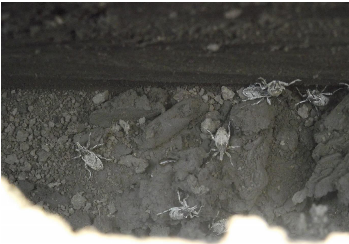
Slika 17. : Lovni kanal za repinu pipu