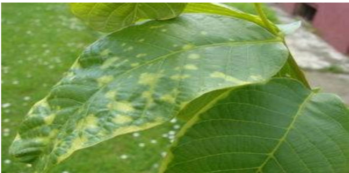
Slika 13 . Oštećenje na orahu

Najčešći razlozi pojave fitotoksikoze su primjena prevelike doze, zanošenje vjetrom, primjena u nepovoljnim vremenskim prilikama, kriva fenofaza, osjetljive sorte kulturnih biljaka, rezidualni ostaci i neispravnost sredstva. Neispravnost prskalice je čest uzrok pretjerivanja količine sredstva. Često kod korištenja orošivača u voćnjacima i vinogradima zbog drifta dolazi do većeg gubitka zaštitnog sredstva, koje može uzrokovati trovanje kod ljudi, životinja i divljači (Barčić, 2001). Zanošenje se javlja kod prskanja pri jakom vjetru te bi se zbog ovoga razloga herbicidi trebali primjenjivati pri mirnom vremenu. Herbicidi mogu ostati duže vrijeme u tlu ili u vodama te u tom vremenu biti aktivni. Njih tada mogu usvajati biljke koje nismo htjeli tretirati. Preko prevelikih tretiranja dolazi da nakupljanja kemikalija u biljkama, te biljke nisu pogodne za ljudsko zdravlje. Mnoge od tih kemikalija mogu biti aktivne u tlu nekoliko godina poput atrazina, trifluarina, itd. Neki korovi ostaju u biljnim proizvodima i dijelovima koji se koriste u ljudskoj i životinjskoj ishrani te tako dođe do sekundarnog trovanja.